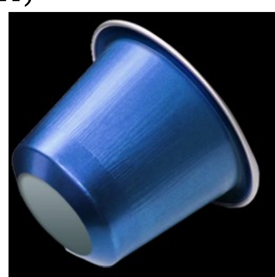
Figura 2: cápsula de café.