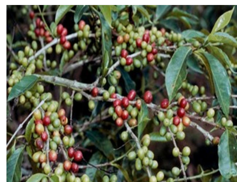
Figura 1: Planta da espécie Coffea arabica (Kew science, 2017)