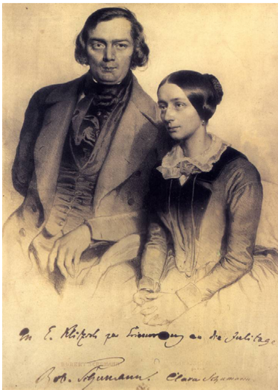
Robert Schumann e Clara Schumann em 1847