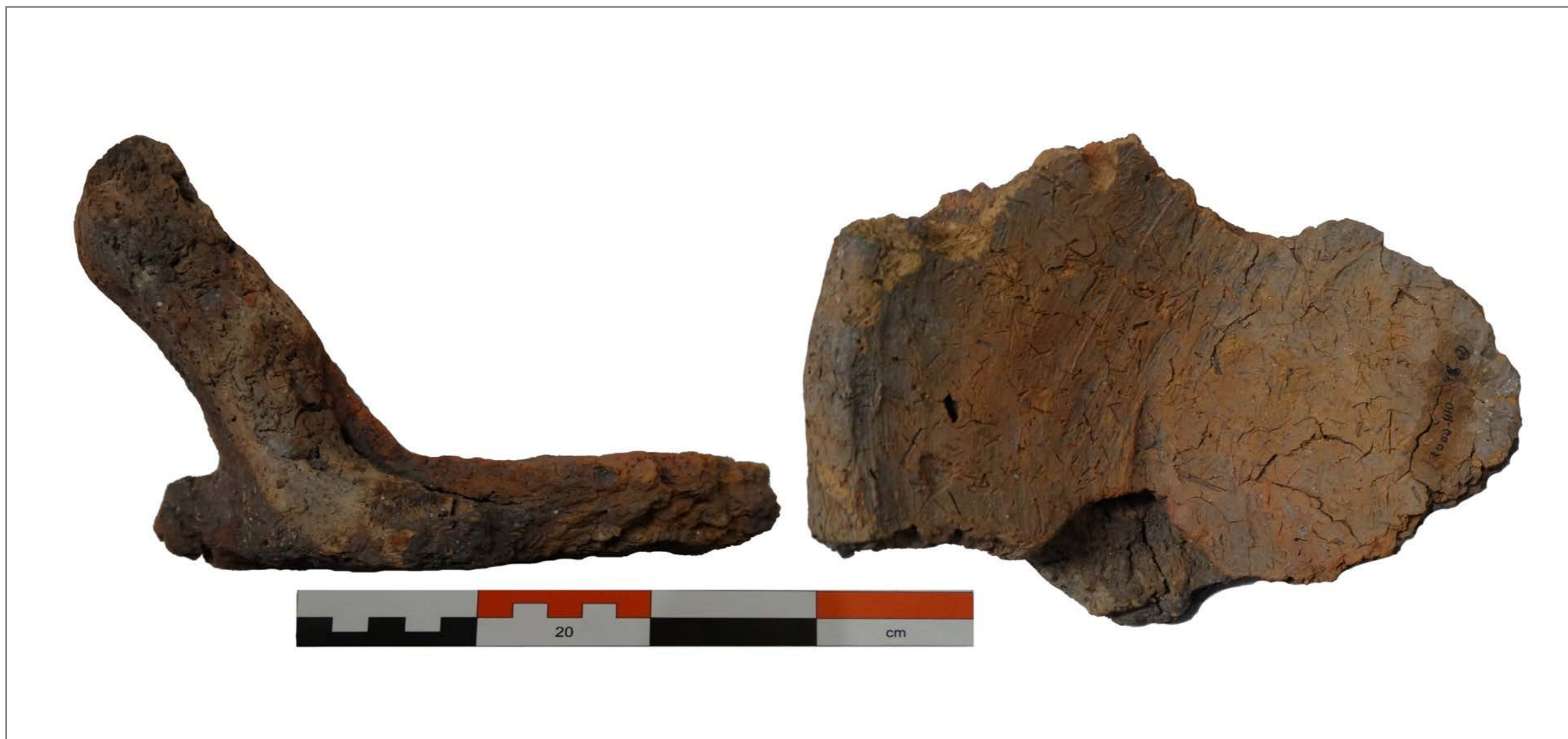
Fig. 1 - Alguidar modelado manualmente de Conimbriga.

As cerâmicas medievais serão das materialidades com uma sistematização mais incipiente no contexto nacional. O interesse tardio pela temática, a inexistência de referentes cronológicos durante grande parte do período ou a insistência em abordagens essencialmente tipológicas são algumas das explicações disciplinares e metodológicas para esse panorama.