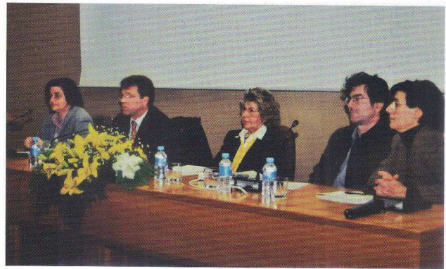
5º Encontro Nacional Professores Matemática 1º Ciclo. 2002.