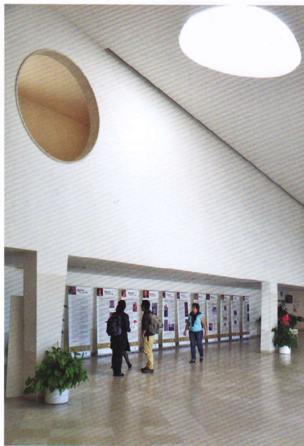
Exposição Memórias e Feminismos. 2014.

Ao longo destes anos, de diferentes maneiras e em diversos momentos, a ESE tem sido, no Campus do Instituto Politéc-