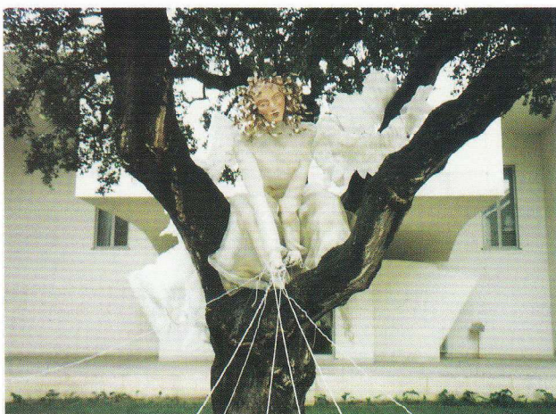
Exposição de Natal de 2005.