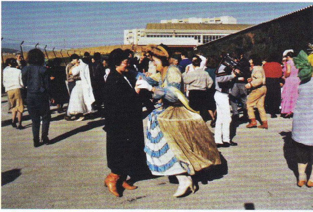
O comboio Fantasma – Antiga Fábrica Barreiros. 1987.