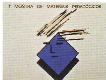
1ª Mostra de Materiais Pedagógicos.

Estava lançado o desafio que animava o projeto mais amplo de educação e formação. A par com os cursos de formação inicial, estruturados de forma rigorosa e inovadora, a Escola avançava por caminhos alargados de educação não formal e informal, estruturava redes de educadores e professores lo-