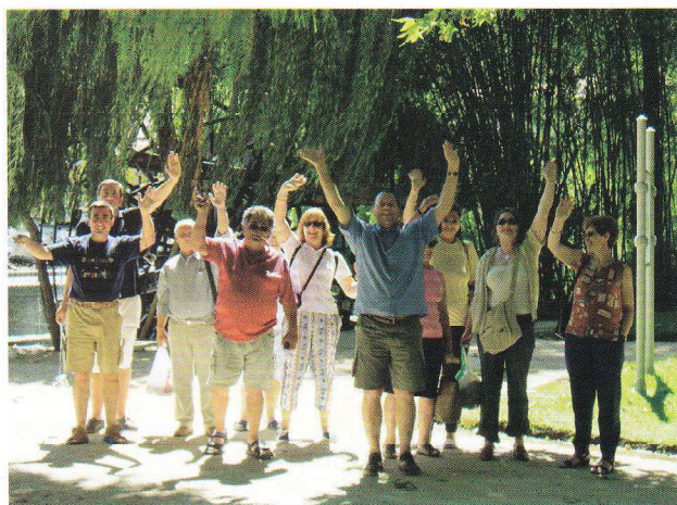
2004 – Visita cultural dos funcionários não docentes a Tomar.

Em simultâneo, a Escola incentivou e apoiou os encontros e reencontros de estudantes, antigos estudantes, docentes e não docentes, não só numa perspetiva educativa e cultural, mas também de convívio e desenvolvimento de laços de amizade e sentimento de pertença.