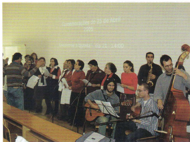
Encontros à Quinta. Comemorações 25 abril 21 Abril 2005.