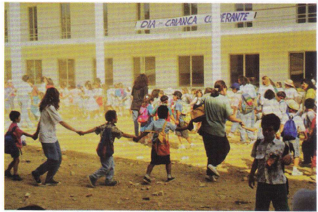
Encontro da Criança Cooperante. 1991.

nos diversos locais que a abrigaram durante os primeiros anos, o mundo e os acontecimentos que construíam a história, em simultâneo com práticas pedagógicas mais inovadoras e o desenvolvimento de novas áreas profissionais.