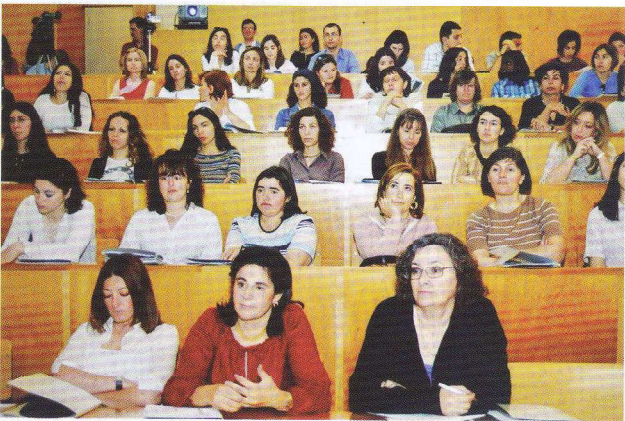
Reencontrar a Escola. Encontro com ex-alunos da ESE. 2003.