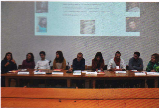
Percursos Profissionais Conversas com antigos Alunos Janeiro 2014.

temente, proporcionaram uma nova abordagem que consiste na interação dos estudantes com os profissionais dos media . Não ficaram esquecidas as oportunidades de convívio e lazer, as homenagens a personalidades que à ESE dedicaram anos de trabalho, as exposições de artistas quer da comunidade escolar quer da comunidade envolvente, os intercâmbios internacionais quando ainda não existia o Programa ERASMUS e tantas outras atividades que sedimentaram uma Escola de contornos científicos e relações interpessoais, fortemente ancoradas no rigor, em valores pedagógicos inovadores e num espírito aberto ao mundo e à mudança.