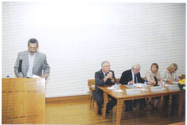
II Encontro de Estudos Locais. 2010.

Realizaram-se conferências nacionais ou de âmbito internacional, seminários de estudos locais, apresentações de trabalhos dos estudantes, abertas a profissionais, encontros sobre tecnologias de informação e comunicação, no âmbito do projeto Minerva e outros, e seminários das diferentes áreas de saber presentes nos currículos. Foram convidados pensadores e investigadores que suscitaram a reflexão e organizados concertos e palestras de grandes nomes da política e da democracia portuguesa, de artistas setubalenses e nacionais. Todas estas atividades multiplicaram-se e certamente con-