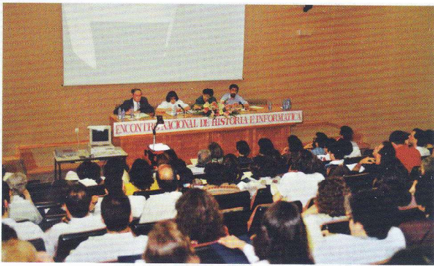
Encontro Nacional de História e Informática. 1991.