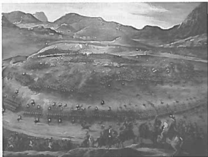
Figura 1 – A batalha de Almansa