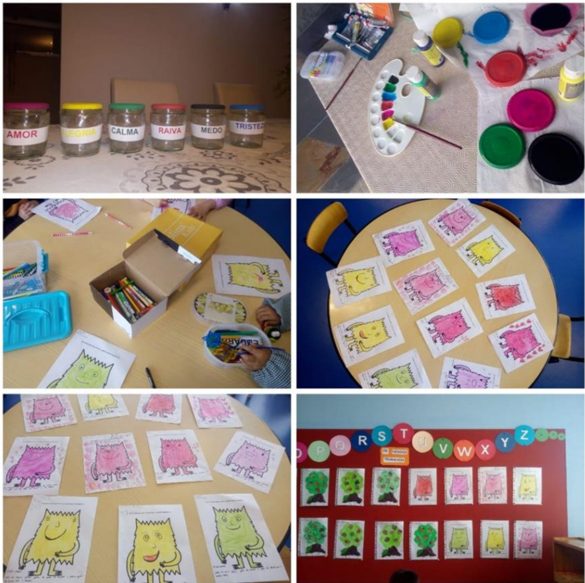
Figura 5: Colorir o “Monstro” – Preparação e resultados

Foi entregue às crianças um monstro das cores sem rosto e sem cor, cujo objetivo era que cada uma desenhasse a emoção que estava a sentir naquele momento e para complementar a mesma teriam de pintar o rosto do monstro das cores com a cor correspondente (ex: azul: tristeza, preto: medo,... etc), favorecendo a consciencialização das suas emoções e como lidar com cada uma delas, associando assim as emoções à cor que cada uma representa.