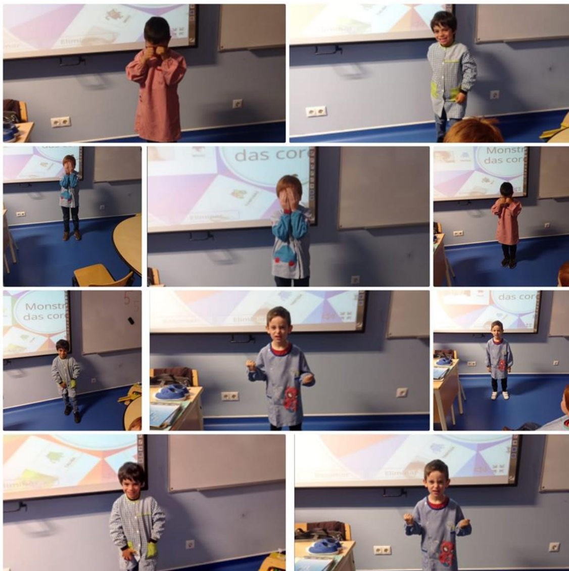
Figura 4: Jogo da Mímica

As crianças foram capazes de mimetizar as emoções selecionadas e de identificar as expressas pelos demais.