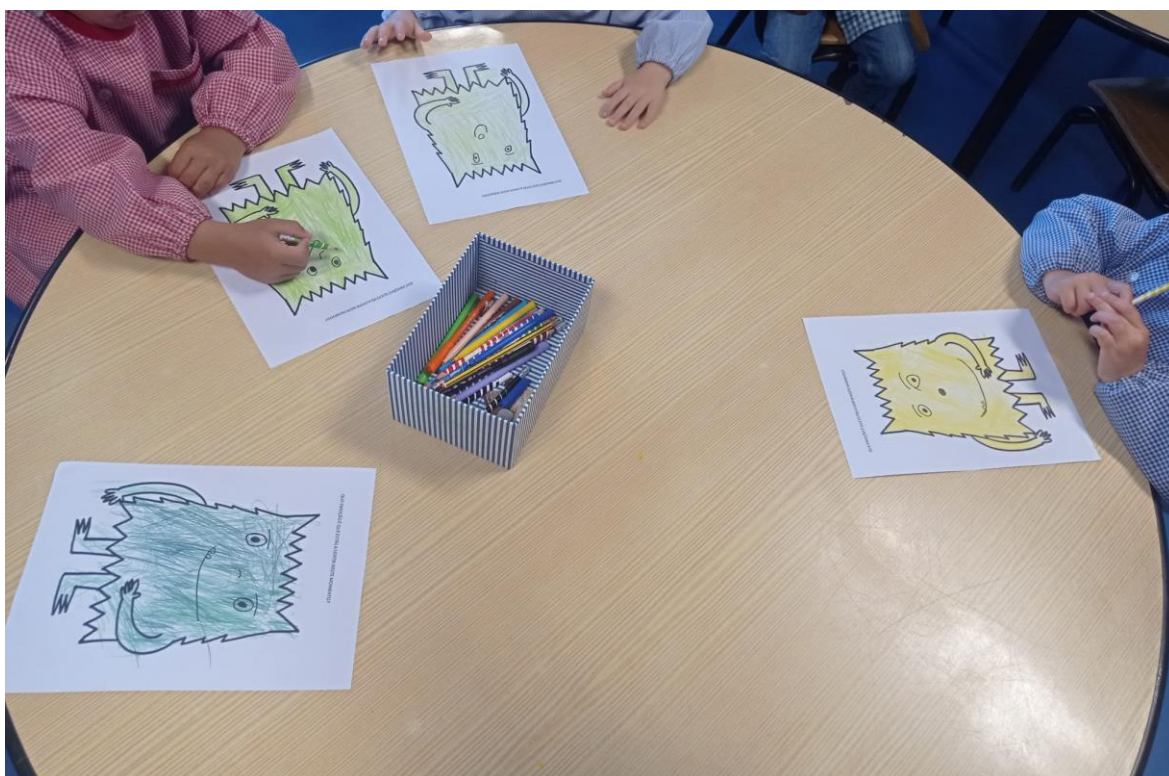
Figura 6: Colorir o “Monstro” – As emoções e as cores

De salientar que algumas crianças evidenciaram emoções menos positivas, pelo que houve a necessidade de trabalhá-las. Esse trabalho foi realizado conjuntamente com todas as crianças, convidando-as a falar e a dar sugestões de como lidar com a emoção, até acedermos à forma mais eficaz de autogestão.