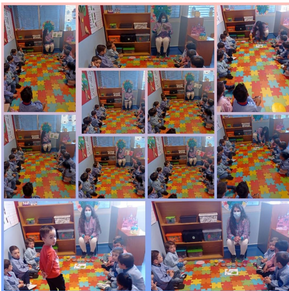
Figura 1: Leitura de “O Monstro das Cores” e Atividade Experimental

As crianças compreenderam a atividade e assimilaram o conteúdo da história, foram capazes de identificar as emoções e associar às respectivas cores simbólicas.