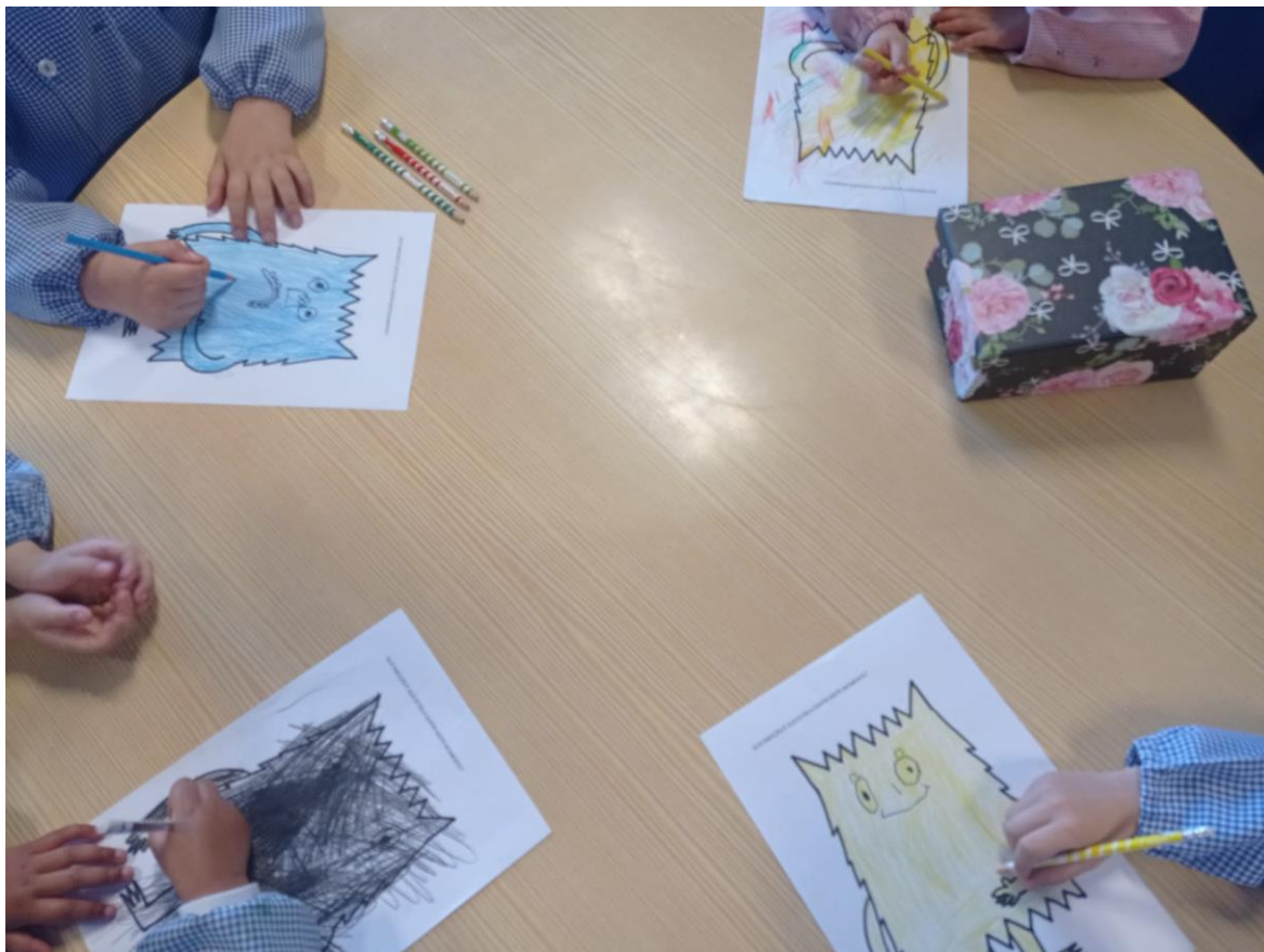
Figura 7: Colorir o “Monstro” – As emoções menos positivas

Verificou-se que, em grande grupo, as crianças foram não apenas capazes de identificar emoções, mimetizá-las, mas também de auxiliar aqueles que não tinham emoções tão positivas a lidar com elas, de modo engraçado e descontraído, facilitando a transição para outro tipo de emoções.