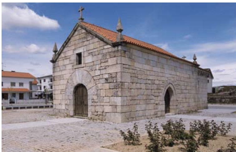
Fig. 15 – Capela de Santa Luzia (Trancoso)

esculpido em granito, do seu interior, renasce, constitui uma das peças mais originais da arte sacra desta zona. Próximo de Torre de Moncorvo, na aldeia de Adeganha, encontra-se uma igreja tardo-românica, o que nos dá a medida certa da presença de uma forte sobrevivência românica nas zonas de Trás-os-Montes e da Beira Alta (figs. 8, 9 e 10). Hesitando entre os finais do século XIII e o século XIV, apresenta um pórtico com arco quebrado de decoração geométrica, torre sineira, de dois arcos, no remate central da fachada. Apresenta um grande interesse pela sua decoração escultórica. A representação de motivos do quotidiano é visível na composição historiada da fachada, onde se relata um parto. Incluem-se ainda, no quadro dos temas do quotidiano, representações de pipas, numa clara alusão às colheitas vinícolas da região. A cachorrada apresenta ainda elementos animais, entre porcos, pássaros e touros. Na zona