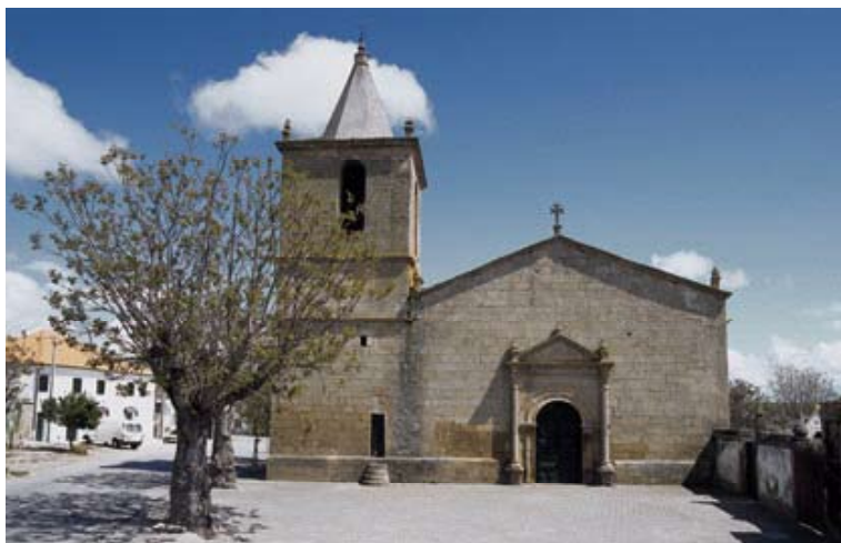
Fig. 5 – Igreja Matriz de Escalhão