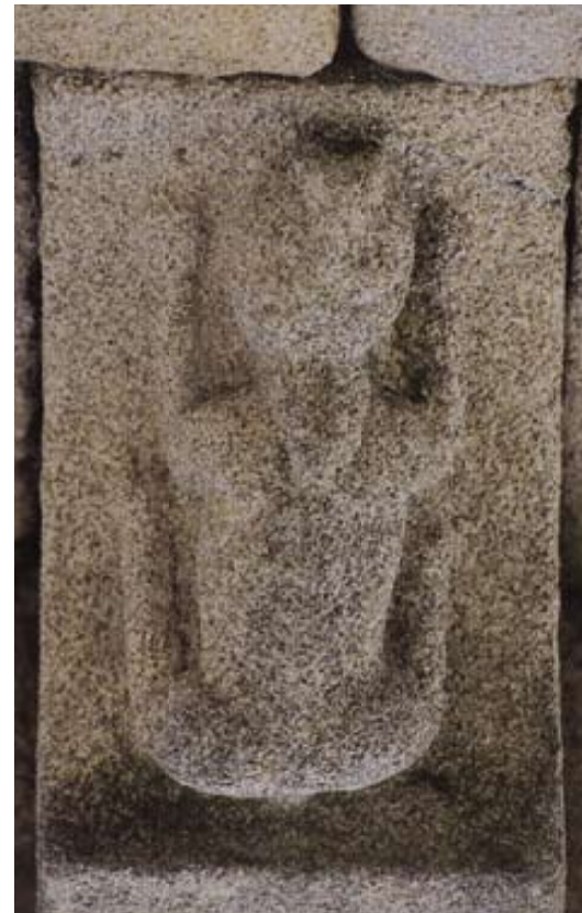
Fig. 16 – Capela de Santa Luzia (Trancoso)

Segue-se Trancoso. Na sede de concelho, a Capela de Santa Luzia (figs. 15 e 16) revela uma interessante escultura nos modilhões, onde se encontram curiosas representações de figuras humanas e de seres mitológicos, nomeadamente uma das raras aparições de sereias de caudas entrelaçadas. É possível também observar o tratamento do tema do castigo numa representação em que um homem é engolido por uma fera. É uma igreja românica, datada do século XII / XIII, com corpo longitudinal, rectangular e arco triunfal, quebrado. Situada fora do núcleo urbano, integrada no cemitério, surge a Igreja de Nossa Senhora da Fresta