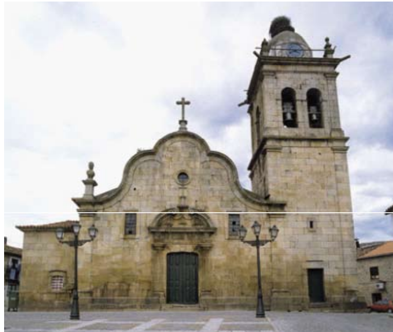
Fig. 4 – Igreja Matriz de Figueira de Castelo Rodrigo

A época tardo-medieval, bastante avançada e que entra pelo século XVI, constitui terreno menos fértil