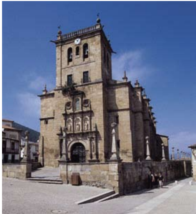
Fig. 7 – Igreja Matriz de Torre de Moncorvo

Em direcção à fronteira vai encontrar-se Alfaiates com idêntica dualidade de construções: a igreja da Misericórdia e a paroquial. A Igreja da Misericórdia (fig. 2) é bastante arcaizante e tardia, com corpo baixo, cobertura em madeira e fraca iluminação. Se pela datação corresponderia ao gótico, a traça manifesta fortes resistências românicas. No seu interior encontra-se uma interessante peça de escultura medieval, do século XIII – uma pia baptismal com motivos geométricos. A Igreja Paroquial é dedicada ao orago Santiago da Pedra, data do século XVII e forma com o adro e a escadaria que o