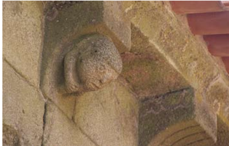
Fig. 19 – Igreja de Nossa Senhora da Fresta (Trancoso)

Toda esta área atravessa uma fase de profunda recuperação patrimonial que marca a época em que vivemos, plena de preocupações com o passado, resignada à obrigatoriedade de conservar testemunhos, generosa para com as épocas que entretanto introduziram alte-