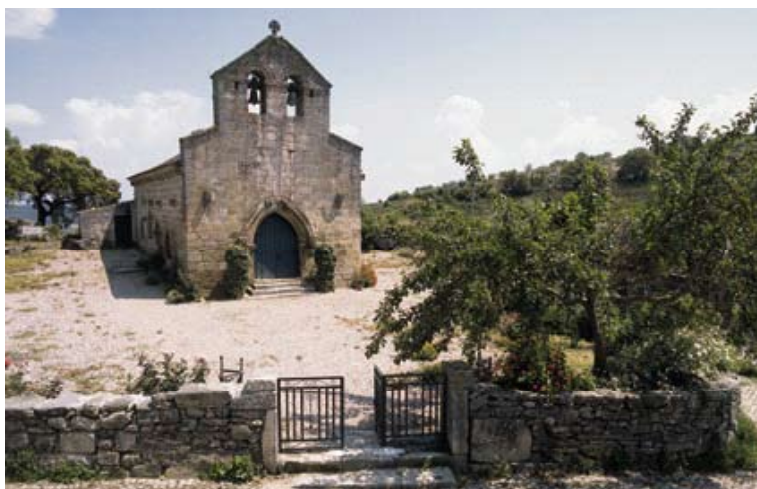
Fig. 8 – Igreja da Adeganha

Vilar Maior faz parte de uma linha de povoados de fronteira que possui também o castelo que a habilitou a desempenhar um papel primordial nas questões conflituosas que entre Portugal e Espanha ao longo do tempo aconteceram, desde as mais remotas, ligadas à definição da fronteira, às mais recentes, associadas à entrada dos franceses, passando pelos episódios da ocupação e da restauração de 1640. A