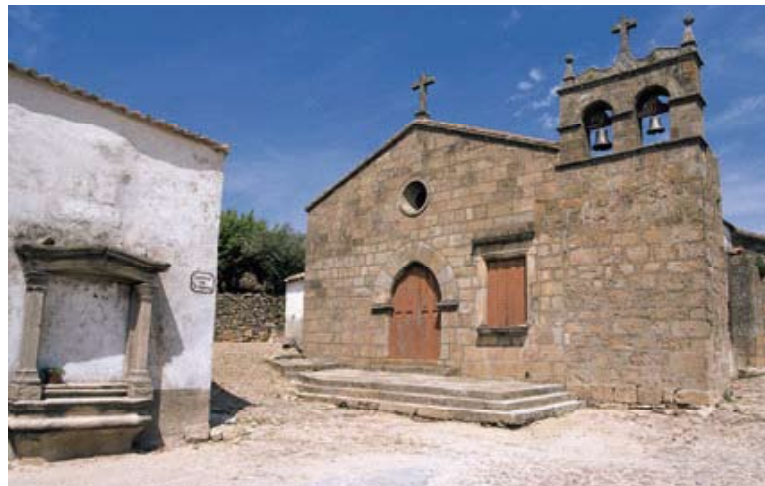
Fig. 20 – Igreja de Santa Maria do Castelo (Pinhel)