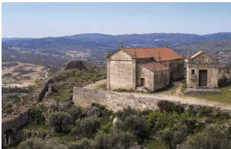
Fig. 14 – Igrejas no recinto muralhado de Marialva