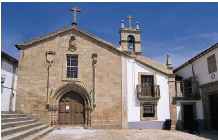
Fig. 21 – Igreja da Misericórdia (Pinhel)

rações ao figurino inicial. Observa-se a sinalização dos programas de recuperação financiados, entre outras, por essa entidade vaga chamada Europa e sente-se que estas campanhas serão decisivas para manter e divulgar a imagem da região, ainda que a ideia da contingência de todas as acções esteja presente. Esta dualidade, de compromisso com o tempo e de total contingência, paira inevitavelmente sobre os trabalhos de recuperação e restauro. E para o provar, observem-se outros momentos do passado preocupados com a preservação do património edificado. Perto de algumas igrejas fronteiriças, no adro, o padrão das Comemorações de 1940, numa atitude de paternalismo estéril, evoca as vicissitudes da ocupação estrangeira em legendas como: Foi saqueada, incendiada, sofreu pela Pátria. A Espanha é uma sombra. Junto a algumas destas igrejas subsistem outros elementos que lembram o passado conturbado: sabe-se, por exemplo, da existência de redutos militares ou fossos de defesa, remontando à época das invasões francesas.