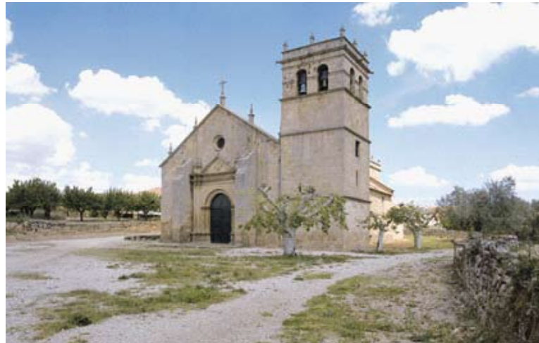
Fig. 13 – Igreja Matriz de Almendra

A talha retabular, em estilo nacional, aparece na Igreja da Misericórdia, de origem quinhentista. Do século XVI data o seu pórtico renascentista, numa fachada sóbria e austera, rematada por um frontão triangular onde se abriu o vão para o sino. Apresenta ainda o pormenor curioso de incluir nos medalhões que o ladeiam, a figura dos doadores, num gosto típico da época de personalizar as obras. O púlpito