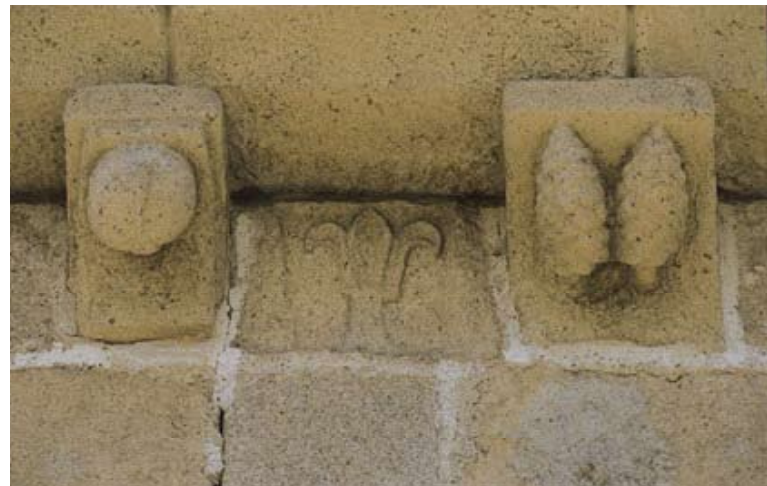
Figs. 9 e 10 – Igreja da Adeganha

Continuando em direcção ao norte, e sempre na fronteira, o concelho seguinte é o de Figueira de Castelo Rodrigo. Antes da vila, vai aparecer o povoado fortificado de Castelo Rodrigo, onde a minúscula Igreja Matriz, de Rocamadour, de fundação românica, se apresenta extremamente frustre, com um pequeno adro. A cachorrada contorna-a a toda a volta e o pelourinho espreita, próximo. Todos os ingredientes de um passado interveniente de que hoje são os únicos testemunhos. No interior, o recheio decorativo data dos séculos XVI e XVIII, caso do tecto de caixotões da capela-mor com pinturas alusivas à vida de santos. Também antes da vila, mas junto à fronteira, numa estrada muito secundária, Escarigo possui um dos templos mais pequenos da região. Integrava a rota de peregrinação a Santiago de Compostela. A Igreja Matriz (fig. 3) é já do período manuelino, com uma só nave e arcos diafragma no interior, quebrados, abrangendo transversalmente todo o espaço da igreja, correspondentes aos contrafortes implantados no exterior. O modelo é o que já se apreciou na matriz de Vilar Formoso e tem ainda correspondente na igreja matriz de Vilar Torpim, deste mesmo concelho. O principal motivo de curiosidade de Escarigo consiste no tecto de laçaria mudéjar, do século XVI, onde impera o azul e o vermelho.