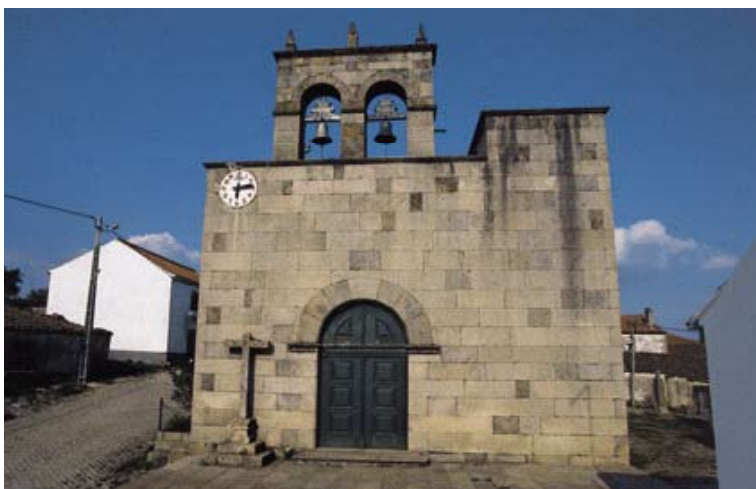
Fig. 3 – Igreja Matriz de Escarigo

ou à atribuição de certas peças que decoram os seus interiores. Predomina o sentimento de transição em relação a numerosas igrejas que mantêm severidade românica mas insinuam já um arco típico de época posterior ou uma cobertura gótica. Edifícios de charneira, resistindo à inovação e deixando-se penetrar por novos modelos apenas muito lentamente, esta arquitectura é pouco permeável a datações imediatas e espontâneas.