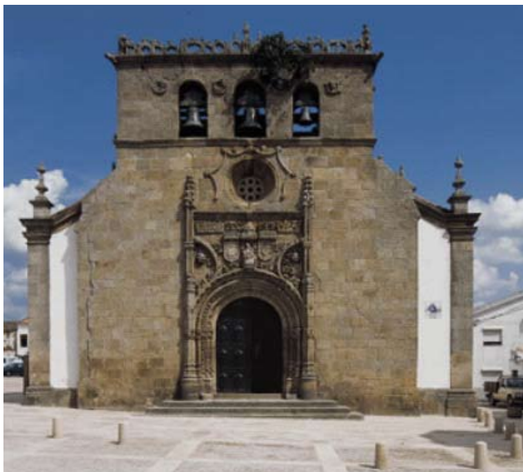
Figs. 11 e 12 – Igreja Matriz de Vila Nova de Foz Côa