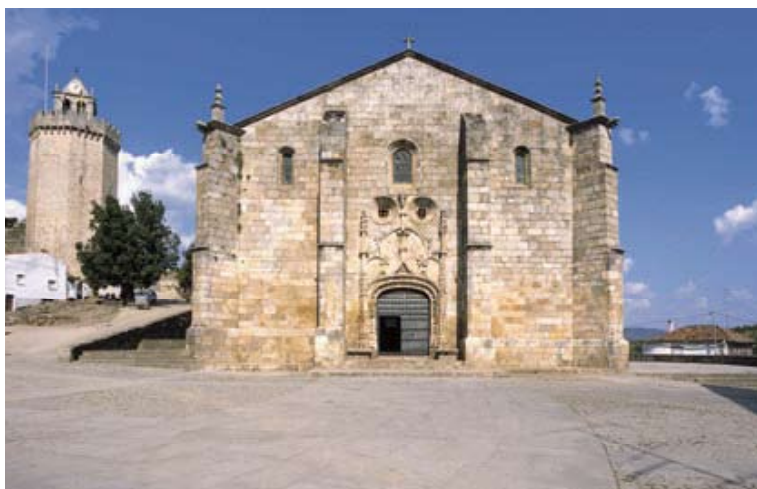
Fig. 6 – Igreja Matriz de Freixo de Espada à Cinta

de exploração nesta região. Exemplos manuelinos e proto-renascentistas podem, ainda assim, presenciar-se em Pinhel, Freixo de Espada à Cinta, Vila Nova de Foz Côa, Almendra e Torre de Moncorvo. Encontram-se neste grupo as igrejas mais referidas pela historiografia da arte portuguesa que dá especial relevo aos casos da matriz de Freixo e da matriz de Moncorvo. Do período manuelino, ou ainda de momentos mais avançados do século XVI, datam certas igrejas apresentadas frequentemente como românicas ou góticas: casos de Escarigo (Figueira de Castelo Rodrigo) e Vilar Formoso (Almeida).