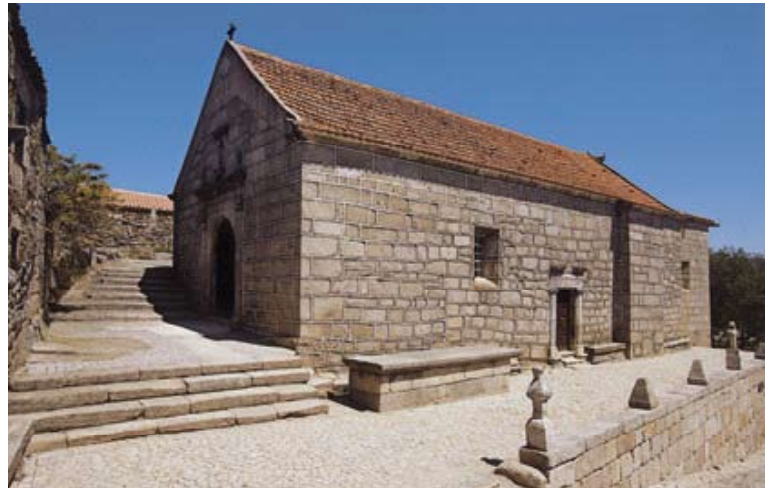
Fig. 1 – Igreja Paroquial de Sortelha

São às dezenas as igrejas de vilas, aldeias e lugares. A esmagadora maioria apresenta um aspecto muito simples, com fachadas em pedra nua ou caiadas e praticamente desprovidas de decoração, excepção feita para a moldura de um vão ou para a marcação da entrada num tratamento mais cuidado. No entanto, e como sempre faz a história da arte, é preciso recortar pedaços de território e verificar modos de construir, cuja regra é imposta por uma comunicação mais eficaz com modelos exteriores à região. Pontualmente, far-se-á uma chamada de atenção para casos que se enquadram naquele vasto panorama de obras anónimas, que sempre se secundarizam, quando soluções especialmente expressivas o justificarem. A historiografia dá pouco relevo a esta arquitectura provinciana que, com poucas excepções, não tem estimulado muito a investigação. Permanecem nos autores dúvidas quanto à datação das edificações