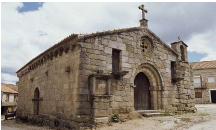
Fig. 2 – Igreja da Misericórdia de Alfaiates