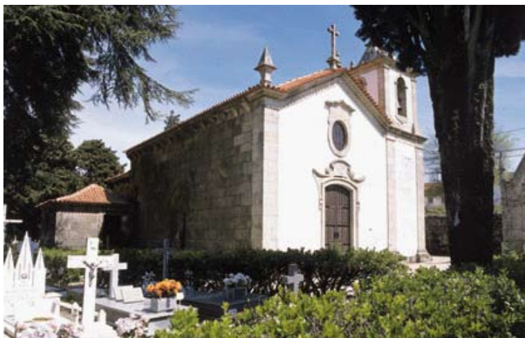
Figs. 17 e 18 – Igreja de Nossa Senhora da Fresta (Trancoso)