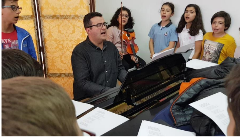
Figura 32 - O professor e os alunos em aula de revisão das canções rústicas e tradicionais portuguesas, acompanhados ao piano

Um bom professor deixa em cada um dos seus alunos uma marca indestrutível que perdura no tempo.