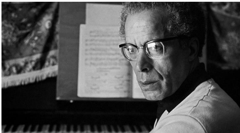
Figura 28 - A figura e a personalidade de Fernando Lopes-Graça

Numa primeira parte, o trabalho encontra-se conformado por um referencial teórico no qual se elegeu como figura predominante a personalidade de Fernando Lopes-Graça, enquanto musicólogo, etnomusicólogo, compositor e investigador nos domínios da canção rústica e popular portuguesa .