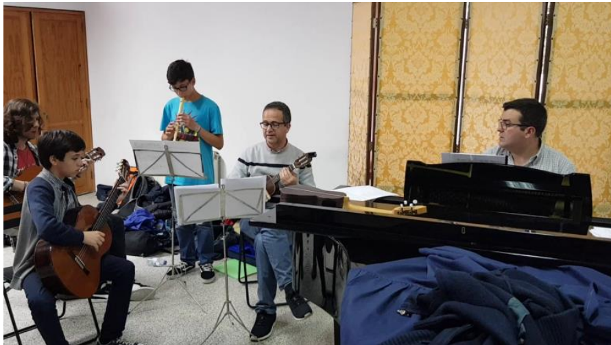
Figura 31 - O professor acompanha a aula com piano e orienta os conteúdos da sessão

Em suma, os alunos puderam constatar, hoje, e em pleno, as canções já aprendidas e o enriquecimento da sonoridade quando acompanhadas com os cordofones populares. As reações finais dos alunos foram bastante satisfatórias, o que me leva a crer que os objetivos foram atingidos acima da média esperada.