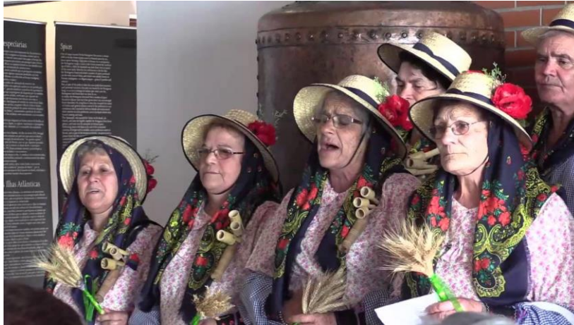
Figura 1 - Um Grupo Coral de ceifeiras do Alentejo

As paisagens inspiradoras de cantos tradicionais , ora de tradição oral , ora de tradição escrita , de instrumentos musicais variados e de trajes verdadeiramente típicos, pensamos serem caminhos de aprofundamento de raízes socioculturais, antropológicos e estéticos, proporcionadores de novas visões e de novas perspetivas nos contextos de uma educação artística mais atenta e mais cuidada. Procuraremos, assim, difundir o gosto e a importância de que se reveste o património artístico e musical português junto das nossas populações juvenis (Sousa, 2015).