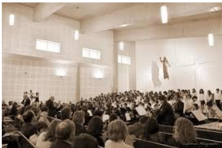
Figura 8 - Um concerto com toda a comunidade educativa, de encerramento do ano letivo de 2017/2018 uma das inúmeras atividades realizadas fora da Fundação Conservatório Regional de Gaia