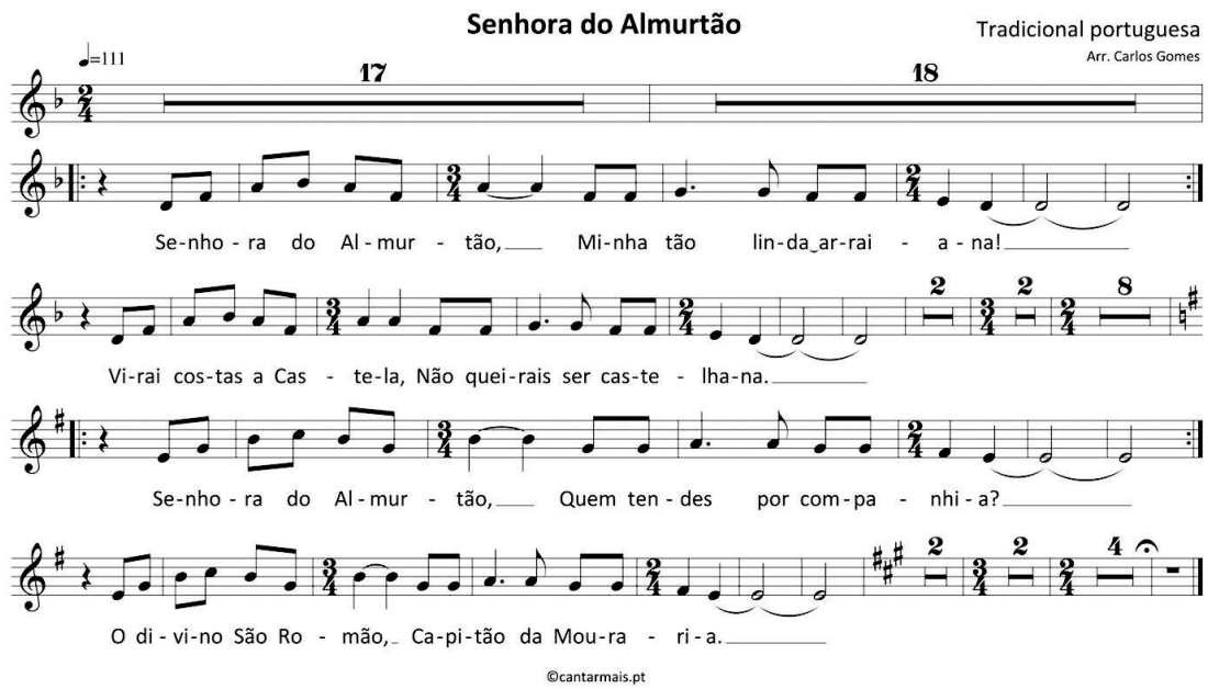
Figura 12 - Partitura Senhora do Almutão