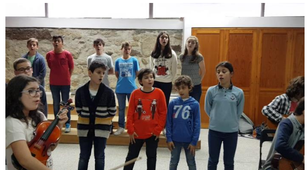
Figura 27 - Os jovens cantam as canções em estudo