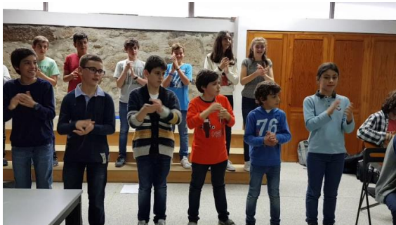
Figura 26 - Os alunos acompanham o ritmo da canção

Foi o noivo mais a noiva Foi o noivo mais a noiva Com um ramo de laranjeira Quem seria a caiadeira