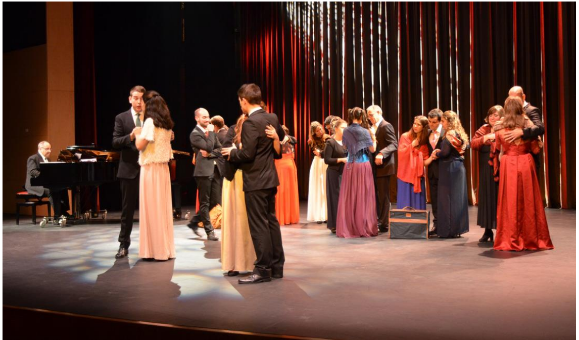
Figura 9 - Uma atividade de performance do Estúdio de Ópera do Conservatório Superior de Música de Gaia, no Auditório Municipal de Gaia