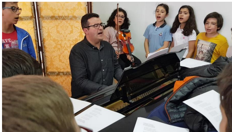
Figura 19 - O professor e os alunos em aula de revisão das canções rústicas e tradicionais portuguesas, acompanhados ao piano.