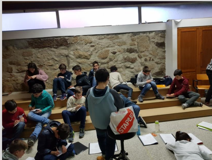
Figura 10 - Alunos escrevem nos diários de bordo