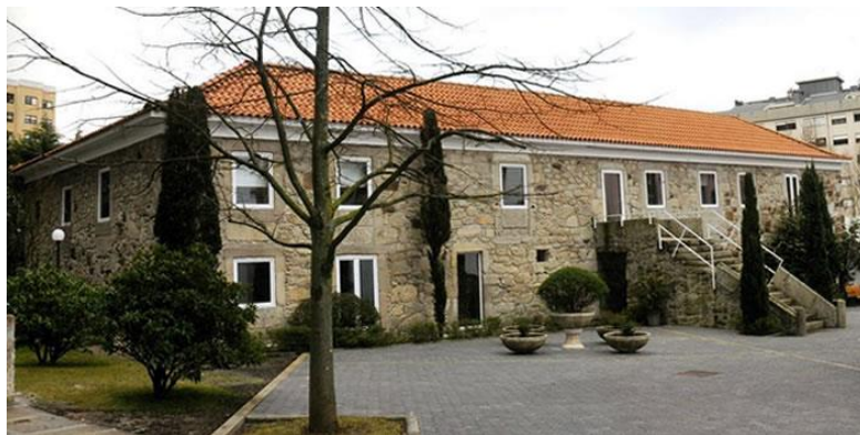
Figura 6 - A Fundação e Conservatório Regional de Gaia

Esta investigação-ação decorreu na Fundação Conservatório Regional de Gaia (FCRG), em colaboração com o Conservatório Superior de Música de Gaia (CSMG).