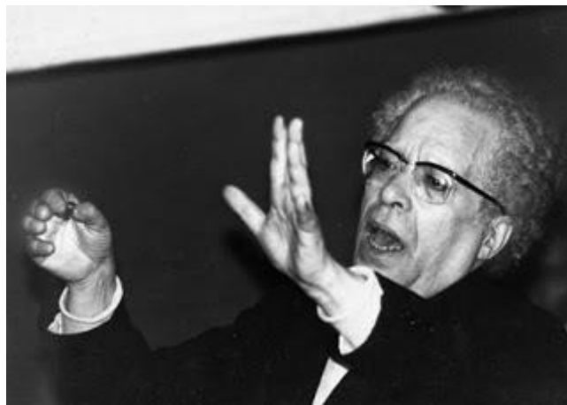
Figura 2 - Fernando Lopes-Graça na regência do Grupo Coral de Montijo

Mário Vieira de Carvalho, na obra de sua autoria: Pensar a música, mudar o mundo: Fernando Lopes-Graça (2006), ao analisar a figura de Fernando Lopes-Graça, como músico e compositor português, afirma o seguinte: