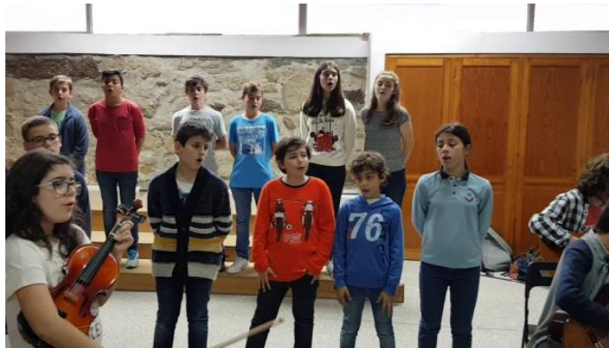
Figura 30 - O interesse dos alunos no concerto final