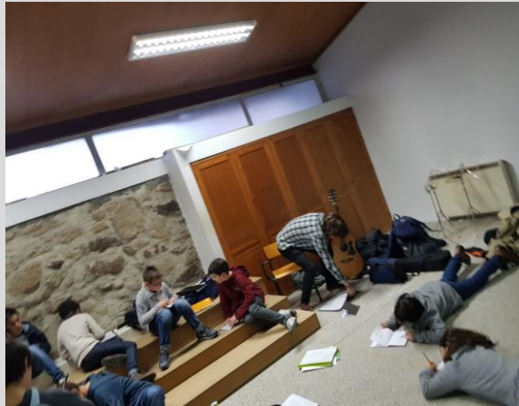
Figura 21 - Os alunos escrevem nos diários de bordo