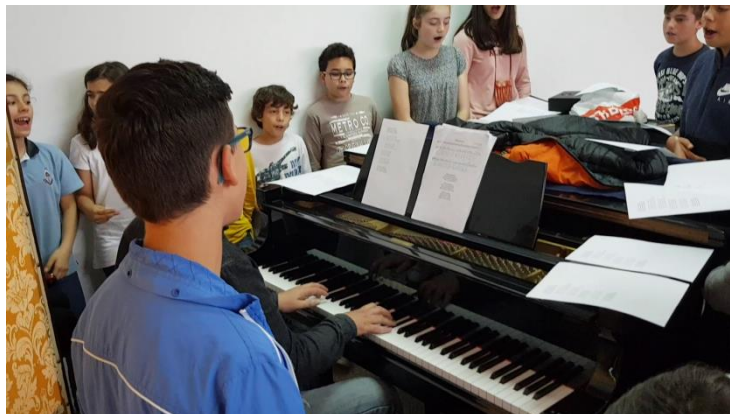
Figura 13 - A participação e a motivação dos alunos nas canções rústicas