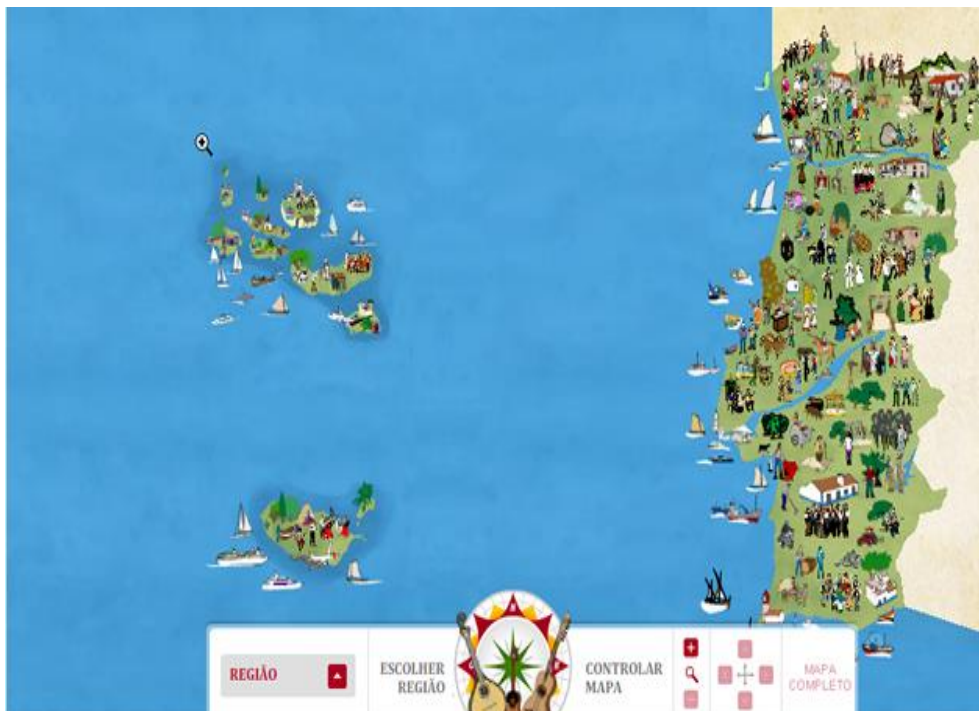
Figura 3 - Portugal na sua diversidade artística e musical