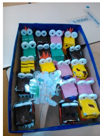
Figura 7 - Caixa de Fantoches.

O fantoche foi pensado de modo a que a criança tenha fácil manipulação do mesmo, assim como refere Sousa (2003b) “a criança sente-se particularmente ligada ao fantoche porque ele é seu, porque é um instrumento que a prolonga e porque foi construída por si” (p. 94). Esta participação do grupo em todo o processo de realização de fantoches e na implementação da área permitiu um maior sentido de responsabilidade e valorização pelo mesmo. De acordo com o mesmo autor, a expressão através de fantoches permite à criança uma maior liberdade para imaginar, e aprender a dominar e expressar as suas emoções e sentimentos, aspeto essencial a desenvolver com este grupo de crianças.