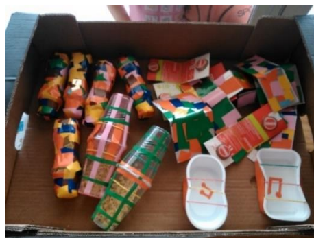
Figura 11 - Caixa dos Instrumentos.

Para além desta construção em sala de aula, é de referir que uma das crianças construiu um instrumento em casa, utilizando elásticos e uma superfície de plástico. A fim de partilhar com o grupo, a mesma comunicou qual foi o processo de construção desse instrumento e este foi colocado na área de música, para que fosse possível a sua utilização pelo grupo.