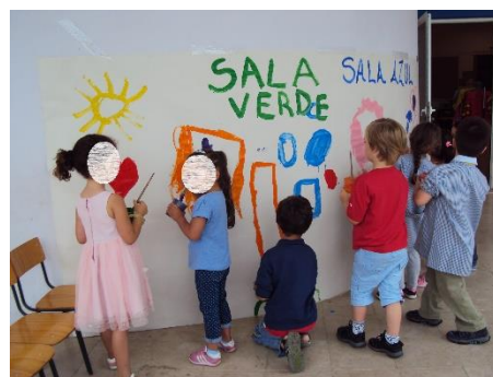
Figura 5- Painel de expressão livre em conjunto com outra Sala.