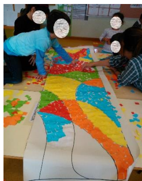
Figura 4- Painel com técnica de mosaico em parceria com todo o JI.

O interesse e o entusiasmo demonstrados pelas crianças na realização desta primeira atividade foi de tal maneira notório e marcante, que optámos por promover atividades semelhantes que recorressem à elaboração de painéis em grande grupo, abordando diferentes técnicas da área da plástica, como técnica de café, tingimento, colagem, mosaico e desenho livre (ver Figuras 4 e 5).