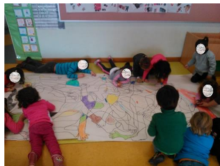
Figura 2- Pintura em grande grupo.

Também nesta atividade foi possível observar evoluções do grupo a nível de motricidade fina, nomeadamente o grupo dos 3 anos que apresentava um maior controlo da mesma e compreendia os limites do desenho.