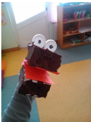
Figura 6 - Fantoche de Lobo.

outros animais e da figura humana. O grupo escolheu quais os animais a realizar através de rolos de papel de lustro de diversas cores, escolhendo as cores Amarelo, Rosa e Verde (ver Figura 7). De seguida, foram registadas as cores no quadro e as crianças foram novamente inquiridas acerca dos animais que poderiam ser representados por essas cores. Cada criança escolheu um animal através da cor. Em simultâneo, o grupo dos 5 e 6 anos realizou desenho livre da figura humana que permitiu a realização de outros fantoches.