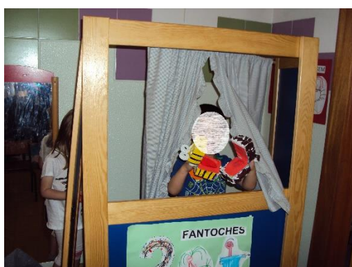
Figura 8- Exploração da área da dramatização/ fantoches.

No que diz respeito à área de expressão dramática, esta compreende-se por permitir à criança a descoberta de si e do outro, capacidade esta que ainda não estava tão mobilizada aquando a implementação da área. Ao explorarem essa área, as crianças interagem umas com as outras e tomam consciência das suas reações, das realidades ao criarem situações do quotidiano. Estas interações podem ter um carácter verbal e não-verbal (ME/DEB, 1997). Analisando como decorreu esta atividade e as formas de atuação das crianças, observamos que o grupo evoluiu significativamente, no que diz respeito ao trabalho das expressões, nomeadamente dramática, como também nas relações interpessoais e na exposição do “eu”, relativamente aos seus sentimentos e emoções.