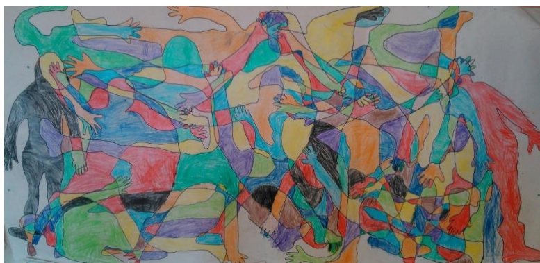
Figura 3- Trabalho final do Painel.

Esta atividade também permitiu desenvolver a criatividade e a imaginação, através da pintura de cada silhueta e, após a sua conclusão, observar e redescobrir características físicas visíveis nos contornos de cada corpo. Segundo Stern (1998) “Quando a criança pinta, o mundo encolhe-se às dimensões de uma folha de papel, a folha transborda os seus limites e torna-se o mundo” (p. 59), ou seja, a criatividade da criança está autoimposta. Para que este processo não estimule a criatividade numa primeira fase, mas após a sua conclusão, as crianças podem verificar e redescobrir os seus corpos através de características físicas visíveis nos contornos dos corpos.