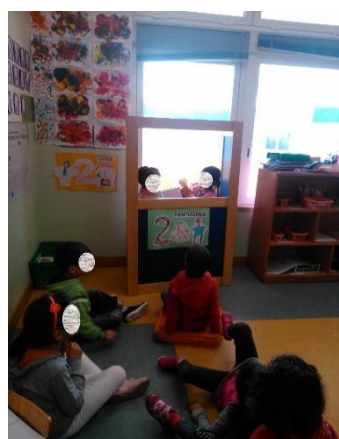
Figura 9- Exploração da área/ dramatização para o grupo.

De acordo com educadora cooperante, a implementação da área da dramatização beneficiou o grupo,