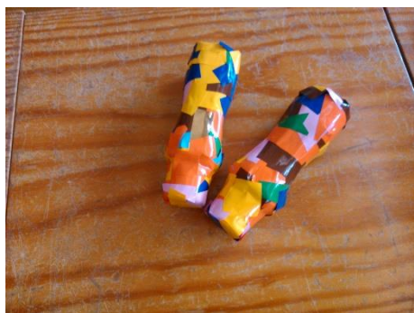
Figura 10 - Maracas com arroz.

instrumentos em momentos de atividade livre, como é o caso do reco-reco e da caixa de sons e, também, do tambor.