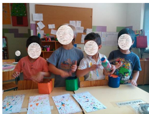
Figura 12- Exploração dos Instrumentos.

Transversalmente à área de música está o trabalho de ensinar as letras das canções que relaciona o domínio da expressão e o subdomínio da música com o domínio da linguagem, de modo que permite à criança conhecer e compreender o que diz, e também explorar de forma lúdica este último domínio referido.