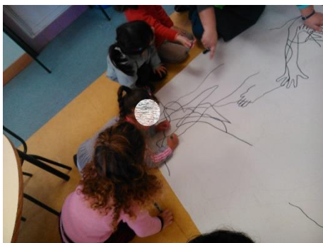
Figura 1- Pintura em pequeno grupo.