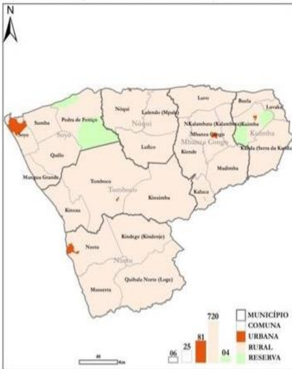
Figura 1 Catograma- Municípios e Comunas da província do Zaire