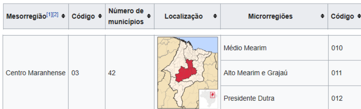
Figura 02 - Mesorregiões do Maranhão – Centro Maranhense

Conforme o IBGE (2017) houve a extinção das mesorregiões e microrregiões, conforme mostra na figura 2. Deste modo, se criou um novo modelo de representação regional, assim, possuindo novas divisões geográficas, denominadas de imediatas e intermediárias, conforme mostra figura 3.