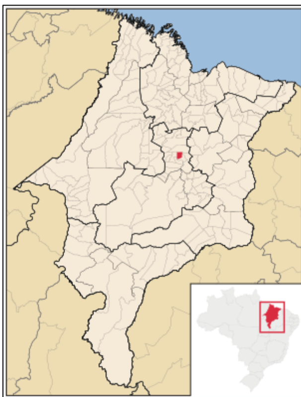
Figura 05. Mapa de Localização do Município de Trizidela do Vale - Brasil

Trizidela do Vale, cidade vizinha com a cidade de Pedreiras, que se situa a 3 km a Nordeste-Oeste, ambas no Estado do Maranhão, conhecidos como trizidelenses. Com 223 km 2 de extensão geográfica, o município conta com 18.951 habitantes, informado pelo censo de 2017. Com 85 habitantes por km 2 em sua densidade demográfica, mostra-se pouco povoado em seu território. Também tem como vizinhos próximos os municípios de Lima Campo e Bernardo do Mearim. O município situado a 64 metros de altitude com coordenada geográfica de Latitude: 4° 34' 0" Sul, Longitude: 44° 37' 37" Oeste.