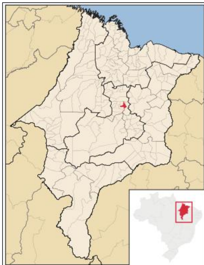
Figura 04. Mapa de Localização do Município de Pedreiras - Brasil

habitantes. Possuindo 136,8 habitantes por km 2 em sua densidade demográfica. Na sua proximidade, consta como municípios vizinhos: Trizidela do Vale, Lima Campos, Bernardo Mearim, situando estes a 44 km entre sul e leste do município de Bacabal, considerada a maior cidade mais próxima. Com altitude a 37 metros, o município de Pedreiras consta com coordenadas geográficas de Latitude: 4° 34' 28" Sul, Longitude: 44° 35' 55" Oeste.