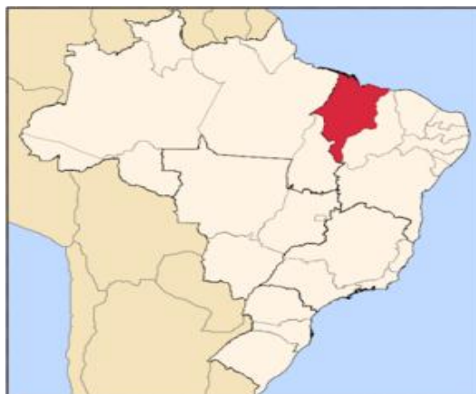
Figura 01 – Mapa de Localização o Estado do Maranhão - Brasil

O Estado também, possui importantes rios que travessam sua região, sendo os mais destacados os rios de Itapecuru, Mearim e Pindaré.