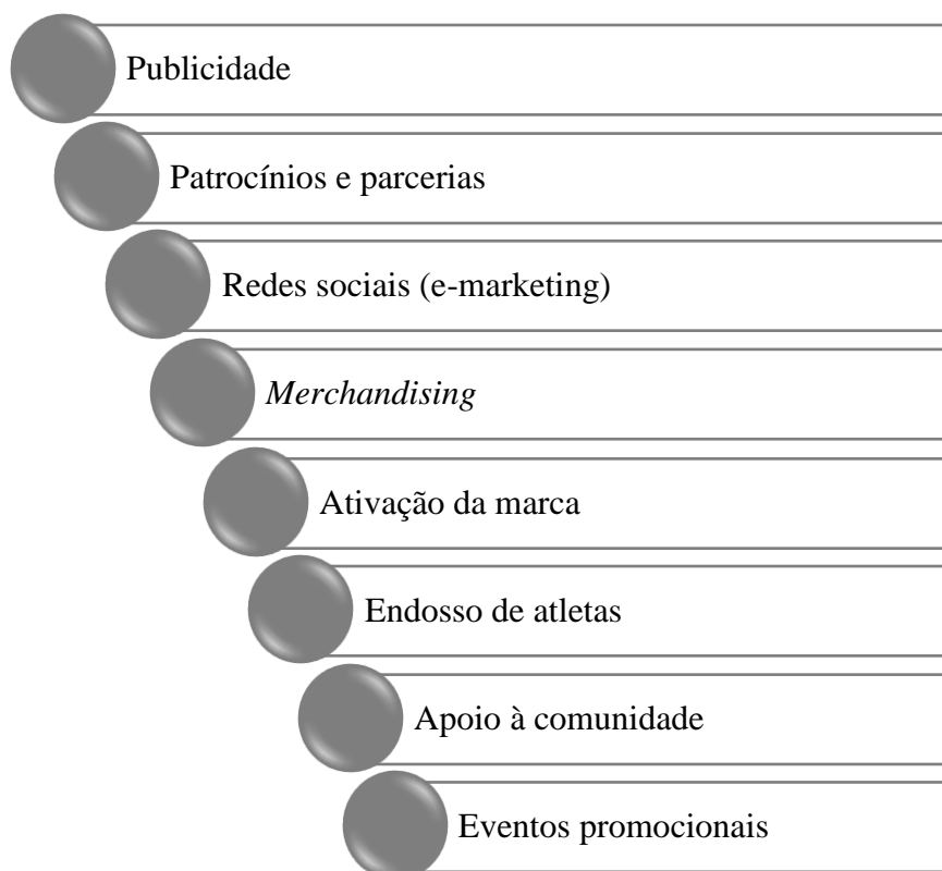
Figura 1 Abordagens do marketing desportivo

O marketing desportivo é uma área específica do marketing que se concentra em promover produtos e serviços relacionados com o desporto (Fullerton, 2021; Mehta, 2020). Neste âmbito envolve a promoção de equipas, eventos, atletas e marcas associadas ao mundo do desporto através de várias abordagens, entre as quais se destacam as mencionadas na Figura 1.