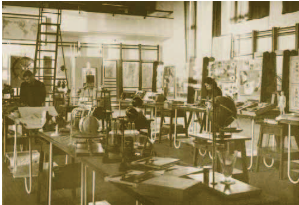
Exposição na Escola Técnica Elementar Francisco Arruda.

A dinamização de processos de trabalho assentes em métodos activos, com destaque para a criação de centros de interesse, de bibliotecas, da imprensa escolar, das visitas de estudo, do intercâmbio escolar, das festas e