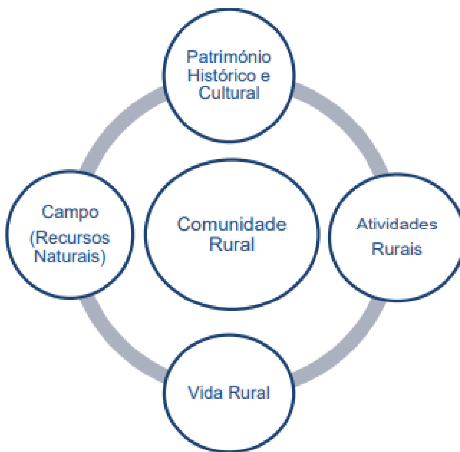
Figura 1 - Elementos do Turismo Rural

A Organização Mundial do Turismo (2004) também refere critérios e características específicas para o turismo rural, que abrange um conjunto de cinco elementos essenciais, no qual se inclui a comunidade rural (fator principal), a dependência de todo o espaço onde se desenvolve (recursos naturais), o seu património histórico e cultural, as atividades rurais e o modo de vida rural (gastronomia, artesanato, eventos locais, etc), como podemos verificar na figura seguinte.