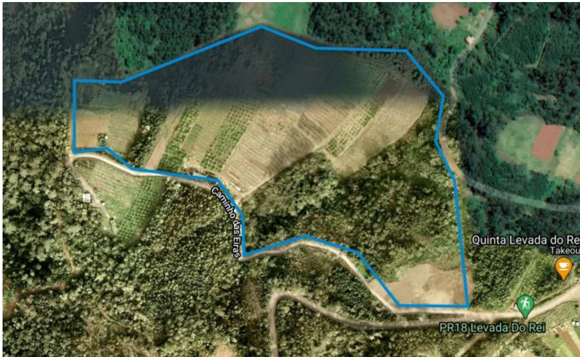
Figura 6 - Vista aérea do Terreno