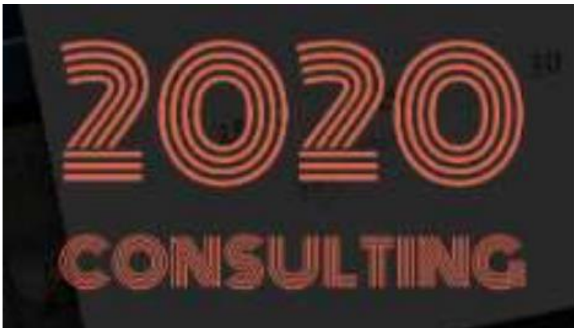
Figura 4 - Logotipo 2020 Consulting