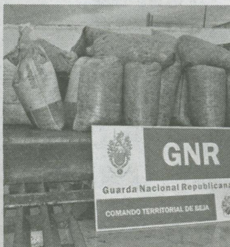
Carrinha e fruto apreendidos

“Após uma denúncia do proprietário do olival, uma abordagem célere aos prevaricadores levou à sua detenção e à apreensão de, aproximadamente, 280 quilos de azeitona e da viatura