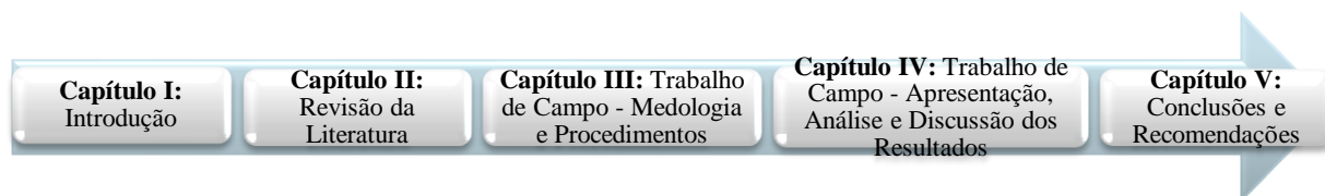
Figura n.º1 – Estrutura do trabalho

Quanto à estrutura, o trabalho é composto por uma componente teórica e uma prática, encontra-se dividido essencialmente em cinco capítulos. O presente capítulo é dedicado ao Enquadramento do Trabalho de Investigação. O segundo capítulo é dedicado à Revisão de Literatura. No terceiro capítulo sistematiza-se a metodologia seguida no trabalho de campo. O quarto capítulo apresenta os resultados da pesquisa empírica. Finalmente, no quinto e último capítulo procede-se às conclusões e reflexões finais do trabalho. A estrutura encontra-se definida de acordo com as normas de redação de trabalhos da NEP 520/DE da Academia Militar, por Sarmento (2008) e pelas Normas da American Psychological Association (APA).