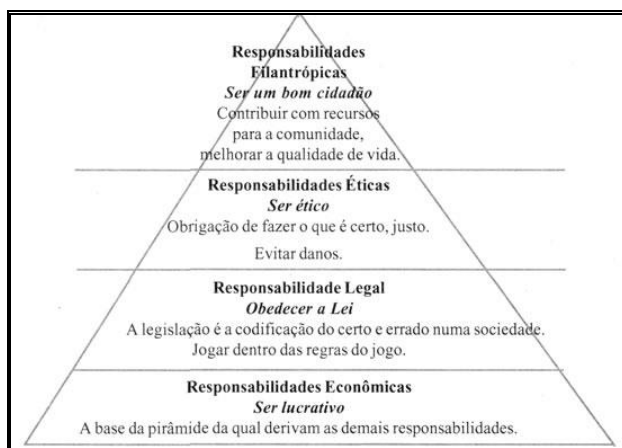
Figura 1 – A Pirâmide da Responsabilidade Social Empresarial