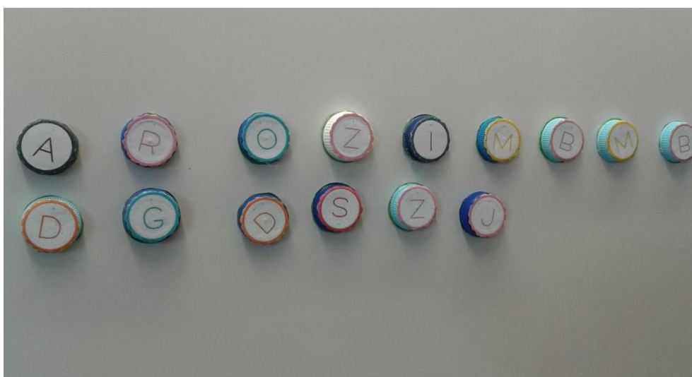
Fig. 9 - Peças com as letras. À medida que iam saindo iam sendo colocadas no quadro

Analisando a concretização da atividade, o comportamento e as reações das crianças, podemos indicar que maioria dos alunos entendeu o conceito do jogo, assim como se verificaram evoluções significativas no que toca à literacia, sobretudo na escrita e na leitura.