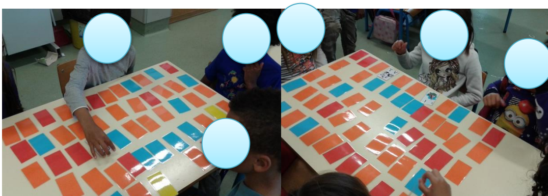
Fig. 4 - Alunos a jogar

No início da atividade pretendíamos que os alunos estimulassem primeiramente a sua memória visual, bem como ganhassem uma maior noção do significado/sentido de regras. Repetiu-se a atividade quatro vezes, para que fosse possível alcançar o objetivo principal do jogo, que era o reconhecimento das letras maiúsculas e minúsculas do abecedário.