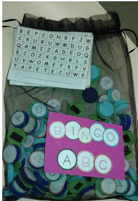
Fig. 7 - Jogo do Bingo ABC concluído

Foi dado conhecimento à turma das regras de funcionamento do jogo, bem como o objetivo principal para que a dinâmica do jogo decorresse da melhor maneira.