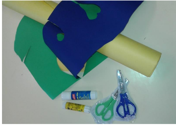
Fig. 2- Material utilizado para o Jogo da Memória

Nesta fase da elaboração da atividade, detetámos algumas incapacidades por parte dos alunos, sobretudo no que toca ao recorte, pois a maioria não sabia pegar corretamente na tesoura, o que de certa forma dificultou a realização desta tarefa. A estagiária teve de intervir várias vezes para que todos os alunos adquirissem essa capacidade e para que não se magoassem. Há que ter em conta que esta capacidade já deveria ter sido adquirida ao longo dos anos letivos anteriores.