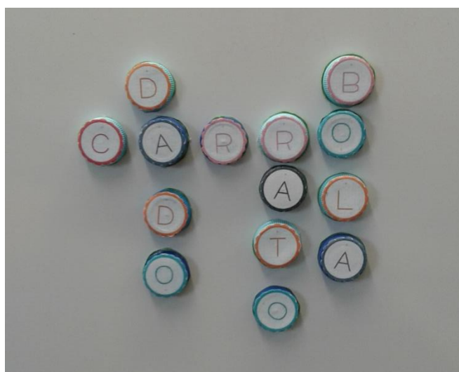
Fig.10 - Jogo Palavras Cruzadas partindo da palavra “carro”

Incentivou também à realização de ditados. A professora estagiária retirava do saco uma peça e com a letra que saía os alunos tinham três minutos para escreverem várias palavras iniciadas com a respetiva letra. Após escreverem as palavras pensadas por si, tinham mais três minutos para escreverem frases com as mesmas palavras. Ganhava quem conseguisse escrever corretamente o maior número de palavras e frases.