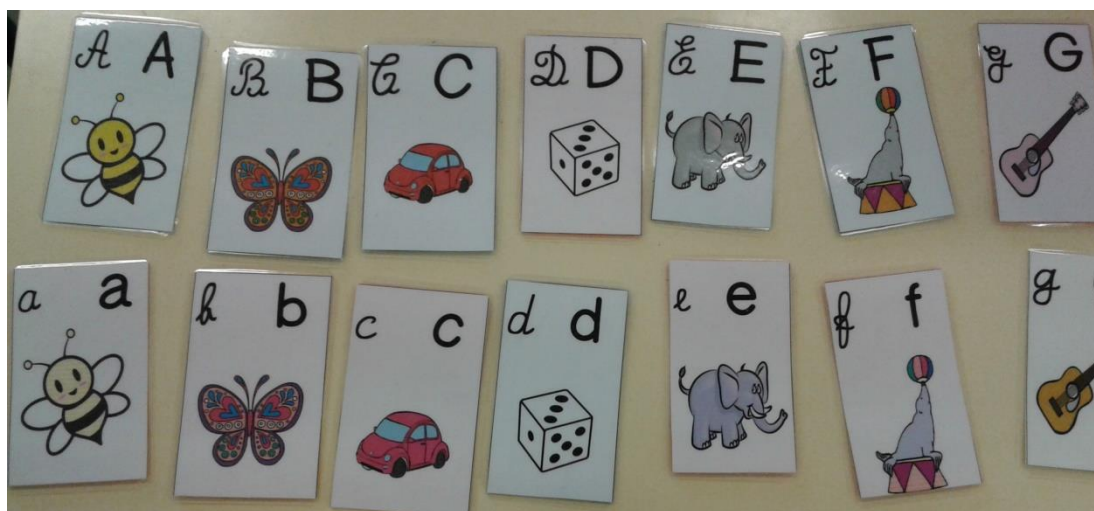
Fig. 5 - Organização dos cartões por ordem alfabética

Para esta tarefa, de organizar os cartões por ordem alfabética e de modo a relacionar a área de expressão musical, a estagiária cooperante optou por ensinar uma música do Abecedário. Ao aprenderem a música, os alunos tiveram mais facilidade na memorização do abecedário, uma vez que a letra da mesma era simplesmente o abecedário pela sua ordem real.