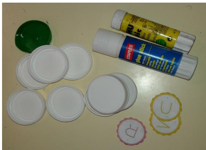
Fig. 6 - Material utilizado para a construção do jogo Bingo ABC

Esta etapa da atividade decorreu com normalidade, tendo os alunos executado a mesma com sucesso e sem dificuldade. Elaborado este trabalho, a etapa de construção do jogo ficou concluída.