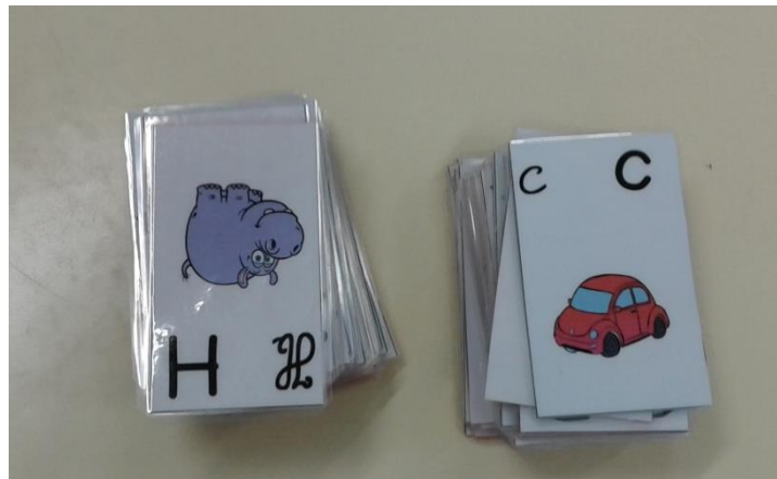
Fig.3 - Cartões plastificados e finalizados

No final, os respetivos cartões foram plastificados pela estagiária.