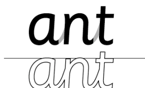
Figura 14 - Com Sassoon , os terminais constroem o espaçamento entre letras adequado e facilitam o treino da mão durante leitura.

Os arcos presentes em todas as letras Sassoon refletem o movimento da escrita manuscrita, mostrando facilmente a relação entre todas as letras. Os terminais na linha de base, como foi referido anteriormente, encorajam a um agrupamento espontâneo das letras em palavras e também constroem um espaço adequado entre elas.