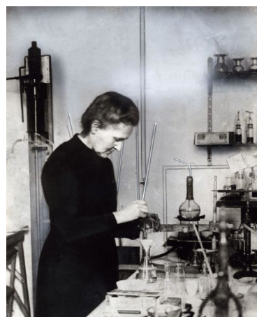
FIGURA 1. Marie Curie no seu laboratório de química no Instituto de Rádio em França, 1921.

Nascida a 7 de novembro de 1867 em Varsóvia, na Polónia, Marie Curie tornou-se numa das mulheres mais importantes no mundo na investigação científica nas áreas da química e da física (FIGURA 1). Em 1891, foi para Paris para continuar os seus estudos na Universidade de Sorbonne e licenciou-se em Física e em Matemática 7 . Em 1895, casou-se com Pierre Curie, Professor na Escola de Física. Após a morte do seu marido, em 1906, Marie Curie ficou no seu lugar como Professora de Física Geral na Faculdade de Ciências, a primeira vez que uma mulher ocupou esta posição – o que para a época era inovador, tendo em conta que as mulheres não tinham acesso a uma carreira profissional e a investigação científica era essencialmente do domínio masculino 8 . Acaba por falecer com 66 anos em Savoy, França, a 4 de julho de 1934, de leucemia, pela longa exposição às radiações. As suas cinzas encontram-se no Panteão de Paris, sendo a primeira mulher a receber essa honra pelos seus feitos.