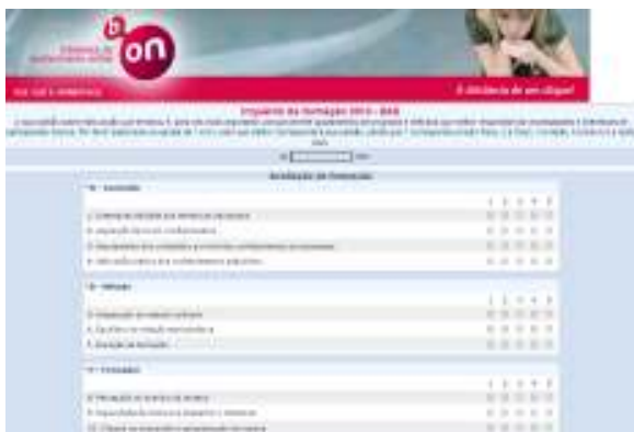
Figura 1: Interface do inquérito de avaliação

A escala de avaliação é de 1 a 5, sendo que 1 corresponde a muito fraco, 2 a fraco, 3 a médio, 4 a bom e 5 a muito bom. A b-on tem como valor referência para nota mínima 3.5.