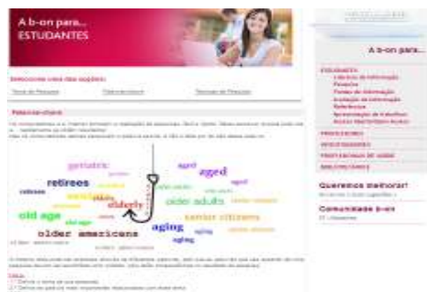
Figura 2: b-on para...

Para além destes materiais decorrentes das sessões de formação, a b-on disponibiliza do seu website uma área denominada “b-on para...” com informação focada e segmentada por tipo de utilizador: estudantes, professores, investigadores, profissionais de saúde e bibliotecários e que visa promover a literacia da informação.