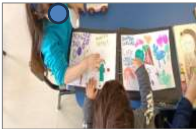
Figura 17. Junção das cartolinas.