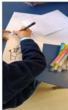
Figura 32. Escrita do livro.