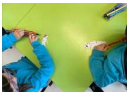
Figura 3. Pintura livre com lápis e canetas.