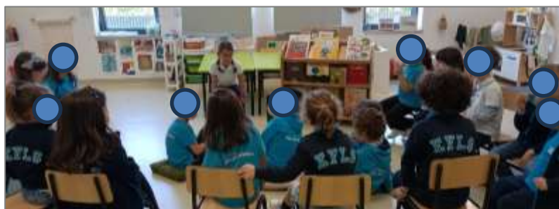
Figura 30. Sentados na biblioteca para início da leitura das histórias.