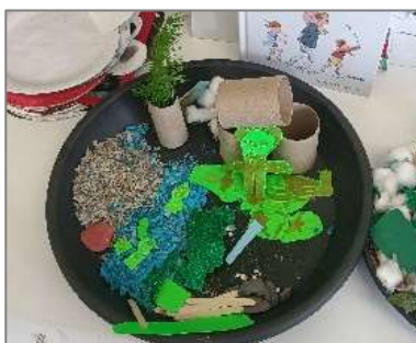
Figura 8. Reconto sensorial dos 3 anos, dos 4, 5 e 6.