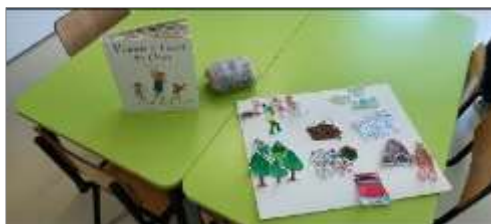
Figura 5. Resultado final da tela caça ao urso como reconto da história. em grupo realizamos uma conversa relembrando as aventuras por onde a família passou.