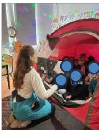
Figura 11. Apresentação do livro “iluminar a noite”.