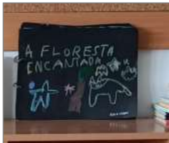
Figura 18. Resultado final livro “floresta encantada”.