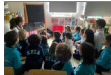
Figura 19. Leitura do livro “floresta encantada”, criado pela sala verde.