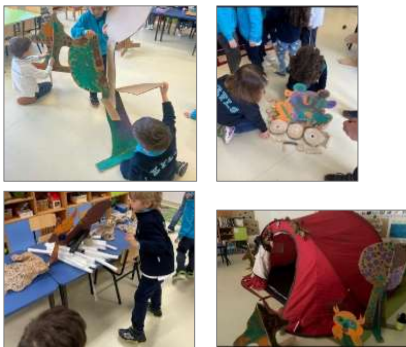
Figura 23. Montagem e criação livre.