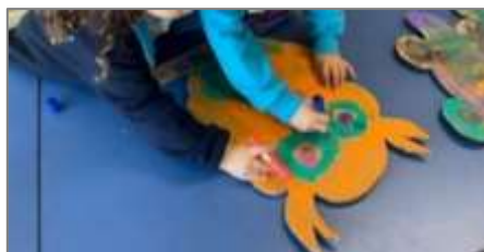
Figura 21. Pintura dos animais e elementos da noite.