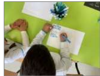
Figura 16. Escrita e recordar os animais noturnos que vimos.