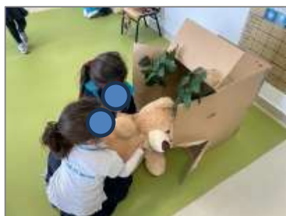
Figura 9. Exploração livre da caixa (gruta e do urso).