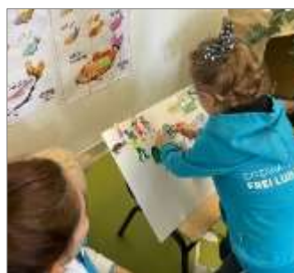
Figura 4. Reconto da história com colagens dos elementos na tela.