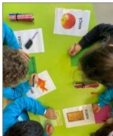
Figura 26. Jogo “terra da maluquice”