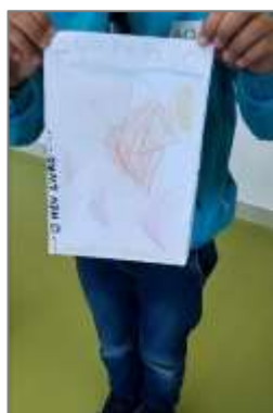
Figura 31. Construção do livro.