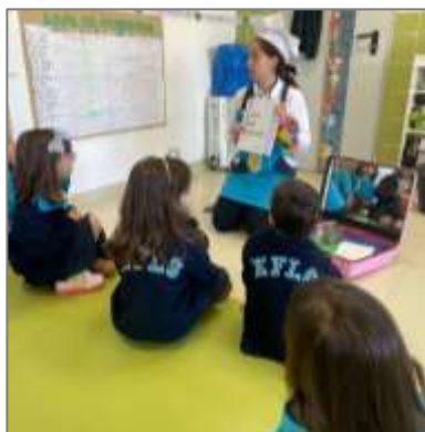
Figura 24. Leitura livro sem bonecos