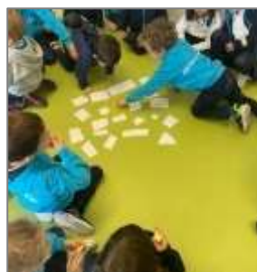
Figura 2. Escolha aleatória dos elementos da história.