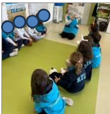
Figura 27. Leitura iluminar a noite.