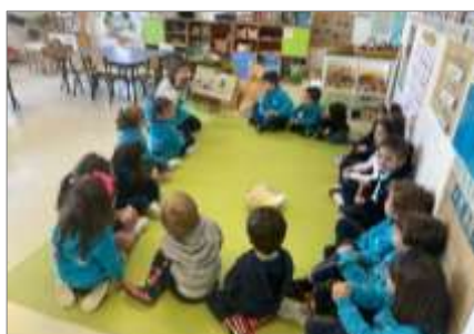
Figura 1. Leitura da história caça ao urso.