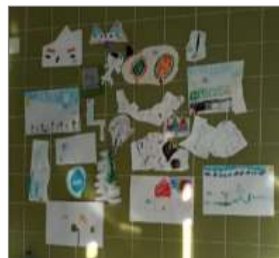
Figura 29. As criações.