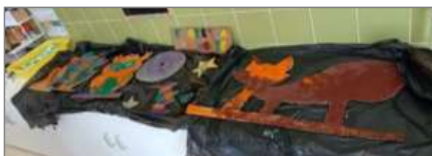
Figura 22. Resultado da pintura final.