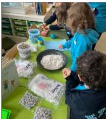
Figura 6. Início da exploração sensorial.