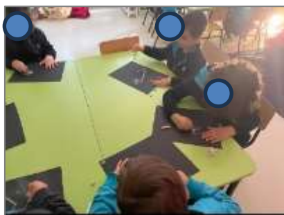
Figura 12. Atividade de pintura com giz para realização do reconto da História.