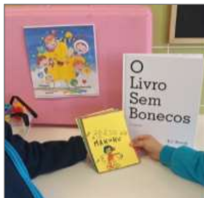
Figura 25. Dicionário “Dicinário Makuku”