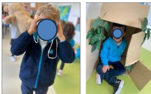
Figura 10. Utilização de materiais que envolveram a história.