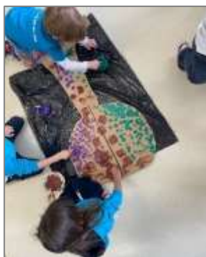
Figura 20. Pintura com a técnica do Pintor.