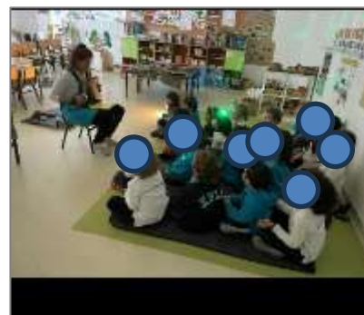
Figura 13. Ouvir e adivinhar quais os animais noturnos.