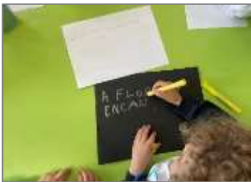
Figura 14. Construção da capa.