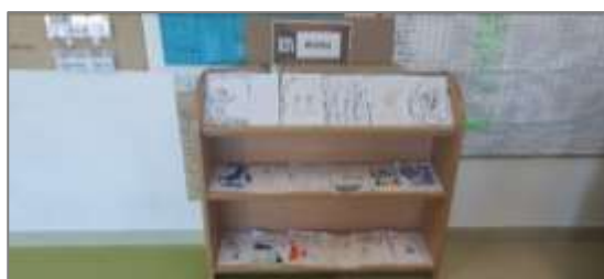
Figura 33. Biblioteca com os livros criados pelas crianças.