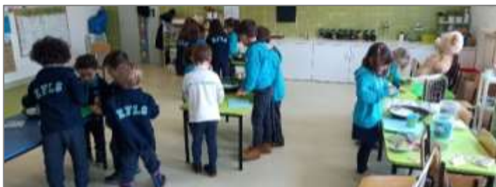
Figura 7. Trabalho em grupo para o reconto sensorial da história.