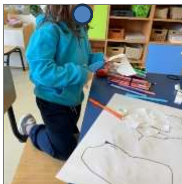
Figura 28. A construção.