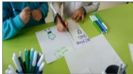
Figura 15. Ilustração, escrita do nome de personagens.