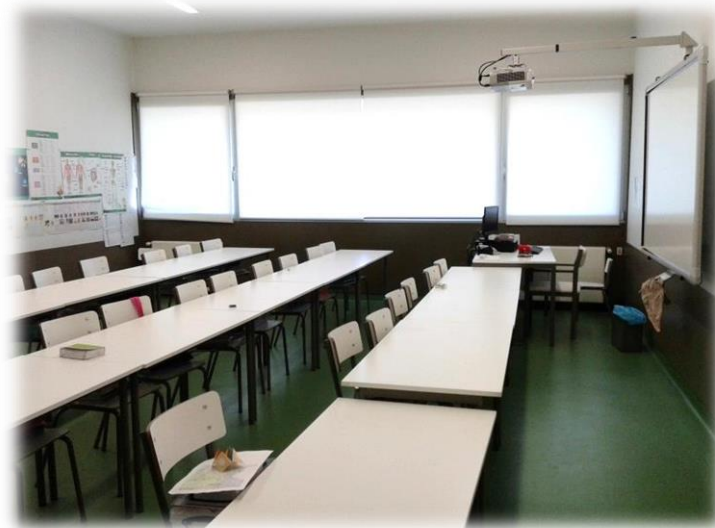
Figura 1- Sala de aula do 2.º F