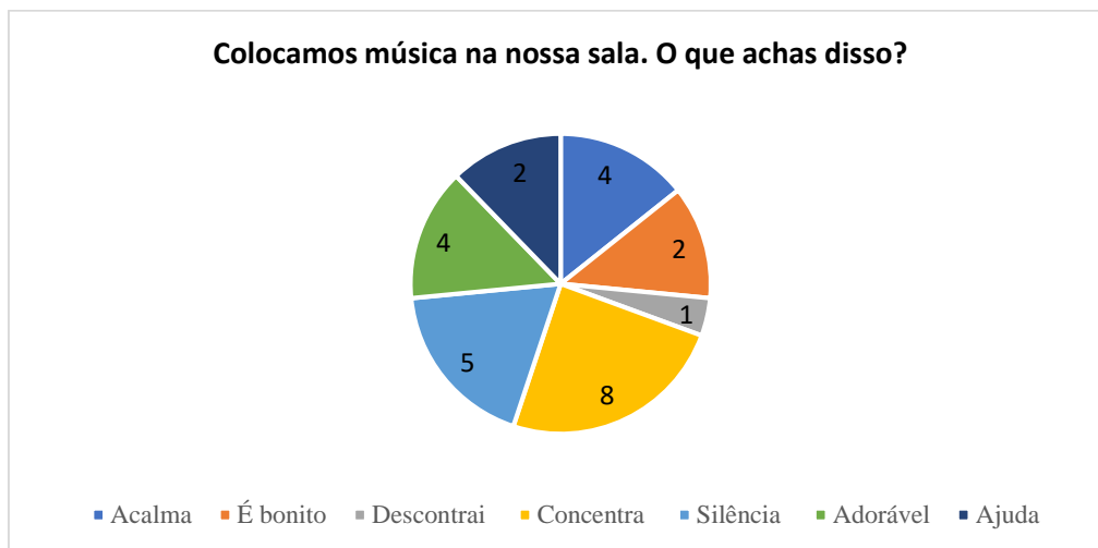
Gráfico 1- Colocamos música na nossa sala. O que achas disso?

No Gráfico 1, observa-se que para a maioria dos alunos a música é bonita (8 alunos), seguido dos alunos que consideram que a música ajuda a silenciar (5 alunos), sendo adorável (4 alunos) e acalma (4 alunos). Isto significa que os alunos encaram a música de forma positiva, podendo ser utilizada ao longo da realização de tarefas, revelando que os mesmos se sentem confortáveis com a presença do som e dispostos a trabalhar mais concentrados e em silêncio, ou seja, a música transmite satisfação pessoal e motivação nas aprendizagens, existindo deste modo espaço para a música em contexto de sala de aula, uma vez que há interdisciplinaridade entre a música e as restantes áreas do saber.