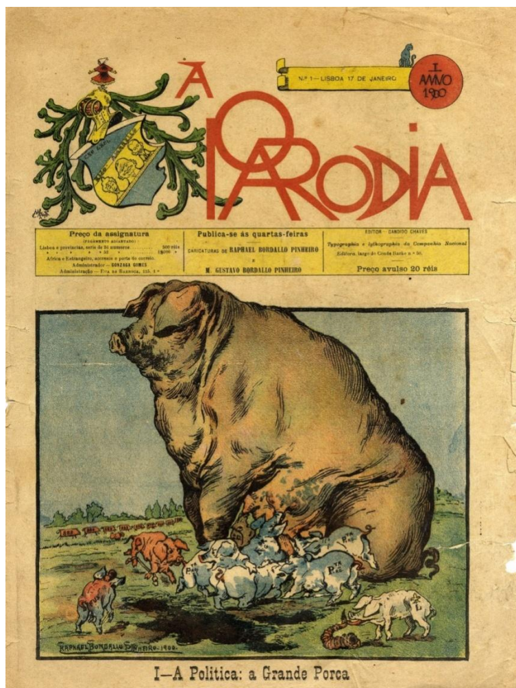
FIGURA 4: "I - A POLÍTICA: A GRANDE PORCA"