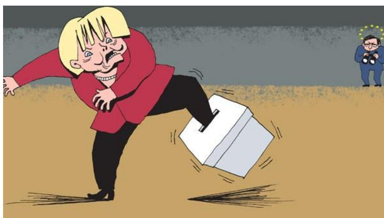
FIGURA 2: TOON

Dos muitos temas de sátira, o mais proeminente é o da política. Com efeito, a sátira não é, somente, a forma mais comum de literatura política mas, na medida em que tenta influenciar o comportamento público, é a parte mais política de toda a literatura (Hodgart, 2009). Nesse sentido, a sátira utiliza a inteligência da crítica com um fim moralista, atacando os vícios do mundo e dos políticos, os pontos fracos do indivíduo, no sentido de o alertar para a sua má conduta, dando-lhe a hipótese de se redimir. A sátira critica com o peso de uma ética que o satirizador defende, uma moral consolidada na sociedade em que o crítico se insere. Não querendo provocar a indignação, antes a tolerância, vai direita ao assunto, apontando todos os elementos críticos numa tentativa de consciencialização pelo riso (O. M. de Sousa, 2007e). Por outro lado, a sátira, sobretudo a que se aplica ao domínio do político, maneja um riso de desqualificação ou de rebaixamento, pretendendo-se provar que o adversário político não possui as qualidades bastantes para o exercício das responsabilidades públicas que aceitou exercer (Homem, 2011).