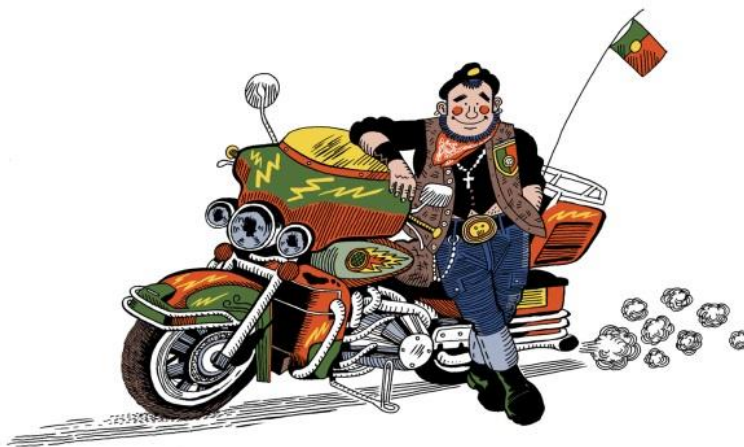
FIGURA 6: ZÉ POVINHO MOTARD