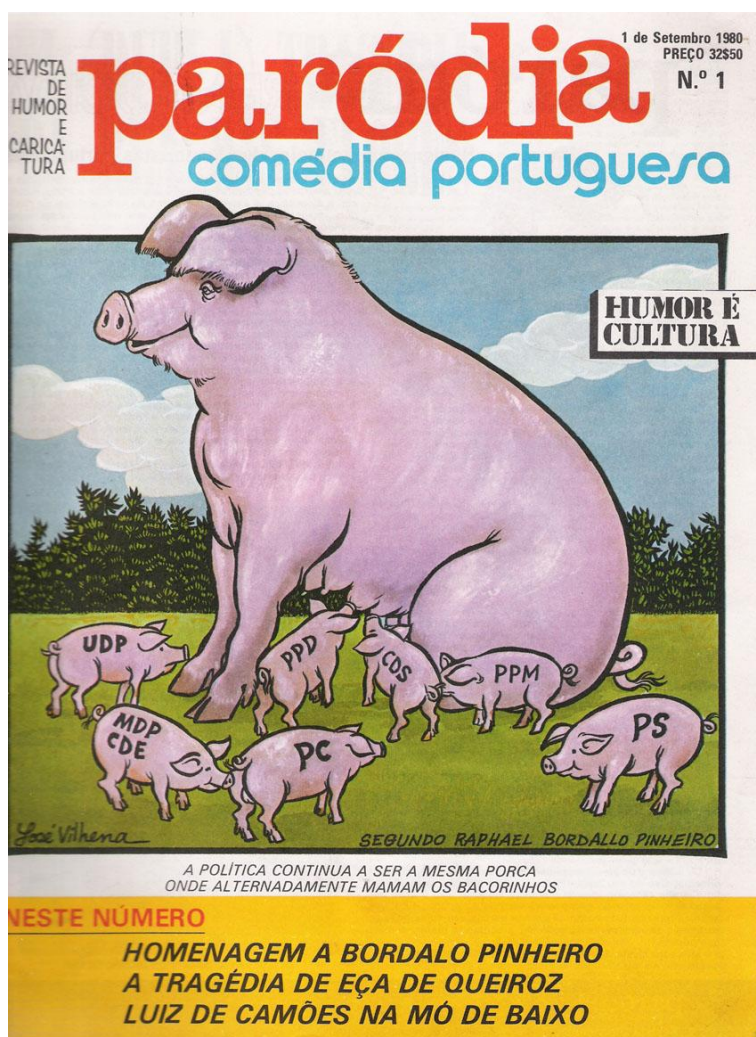
FIGURA 5: A POLÍTICA CONTINUA A SER A MESMA PORCA ONDE ALTERNADAMENTE MAMAM OS BACORINHOS

Outro caricaturista que iniciou a sua carreira nesta época foi José Vilhena (1927), colaborando no Primeiro de janeiro , Os Ridículos , Diário de Lisboa e O Mundo Ri , este em 1955 17 (O. M. de Sousa, 1999b; 2002a; Zink, 2001).