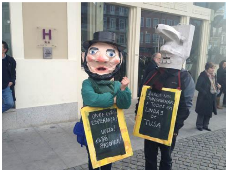
FIGURA 7: "ZÉ POVINHO" PREPARA-SE PARA SE MANIFESTAR NO PORTO