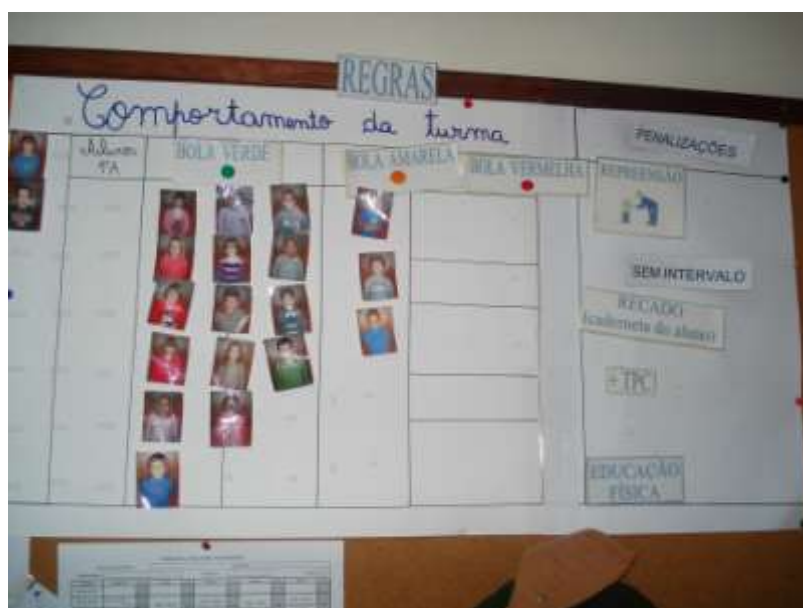
Figura 12. Tabela do comportamento.