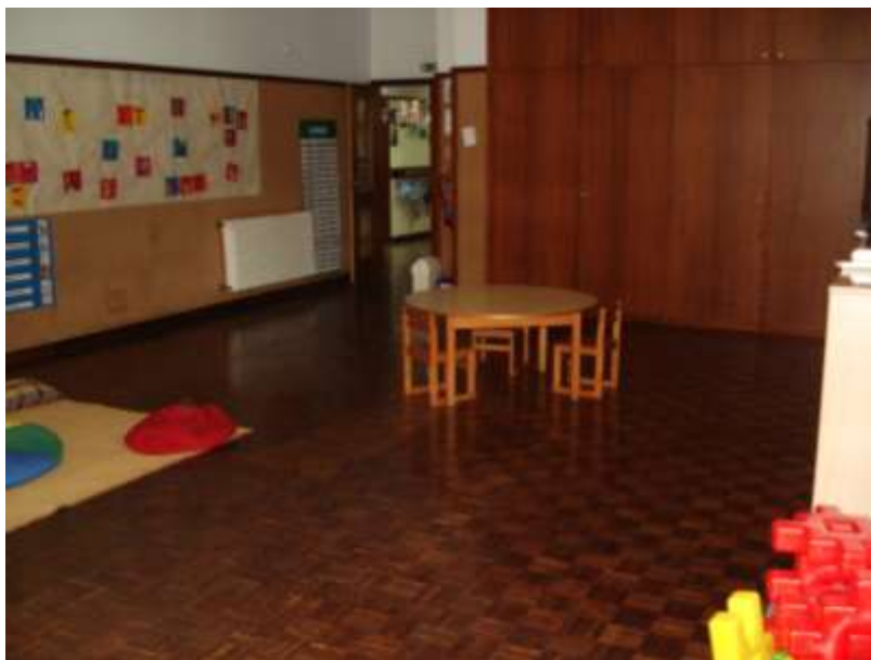
Figura 3. Salão