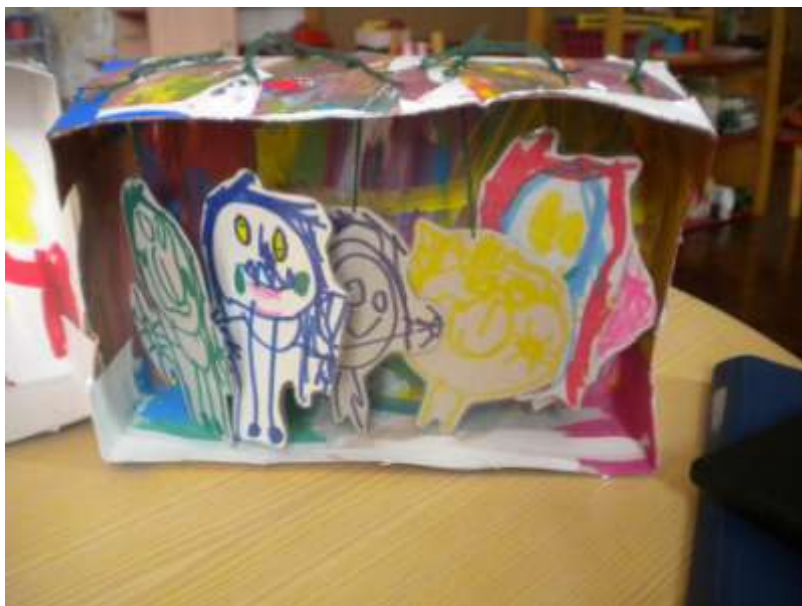
Figura 6. Resultado da experiência de aprendizagem sobre a família.