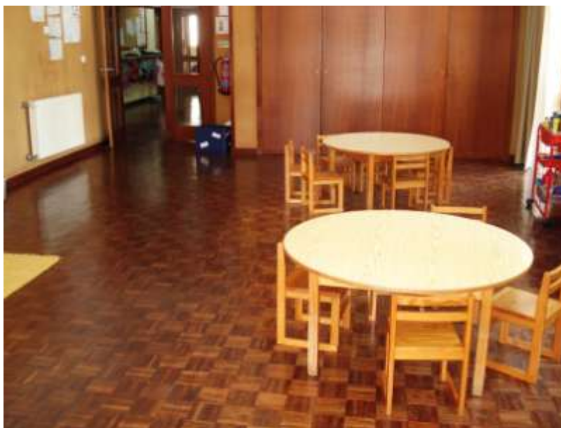
Figura 2. Sala das Cores