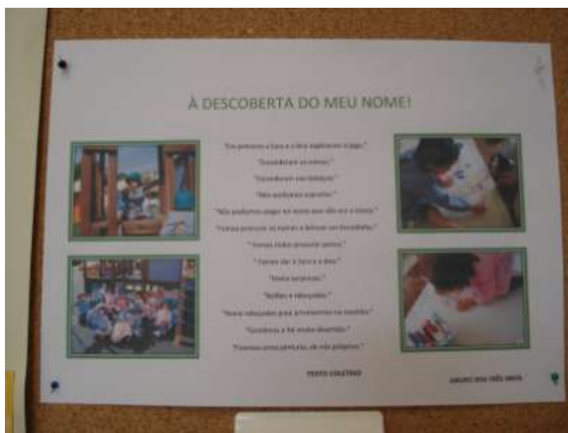
Figura 4. Reconto da experiência de aprendizagem “À descoberta do meu nome”, pelas crianças.