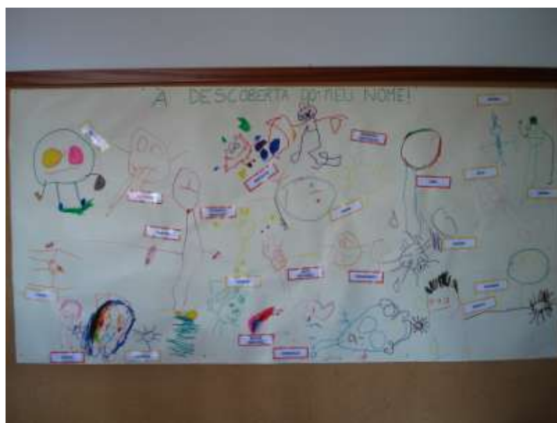
Figura 5. Painel resultante da experiência de aprendizagem “À descoberta do meu nome”.