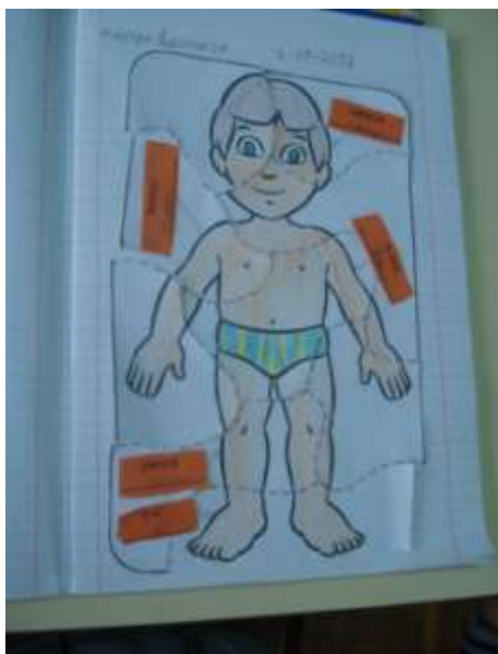
Figura 10. Trabalho sobre o corpo humano.