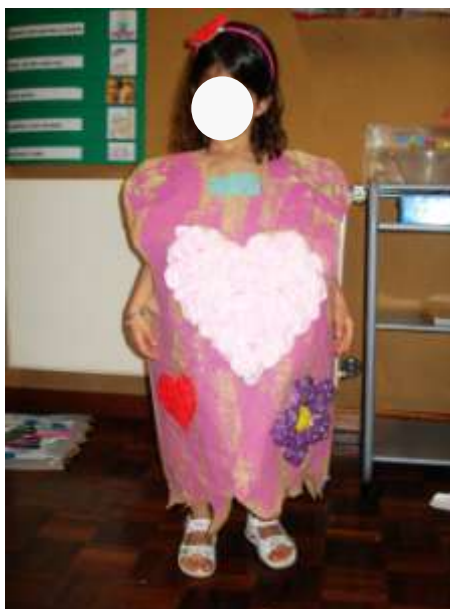
Figura 8. Resultado do mini-projeto sobre os meses do ano – exemplo de fato de rapariga.