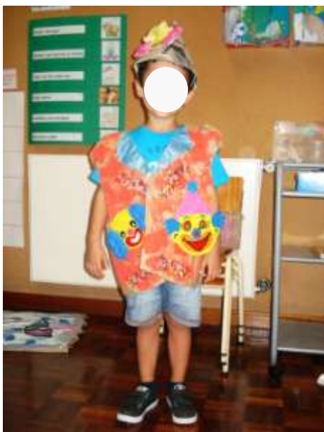
Figura 7. Resultado do mini-projeto sobre os meses do ano – exemplo de fato de rapaz.