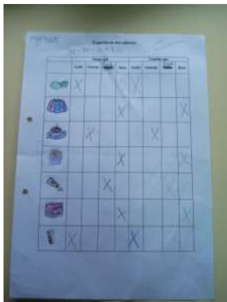
Figura 11. Registo de uma atividade experimental.