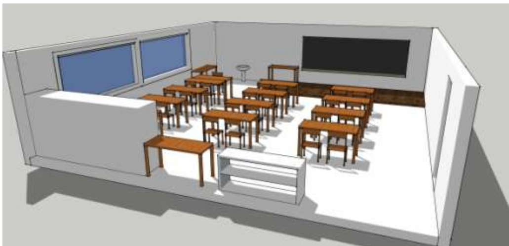
Figura 9. Planta da sala.