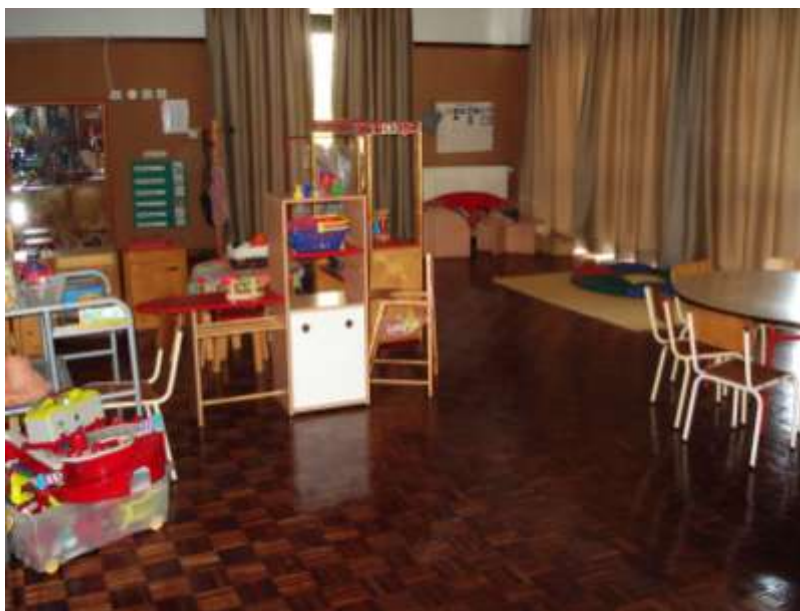
Figura 1. Sala dos Cantinhos