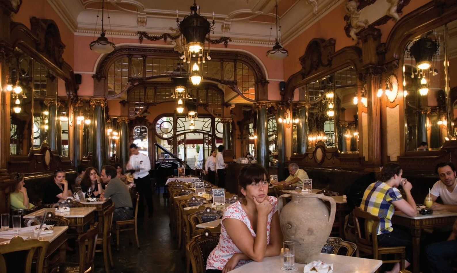
fig. 2 Uma das fotos presentes na exposição “A Arte dos Ofícios”.