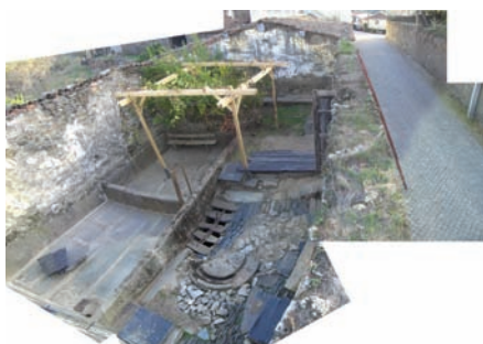
fig. 4 Aspecto final da intervenção realizada em edifício da Muxagata no âmbito do Workshop.