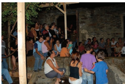
fig. 5 Audiência durante a apresentação pública do filme realizado ao longo o workshop.

232, 248, 288, 300, 316, 367, 394). Não sendo referida a exploração do sumagre nas memórias da paróquia de Vila Nova de Foz Côa, sabe-se por outras fontes que esta prática era também levada a cabo na referida circunscrição (Coixão e Trabulo, 1995, 200, 201). Tal relevância é ainda hoje evidente quando se observa a toponímia de algumas povoações do concelho, abundando topónimos tais como Atafona, Sumagral ou Sumagreira (Coixão, 1998).