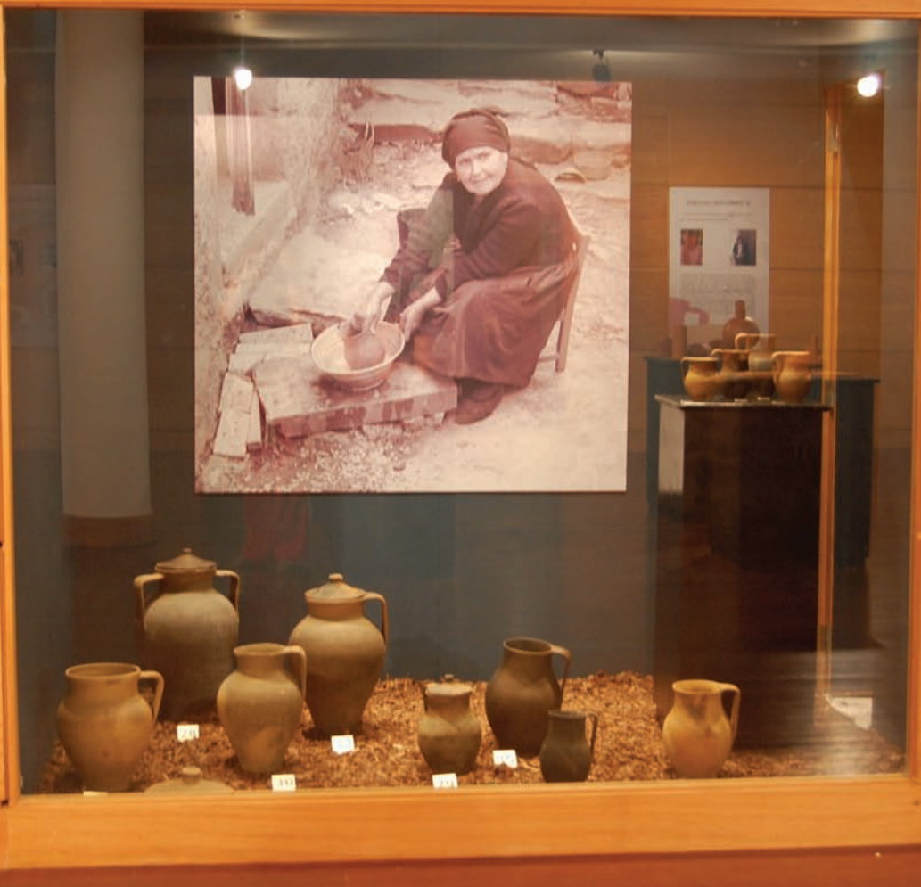
fig. 1 Aspecto da exposição “Louceiros de Santa Comba: Histórias que o barro escreve”.