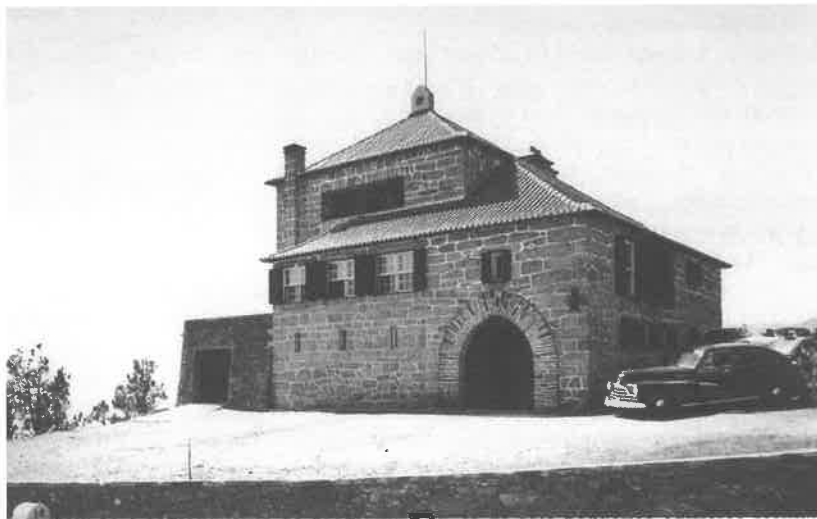
Fig. 6 Pousada de São Lourenço, Serra da Estrela. Imagem de arquivo http://restosdecoleccion.blogspot.pt/2012/01/Primeiras-pousadas-de-portugal.html , 21 de Maio de 2012, 18h00.

Quanto aos restantes edifícios verifica-se que os das Pousadas de Santo António de Serém e de S. Brás de Alportel são aqueles que mais se aproximam da ideia de um tipo em comum, próximo da escala doméstica. Já o edifício da Pousada de São Lourenço, pelo seu aspecto depurado, compacto e com um forte embasamento, quebra essa possível identidade e o da Pousada de Santiago do Cacém que, apresentando também um embasamento, é marcado por uma forte axialidade. O edifício da Pousada de São Martinho do Porto é o que mais se aproxima da ideia de um bloco de habitação sem relação com o terreno. Corrigir espaço entre linhas