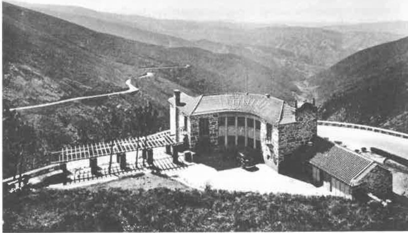
Fig. 5 Pousada de São Gonçalo, Serra do Marão. Imagem de arquivo http://restosdecoleccion.blogspot.pt/2012/01/primeiras-pousadas-de-portugal.html , de Maio de 2012, 18h00.

No Marão, tal como na da Serra da Estrela, a par de uma organização mais compacta do espaço há um aproveitamento hábil de toda a capacidade da construção, valor comum aos projectos de Rogério de Azevedo que “permite prescindir de uma monumentalização em pequena escala” 41 e, simultaneamente, reforça a abertura dos espaços interiores para a paisagem.