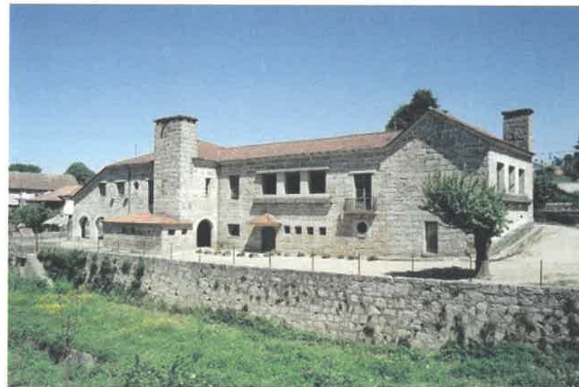
Fig. 4 Escola-Cantina Salazar. Vimieiro, Santa Comédia. Foto actual.

Entretanto algumas escolas são construídas em resposta a pedidos atendidos caso a caso. O projecto especial da Escola-Cantina Salazar (1938) é um dos que vê autorizada a sua realização. A escola encontra-se edificada numa zona peri-urbana, implantada a meia encosta, adaptando-se à morfologia do terreno que apresenta um declive acentuado. Construída em granito e apresentando uma planta rectangular, composta e irregular, e uma disposição horizontal das massas, é constituída por volumes e cobertura de telhados diferenciados, arcadas no pátio de recreio coberto e uma relativa ausência de elementos de decoração, oferecendo no entanto dois rostos. Enquanto o alçado principal reflecte, em continuidade, os projectos das escolas-tipo regionais, já o alçado posterior, com algum distanciamento e liberdade criativa em relação a essa imagem, e tirando partido do declive, do espaço de recreio e da disposição das salas de aula, apresenta uma composição quase orgânica, forte e profundamente expressiva na relação entre massas e aberturas.