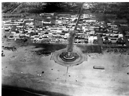
Fig. 5 - Imagem aérea de Monte Gordo tirada na década de 1930. [Em linha]. Disponível em http://www.skyscrapercity.com/showthread.php?t=452112 (Acesso: Outubro de 2012).

No seguimento desta nova orientação urbana, a estrutura social de Monte Gordo alterou igualmente a sua espacialidade. Os marítimos deslocaram-se para o Sertão, que se manteve desorganizado e sem infraestruturas urbanas, com as casas e cabanas no meio do areal e limitado pela Mata Nacional. Em 1949, o Consultório Artístico denuncia a existência em Monte Gordo de cerca de 60 “palheiros, cabanas, palhoças; casitas muito primitivas, cobertas de cana ou palha e assentes na areia”, nas quais “faltam os mais primitivos utensílios domésticos e mobiliário e em muitos casos os seus habitantes carecem de peças de roupa e vestimento”, em resumo, “um nível social e higiénico muito primitivo” (BRITO, 2009, p. 57). Paralelamente na zona nascente surgiram quarteirões alongados entre as ruas paralelas Pedro Álvares Cabral e Tristão Vaz Teixeira, divididos em parcelas maiores e mais regulares, com passeios e ruas largas, destinados aos veraneantes.