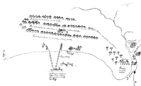
Fig. 3 - Desenho com representação de Monte Gordo em 1773 (CORREIA, 1997).

Esta abundância e prosperidade levaram à construção de algumas casas de pedra e cal e telhado de colmo ou junco. O desenho datado de 1773 (Fig. 3) indica que algumas cabanas tinham já cobertura de telha e perfilavam-se três alinhamentos, a Rua da Carrasqueira, Rua da Igreja e a “Frente da Porta do Mar”. Neste desenho está já patente a igreja, de orago de Nossa Senhora das Dores. Os marítimos organizaram-se em confraria e obtiveram autorização para realizar uma feira anual, estabelecida por provisão régia de 1760 (CORREIA, 1997, p. 88), a quem chamavam Feira da Praia.