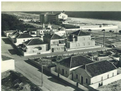
Fig. 6 - Monte Gordo nos anos 60. Já se vê o Hotel Vasco da Gama [Em linha]. Disponível em http://blog.turismodoalgarve.pt/2011_11_01_archive.html (Acesso: Outubro de 2012).

Ocorreram várias tentativas de alargamento da área construída. Em 1955 a Câmara Municipal elaborou um novo Antepiano da autoria do arquitecto Paulo Cunha 4 , justificando que constituia “ sem dúvida a de maior valia para esta Estância Balnear e presentemente o fulcro de todo o seu desenvolvimento ”. Foram previstos “blocos de casas geminadas” e a Zona Residencial de Moradias oferecia “ lotes devidamente calculados segundo as condições do meio e num aproveitamento parcial da Mata Nacional ” (BRITO, 2009, p. 64-65).