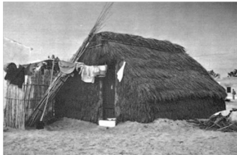
Fig. 4 - Casa de colmo situada na zona do Sertão em Monte Gordo fotografada cerca de 1960 (Coleção de postais da C.M.V.R.S.A. (Arquitetura Popular em Portugal, 1988, p. 189).

O veraneio balnear foi ainda impulsionado pela criação de novas acessibilidades: a abertura em 1892 do ramal que liga à estrada Tavira - Vila Real de Santo António (atual Rua Pedro Álvares Cabral), que se constituiu como a artéria principal da vila. E a inauguração, em 1902, da linha de caminho-de-ferro. No início, estas mudanças foram subtis porque os veraneantes alugavam as casas dos marítimos sem interferir no espaço construído. Posteriormente, passaram a edificar residências, primeiro na frente marítima e depois na rua principal. Intensificou-se a construção e ocupação do espaço, inaugurando em Monte Gordo uma nova época que alterou a sua fisionomia e função.