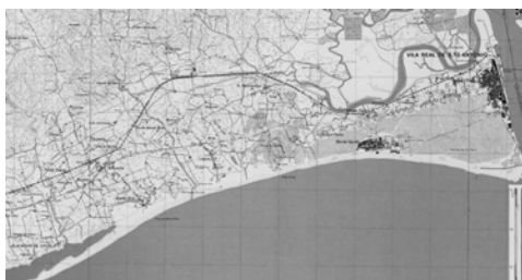
Fig. 1 - Localização de Monte Gordo no sotavento algarvio (Carta Militar de Portugal, nº 600, I.G.E., 1976).

As Atas da Câmara de Vila Real de Santo António, que neste trabalho foram apenas exploradas superficialmente, contêm informação relevante para o pleno entendimento dos processos de modificação que ocorreram em Monte Gordo. Serão seguramente objeto de um estudo mais aprofundado orientado para a procura de respostas às questões que este trabalho procura levantar.