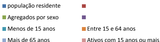
Figura 1: Estrutura populacional de AEL 1

O acesso a água potável em AEL, não parece ser um caso grave, uma vez que desde do final dos anos 90, que os cidadãos podiam ter acesso a água canalizada em EL frente, casa de banho com retrete (condições básicas de saúde e Higiene).