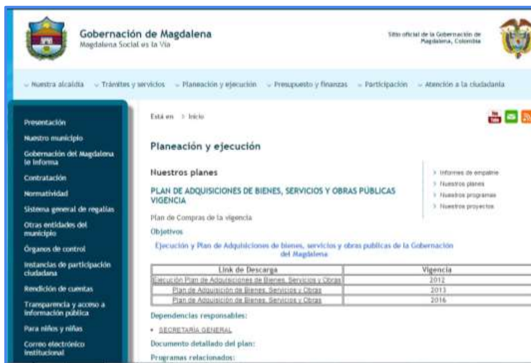
Figura 8 Impresión de pantalla Indicador Plan de Compras

Realizando un análisis minucioso sobre este indicador, se logró identificar que la página web de la Gobernación contempla información institucional relacionada con la gestión de la contratación pública durante la vigencia, lo anterior a través del Manual de Contratación y Plan de Adquisiciones, así como su correcta implementación a partir de la normativa existente. Tal es el caso de un archivo digital que se puede descargar en formato Excel que