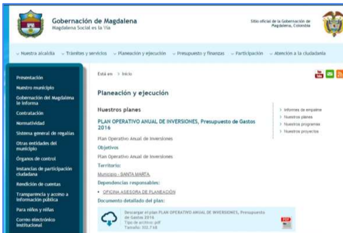
Figura 7. Impresión de pantalla Indicador de Presupuesto-Plazo de Cumplimiento de los Contratos