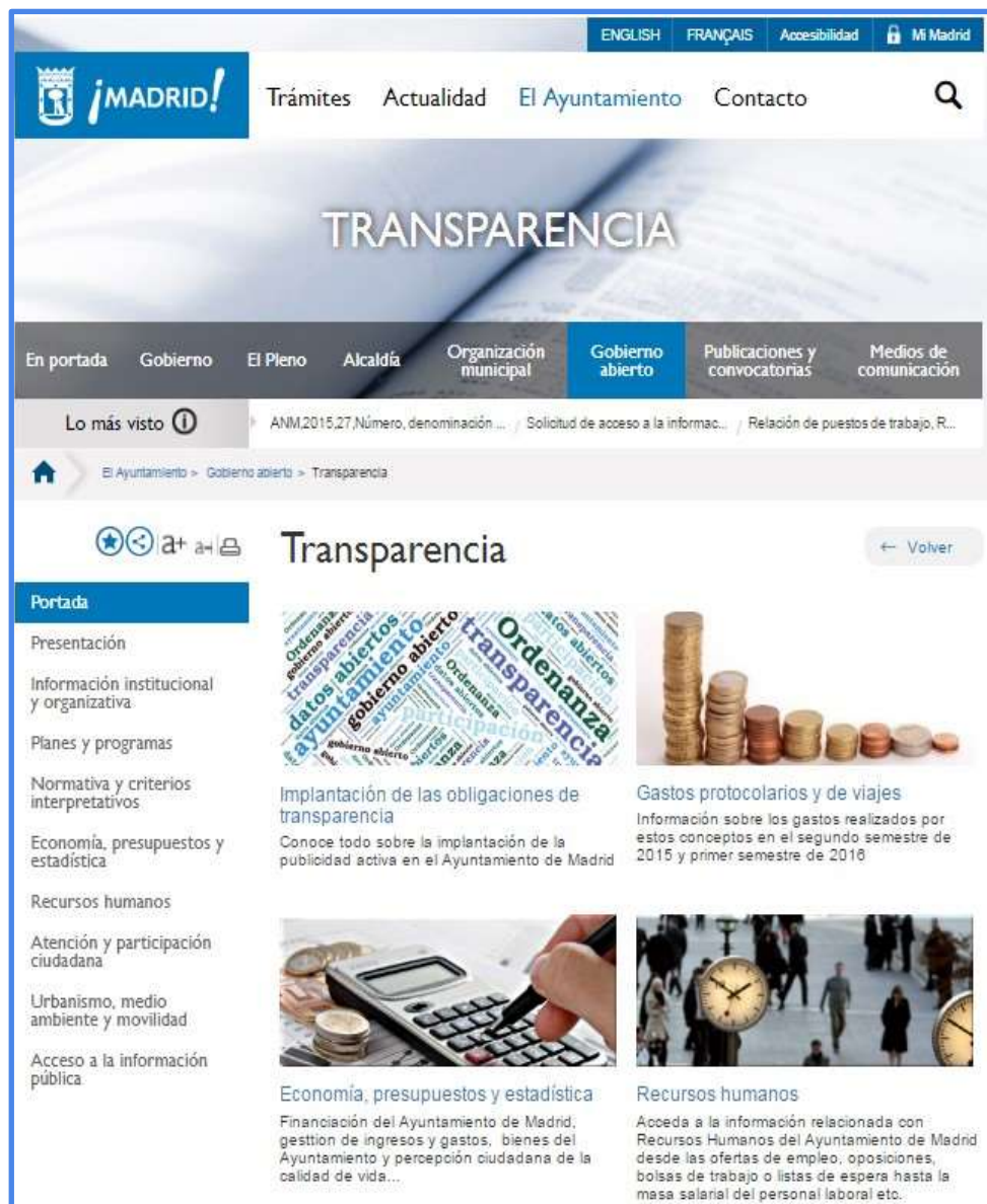
Figura 10 Impresión de pantalla Página principal del Portal de Transparencia

Por lo anterior, se tomará éste Portal como ejemplo de buenas prácticas de comunicación transparente, el cual se detallará a través de impresiones de pantalla, evidenciando los elementos diferenciadores de su contenido con relación a la Ley de Transparencia Colombiana.