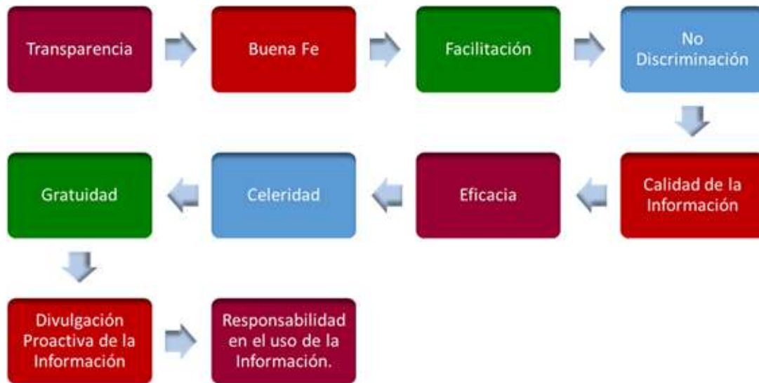
Figura 3. Elaboración propia con información de la Ley 1712 de 2014