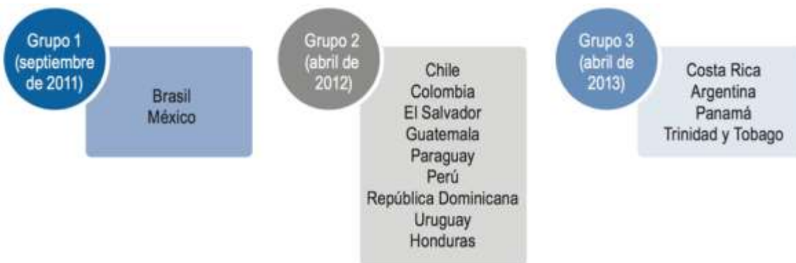
Figura 1. Fuente: Alianza para el Gobierno Abierto (2014) «Participating Countries».

http://www.opengovpartnership.org/countries , consultada 10/10/2016.