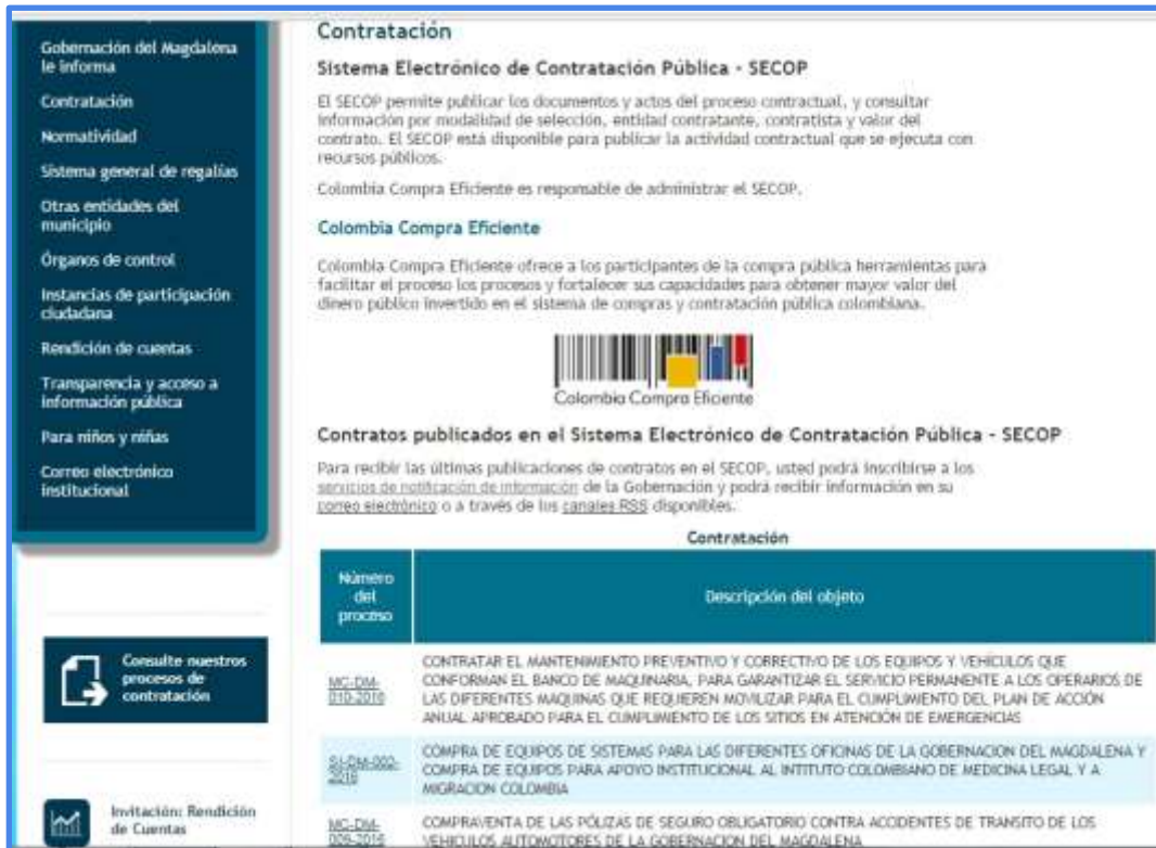
Figura 9. Impresión de pantalla Indicador Plan Anticorrupción y de Atención al Ciudadano

Realizando un análisis minucioso sobre este indicador, se logró identificar que La Gobernación del Magdalena incluye dentro de su página web un Plan de Lucha Contra la Corrupción y de Atención al Ciudadano para cada vigencia. Ver manual aquí: http://magdalena.gov.co/apc-aa-files/36363032616138336234663332366263/paac-2017_1.pdf