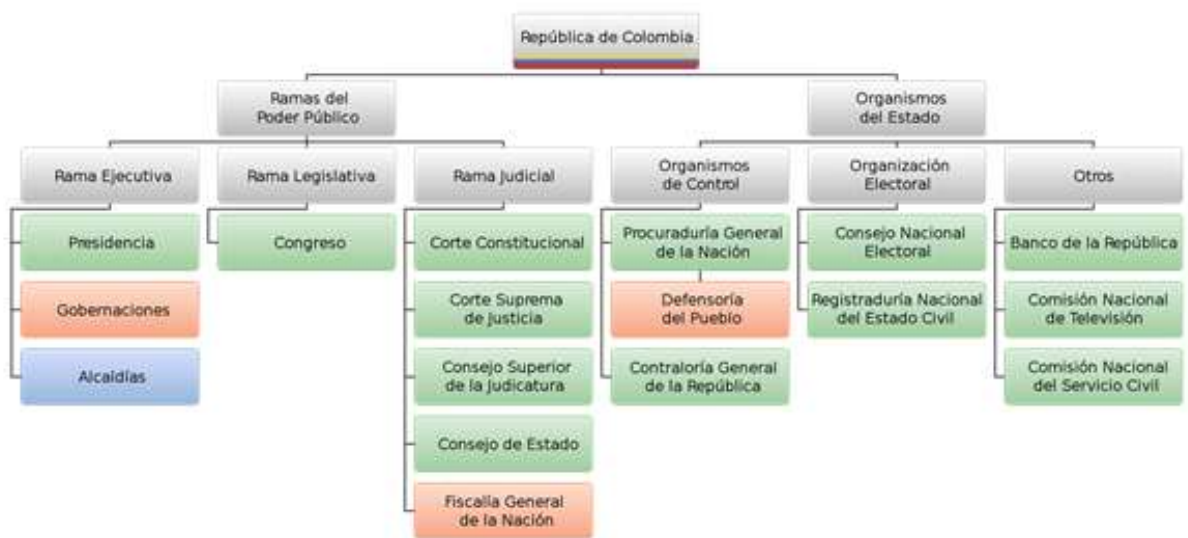
Figura 4. Banco de la República, biblioteca virtual. Consultada 13/10/2016.

http://www.banrepcultural.org/blaavirtual/ayudadetareas/politica/organizacion_del_estado_colombiano