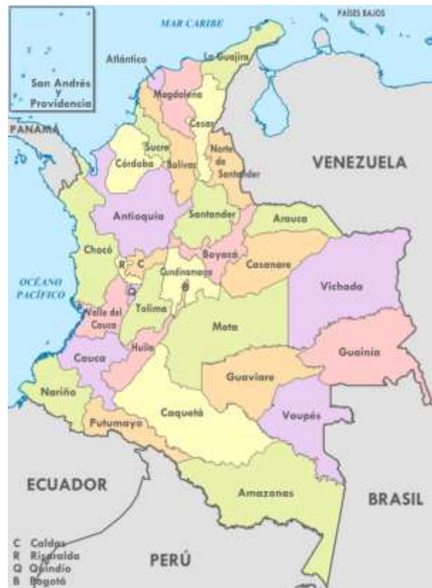
Figura 5. Organización Territorial de Colombia. Consultada 24/11/2016.

http://www.banrepcultural.org/blaavirtual/ayudadetareas/politica/organizacion_del_estado_colombiano