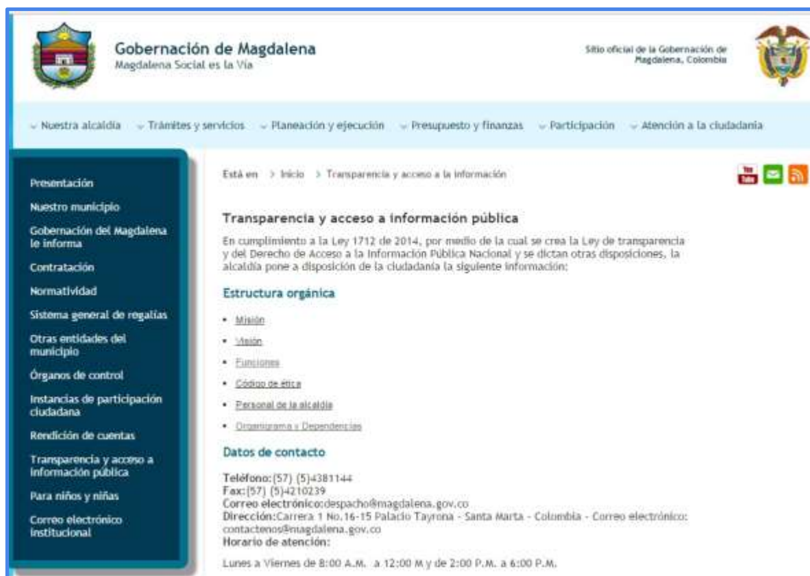
Figura 6. Impresión de pantalla Indicador Estructura Orgánica

transparencia antes mencionados y cuáles podrían ser las opciones de mejora para cada caso. Las impresiones de pantalla fueron tomadas el día 18/10/2016.