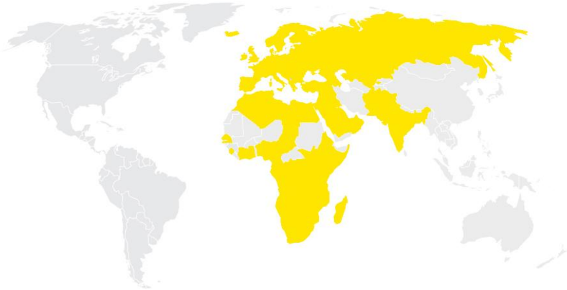
FIGURA 3: ÁREA EMEIA