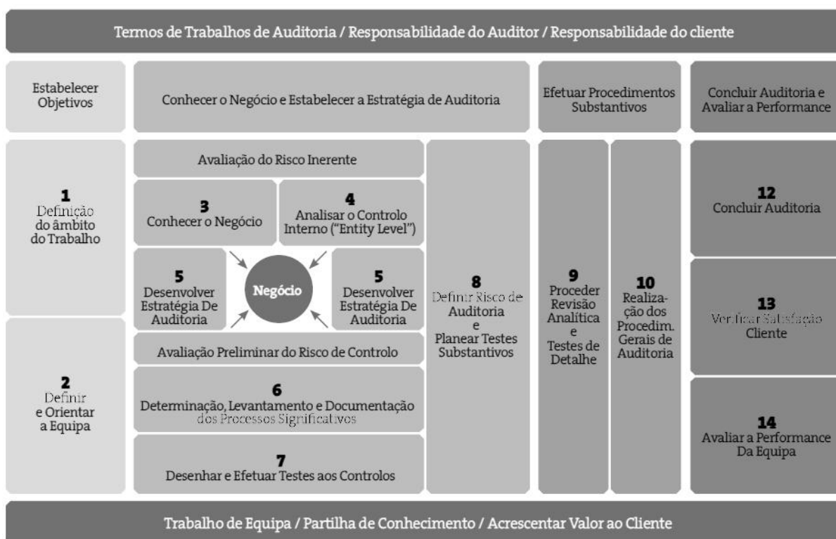
FIGURA 2: RESUMO DAS FASES E ATIVIDADES NA EXECUÇÃO DE UMA AUDITORIA

Se dividíssemos o trabalho do auditor em 4 fases e 14 atividades (Figura 2), facilmente percebemos que a segunda fase – Conhecer o Negócio e Estabelecer a Estratégia de Auditoria – atividades 3 a 8, assume um papel primordial em todo o processo.