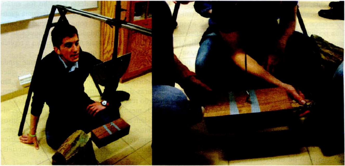
Trabalho experimental em laboratório.