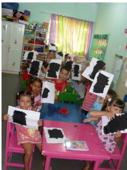
Fig. 10 Lápis de cera + Tinta da china

Também se pode fazer ao contrário, ou seja, primeiro pinta-se a folha branca com a tinta da china e deixa secar. No fim de seco, desenha-se por cima, de forma livre, com os lápis de cera, de preferência com cores fortes. Por fim, podem-se sobrepor várias camadas de cera / tinta da china e com os mesmos cabos do pincel ou da colher, raspa-se e o Desenho fica fantástico.