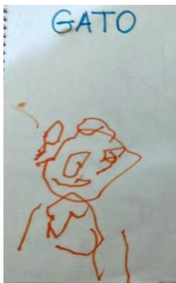
Fig. 3 Atribuição de nome às garatujas