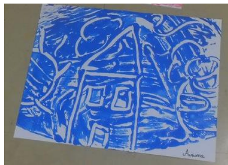
Fig. 9 Digitinta