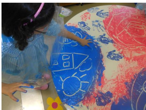
Fig. 8 Digitinta

O mesmo irá espalhar esta papa pela mesa (que poderá estar coberto com um plástico transparente ou branco) e pedirá à criança, para realizar um Desenho livre, utilizando apenas os seus dedos. No fim do desenho feito, o adulto irá colocar uma folha branca sobre o desenho executado, e este passará para a folha. Deixa secar e depois, em grupo, poderão analisar os mesmos.