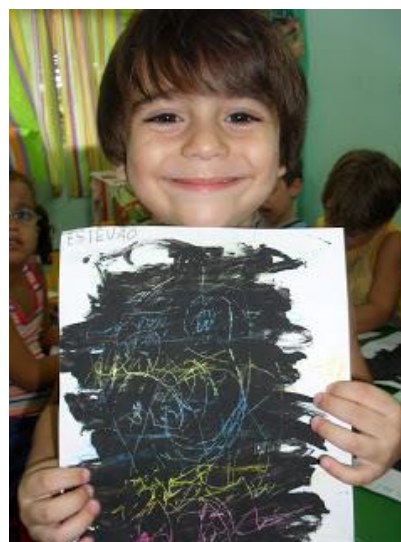
Fig. 11 Lápis de cera + Tinta da china