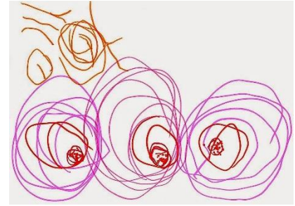
Fig. 2 Garatuja controlada