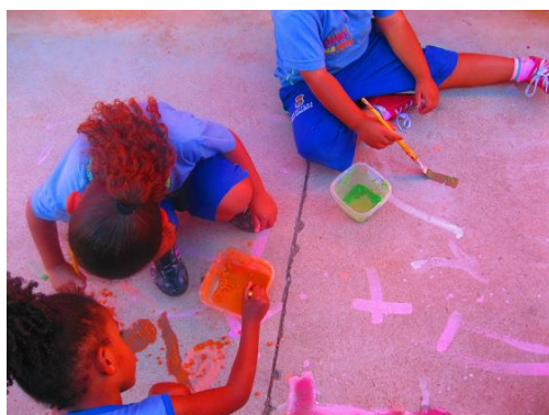
Fig. 7 Pinturas

Aqui, o Educador, irá pedir para os participantes terem a atenção de sempre que utilizarem os pincéis, colocarem de novo nos copos da respetiva cor. Se estes se enganarem e colocarem os pincéis em outros copos, o Educador deve chamar a atenção e explicar porquê, esperando que a criança entenda e faça o mesmo. Se este engano se repetir muitas vezes poderá existir um problema de coordenação da direita – esquerda (pág. 48).