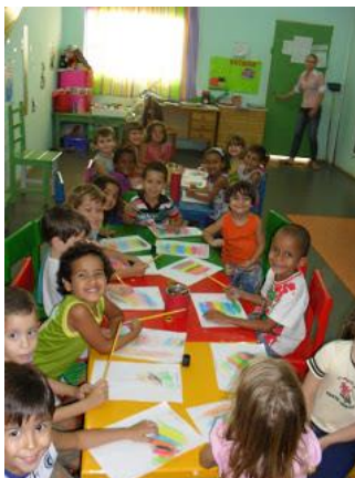
Fig. 6 Desenho Livre

1º - Na iniciação à pintura, basta entregar uma folha (no mínimo A3), pincéis e tintas e dar “liberdade de escolha do assunto, do formato, das formas e cores da sua obra e também o ritmo da sua execução”, pág. 32.