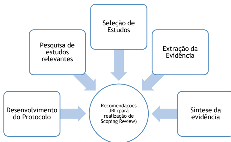
Figura 1: Recomendações da JBI para realizações de scoping review

para um maior rigor na elaboração do estudo, foram seguidas as etapas preconizadas pelo JBI, descritas por Tricco (2020) e representadas na figura que se segue (Figura1).