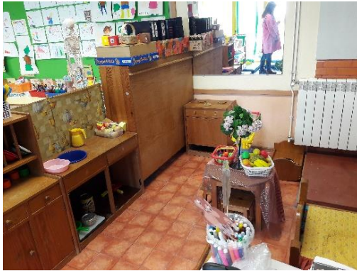
Figura 4- Área da casinha