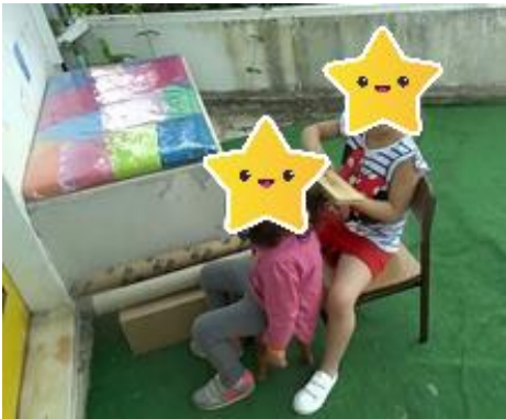
Figura 32- A preparação para a atuação