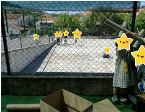
Figura 20- A nave espacial