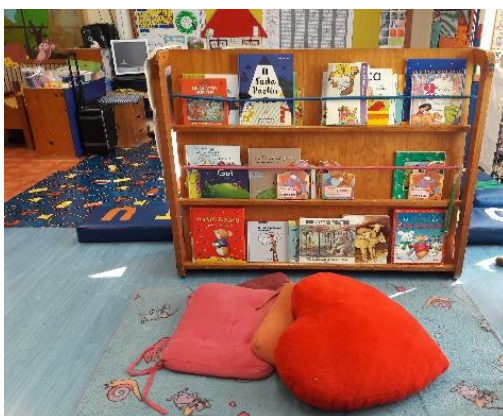
Figura 6- Área da leitura