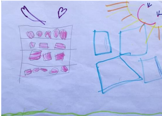
Figura 34- Desenho da nova área