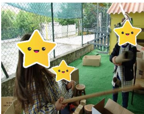
Figura 24- A batalha entre D. Afonso Henriques e D. Teresa