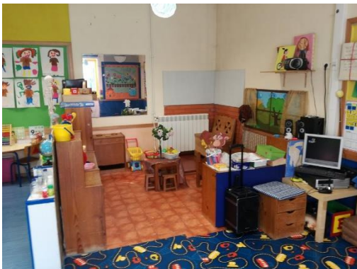
Figura 3- Área da informática e da casinha