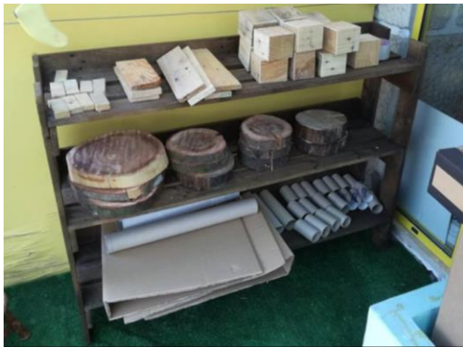
Figura 14- Organização dos materiais