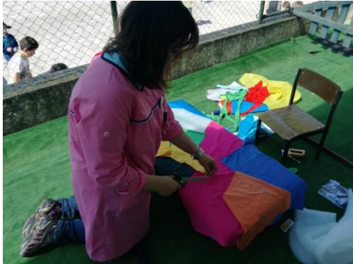
Figura 13- Requalificação do espaço