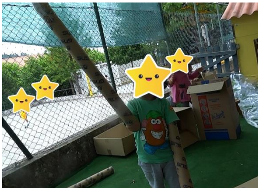
Figura 18- Os novos braços