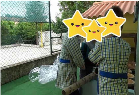
Figura 27- O vendedor