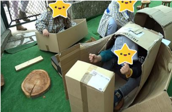
Figura 26- O Kart