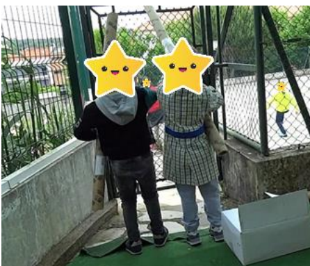
Figura 33- Os bombeiros