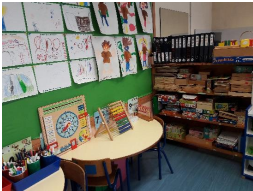
Figura 8- Área da matemática e dos jogos de mesa