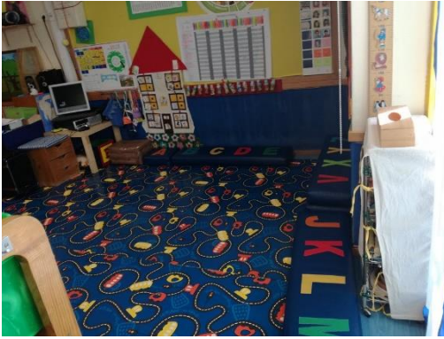
Figura 1- Área de grande grupo e dos jogos de chão