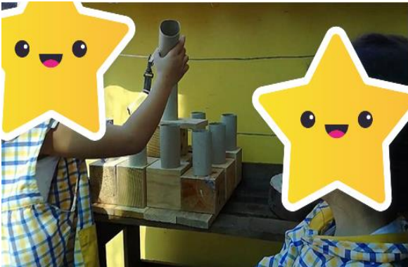
Figura 25- O bolo