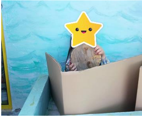
Figura 16- O trânsito do JI até casa