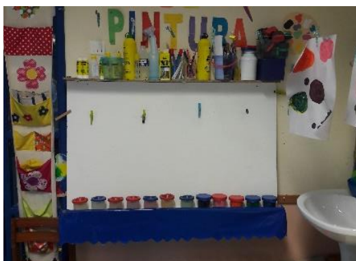
Figura 9- Área da pintura