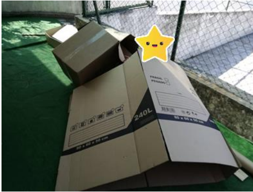
Figura 28- O esconderijo