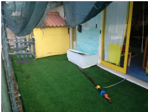
Figura 11- Espaço antes da intervenção