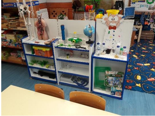
Figura 7- Área das ciências