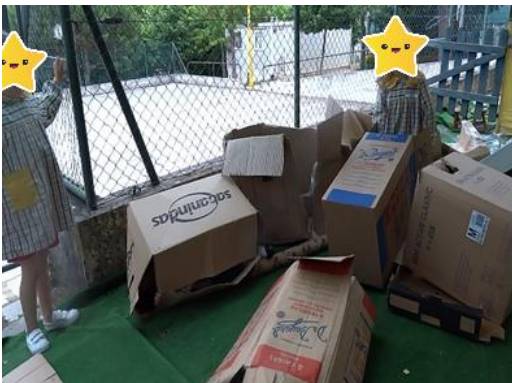
Figura 29- A peça de teatro "O lobo mau e os sete cabritinhos"