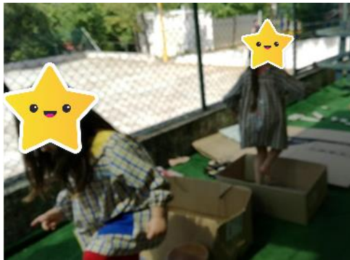
Figura 17- A fuga do incêndio