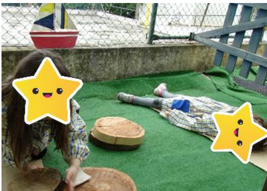
Figura 30- O acampamento