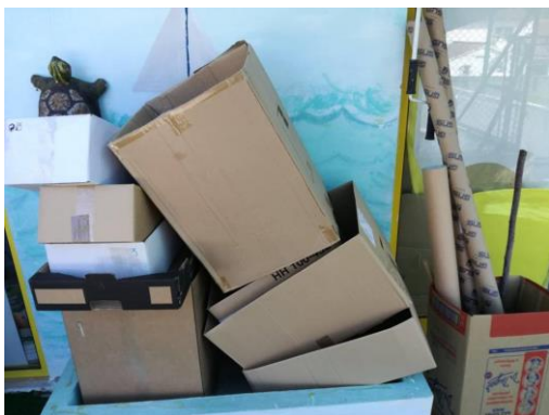
Figura 15- Zona das caixas e dos tubos de cartão