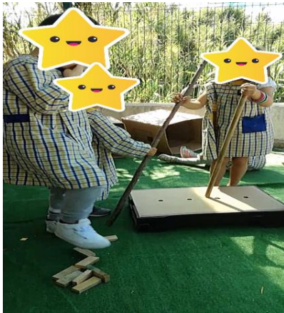
Figura 23- O barco