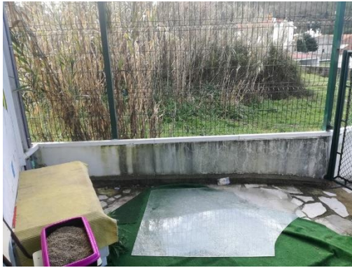
Figura 10- Espaço antes da intervenção