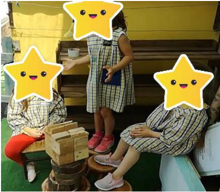
Figura 31- O aniversário