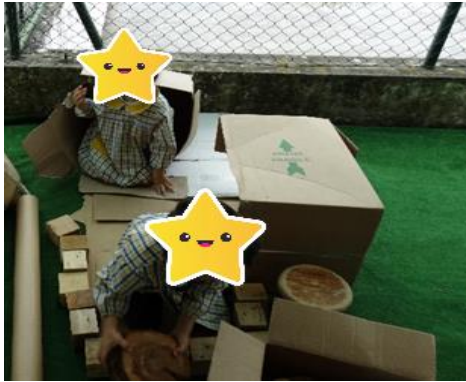
Figura 19- O abrigo para os animais de rua