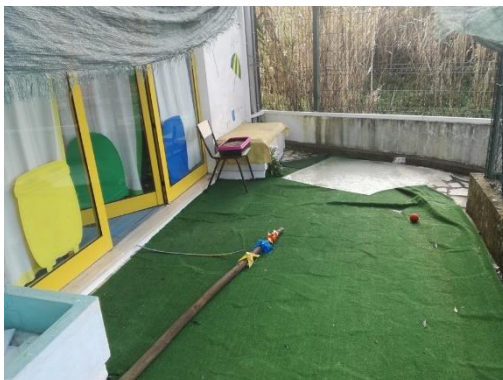
Figura 12- Espaço antes da intervenção