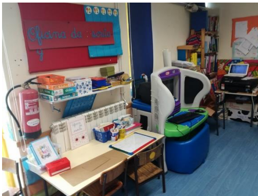
Figura 5- Área da escrita