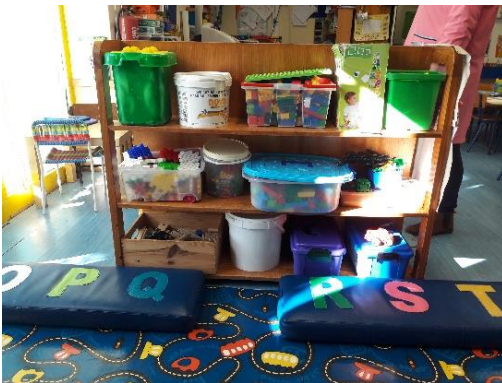
Figura 2- Jogos de chão