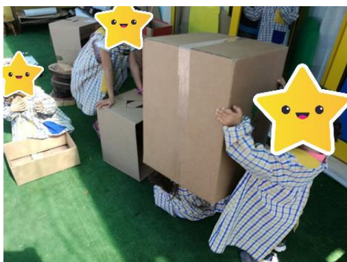
Figura 21- Quem está debaixo da caixa?