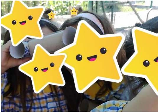
Figura 22- Os binóculos