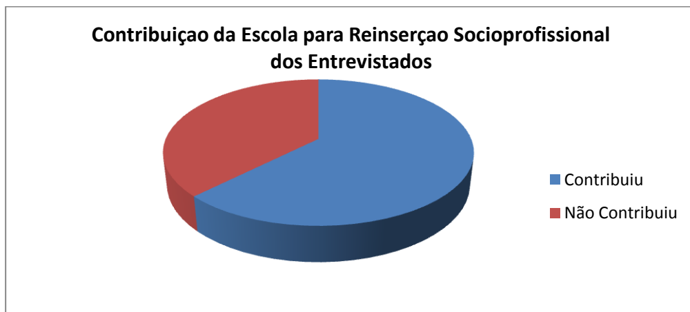
Gráfico nº 3