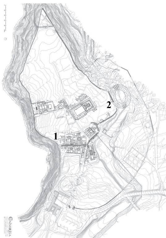
Figura 1 - Planta geral de Conimbriga (2006) (reprodução de Correia e Alarcão, 2008: Estampa VI) com a identificação da Basilica (1) e do Edifício sobre o Anfiteatro (2).

7. Solidus com o N° de Inv. 18.1, publicado em Correia, 2021: 23, 1.94.