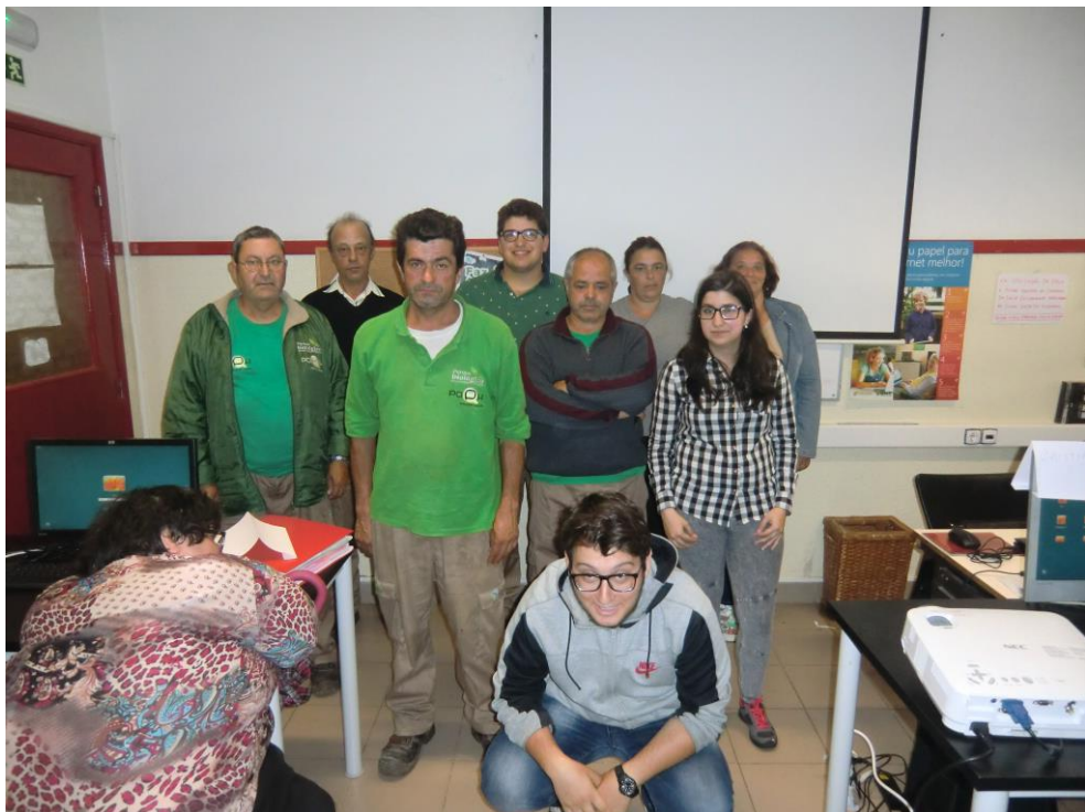
ANEXO 9 – Sessão Nº 2 2ª turma