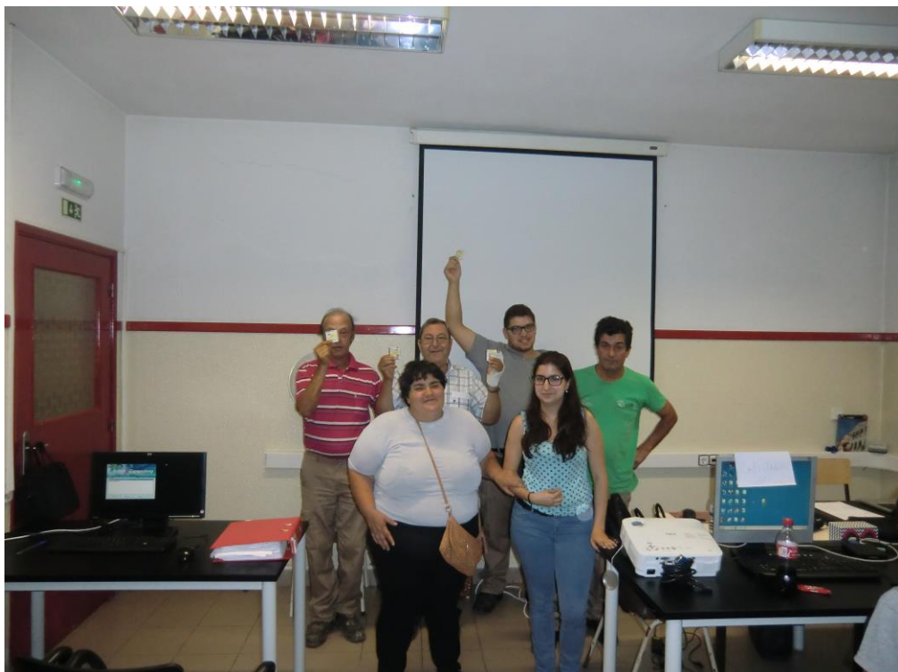
ANEXO 25 – Sessão Nº 10 2ª turma