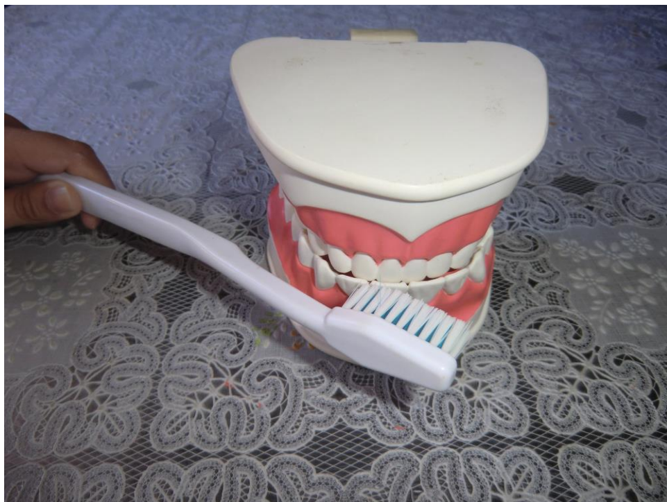
ANEXO 29 – Boca Fechada e Escova Gigantes