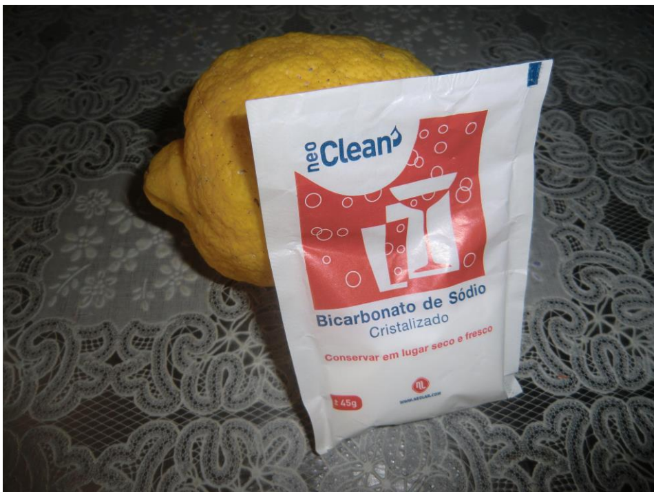
ANEXO 31 – Bicarbonato de Sódio e Limão