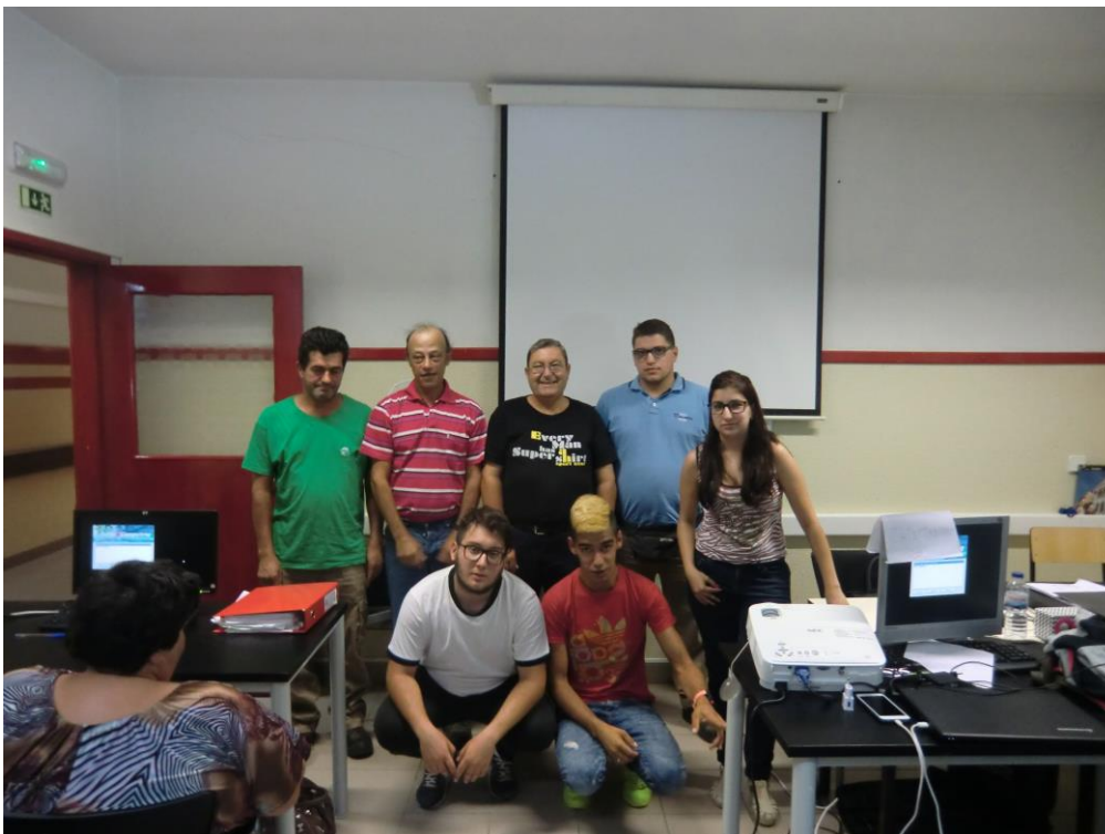
ANEXO 23 – Sessão N° 9 2ª turma