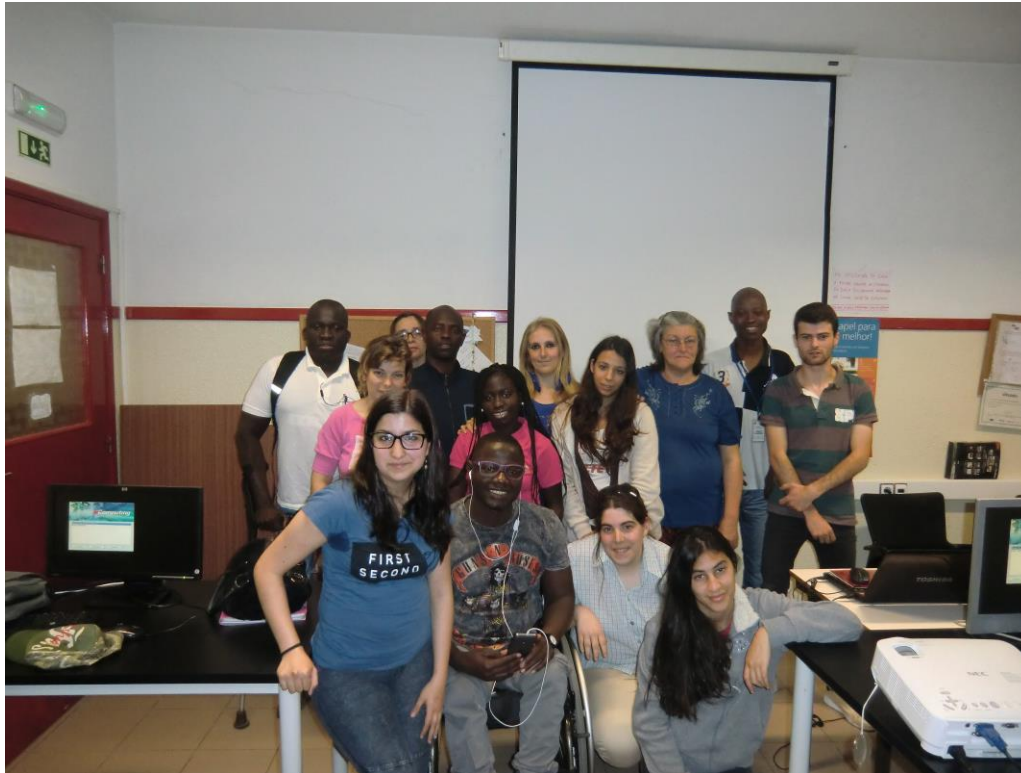
ANEXO 6 – Sessão Nº 1 1ª turma