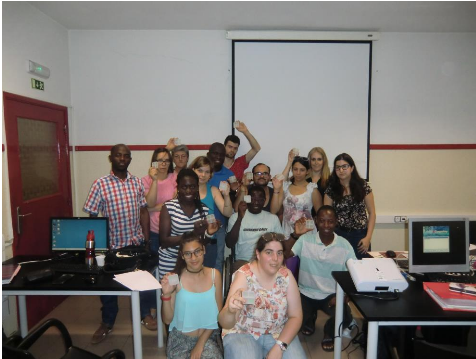
ANEXO 18 – Sessão Nº 7 1ª turma