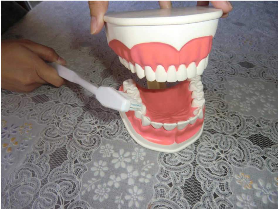
ANEXO 30 – Boca Aberta e Escova Gigantes