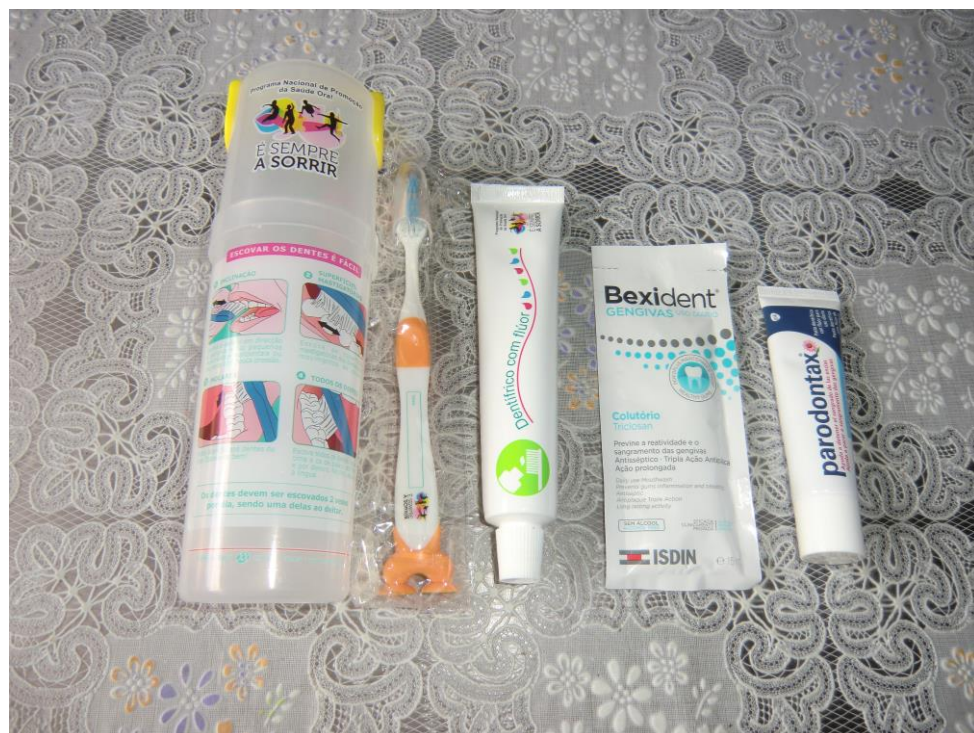
ANEXO 27 – Kit de higiene oral