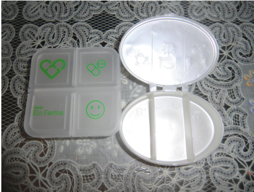
ANEXO 36 – Caixas da medicação