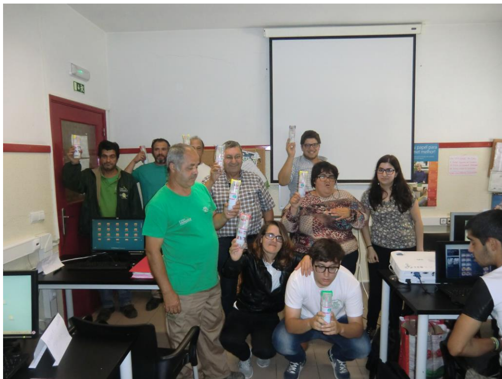
ANEXO 13 – Sessão Nº 4 2ª turma