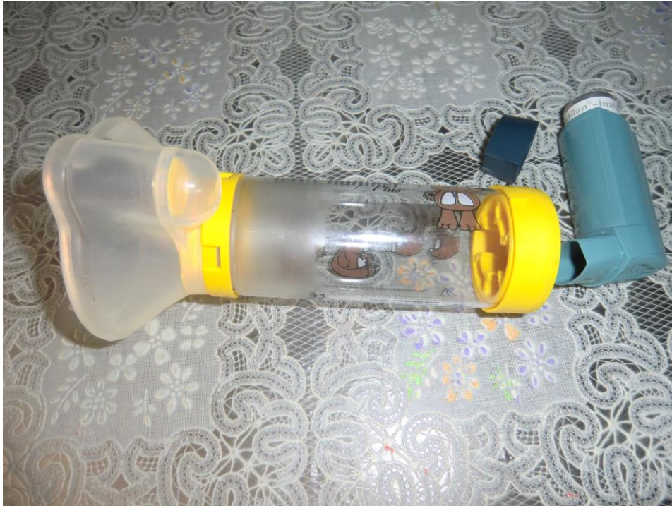
ANEXO 34 – Máscara e bomba da asma