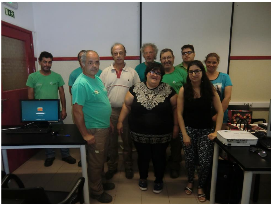
ANEXO 15 – Sessão Nº 5 2ª turma