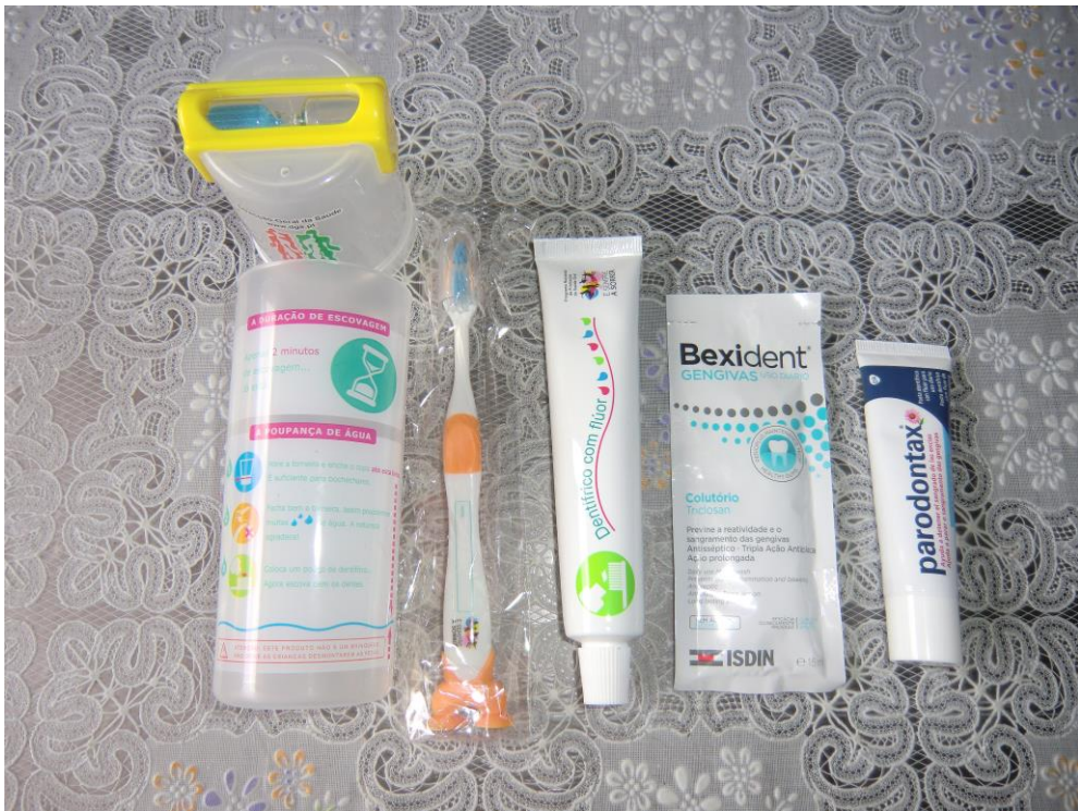
ANEXO 28 – Kit de higiene oral Parte 1