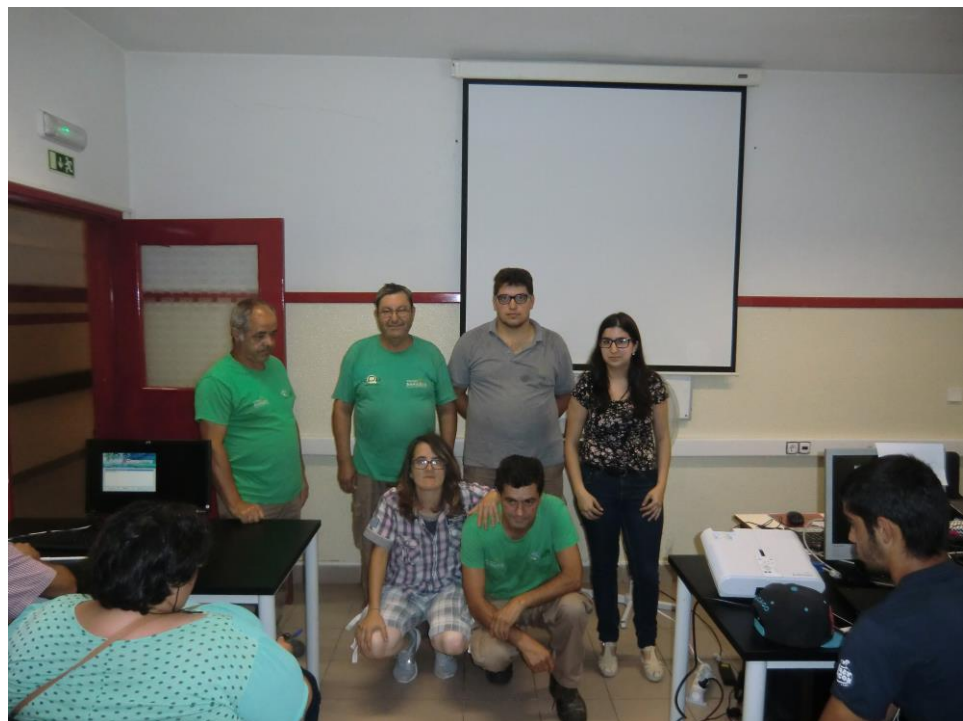
ANEXO 17 – Sessão Nº 6 2ª turma