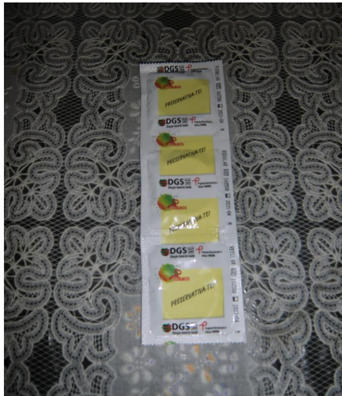
ANEXO 37 – Preservativo Masculino