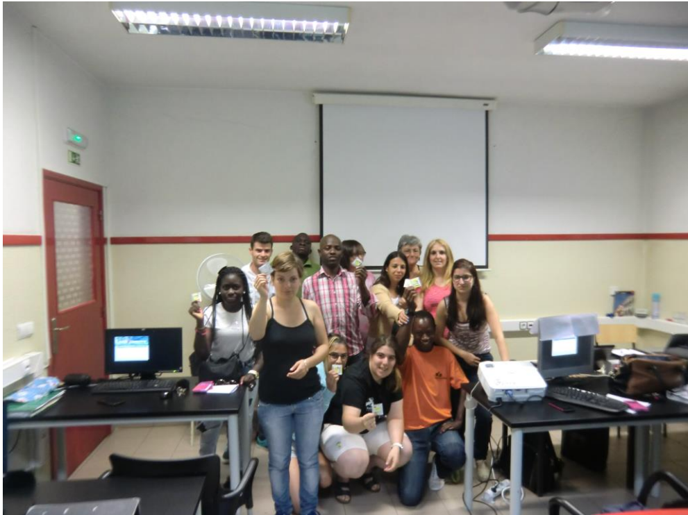
ANEXO 24 – Sessão Nº 10 1ª turma