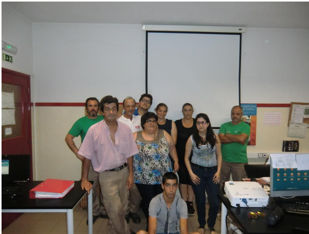
ANEXO 11 – Sessão N° 3 2ª turma