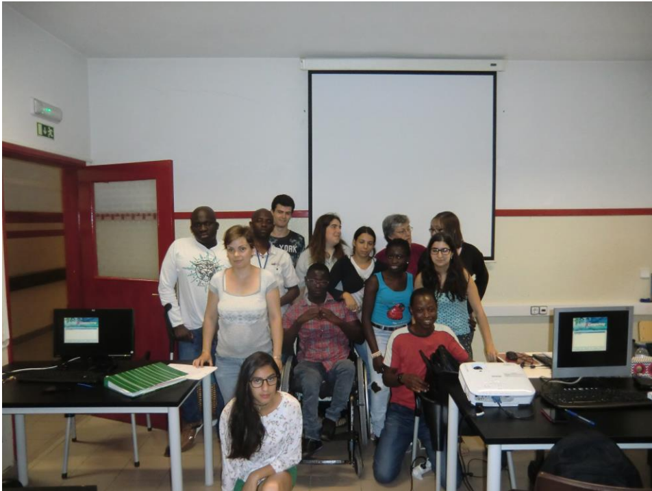
ANEXO 22 – Sessão N° 9 1ª turma