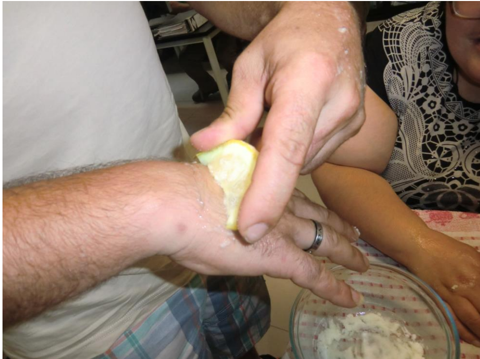
ANEXO 32 – Experiência