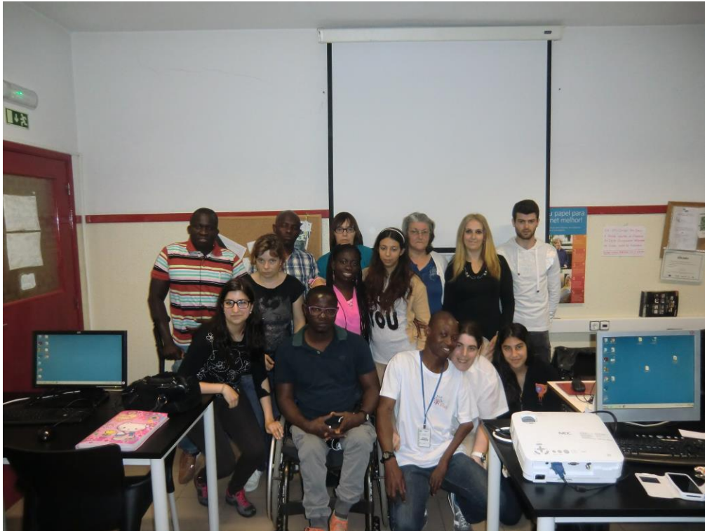
ANEXO 8 – Sessão Nº 2 1ª turma