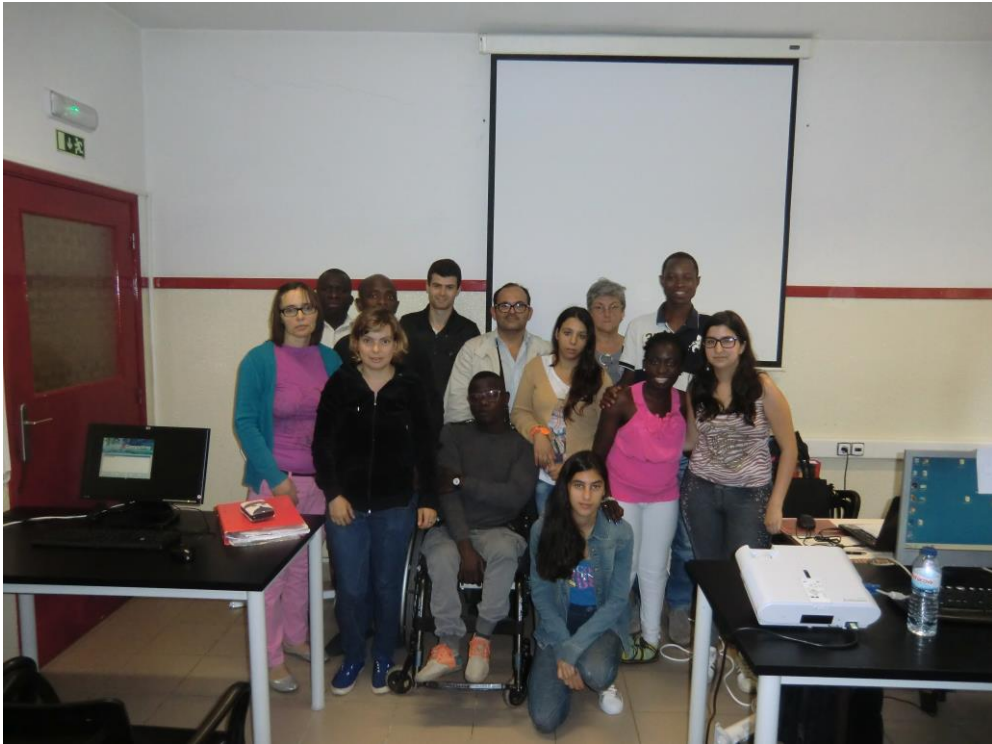
ANEXO 20 – Sessão N° 8 1ª turma