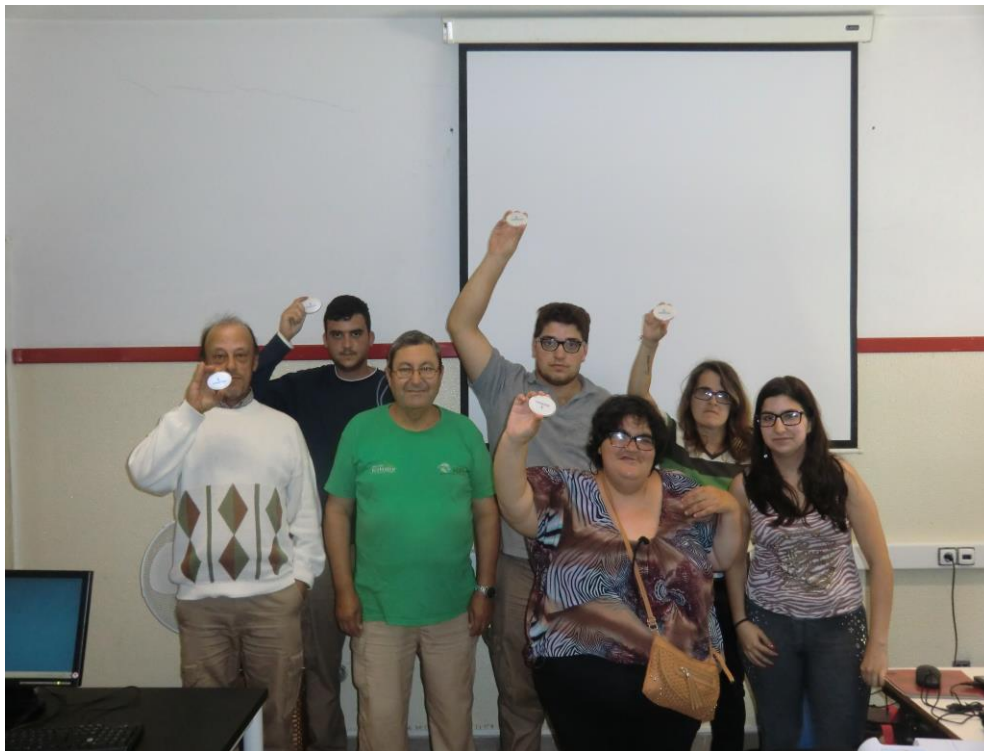
ANEXO 19 – Sessão Nº 7 2ª turma