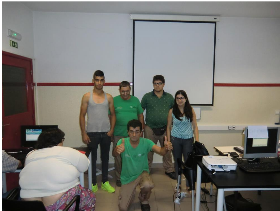
ANEXO 21 – Sessão N° 8 2ª turma