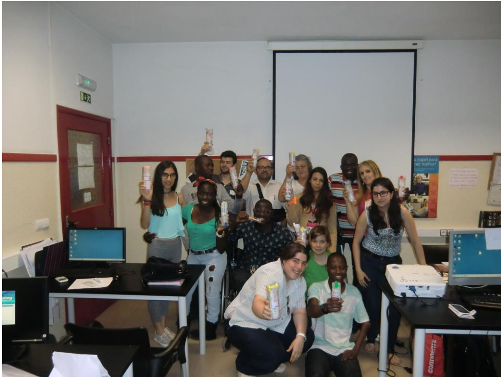
ANEXO 12 – Sessão Nº 4 1ª turma