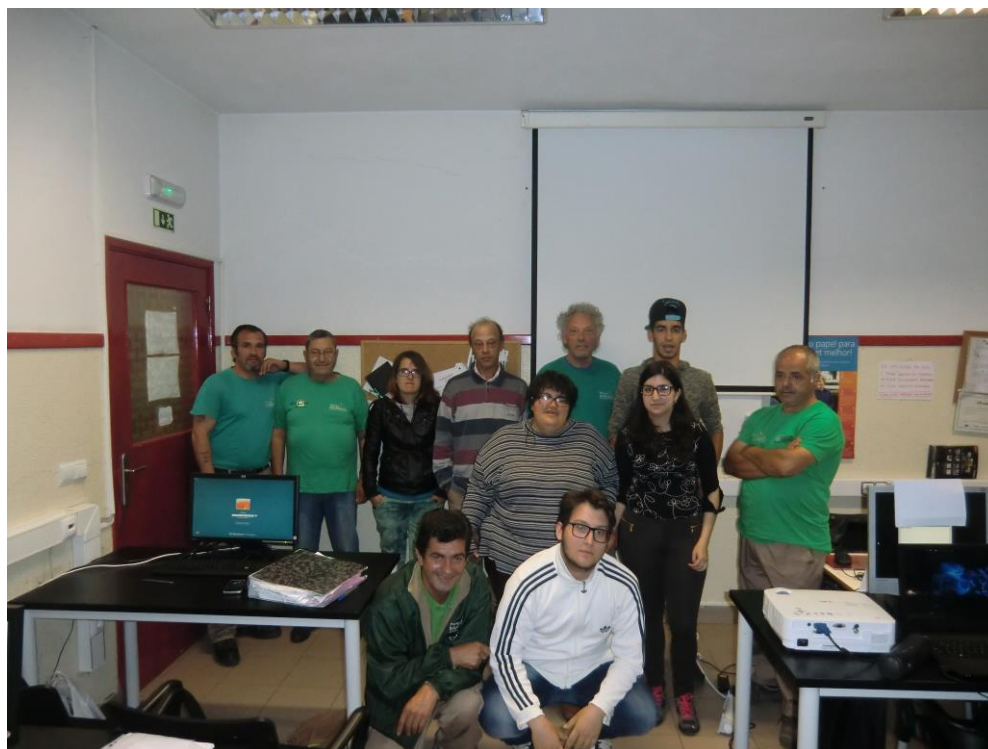
ANEXO 7 – Sessão Nº 1 2ª turma