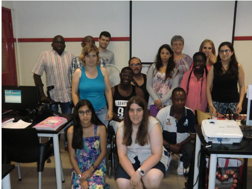
ANEXO 16 – Sessão Nº 6 1ª turma