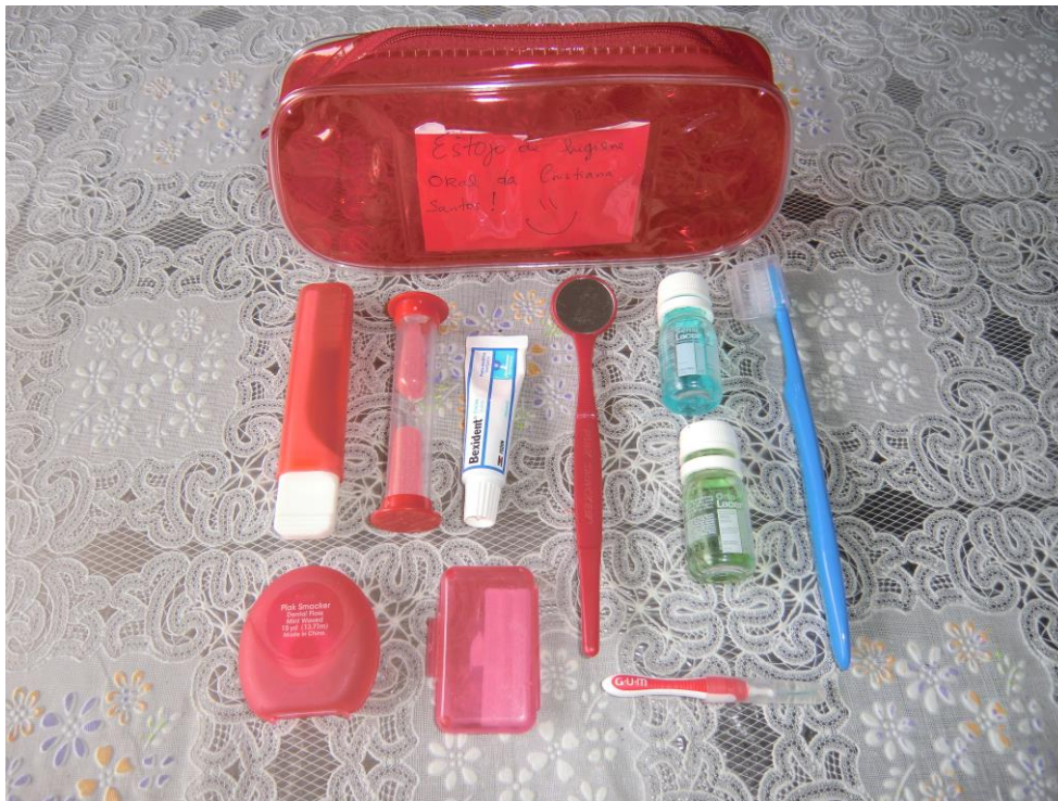
ANEXO 26 – Kit de higiene oral da mestranda