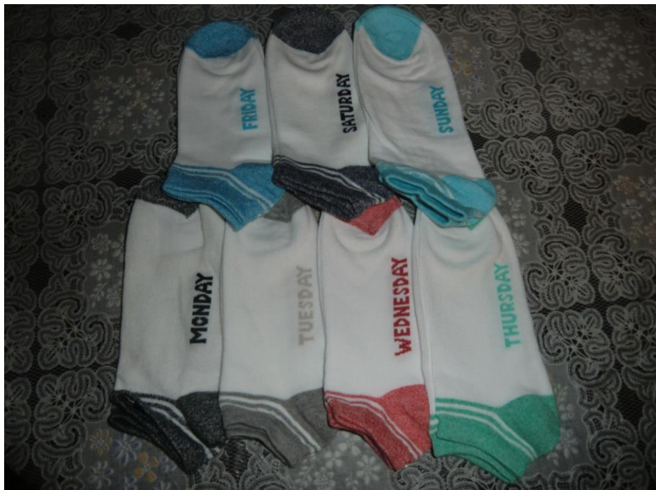
ANEXO 33 – Pack de meias