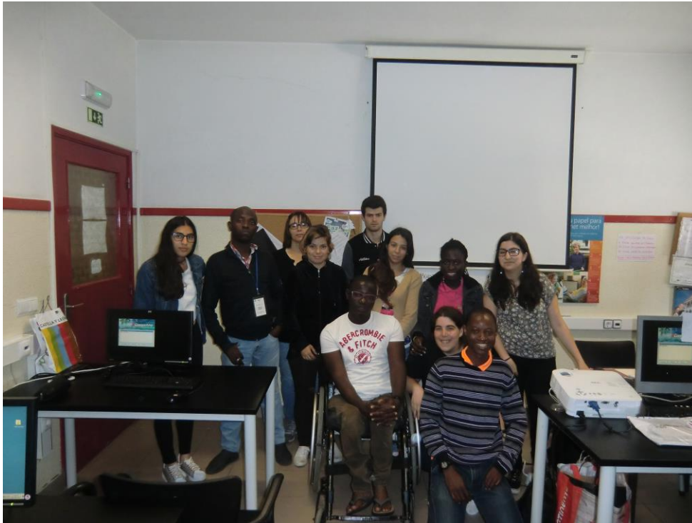
ANEXO 14 – Sessão Nº 5 1ª turma