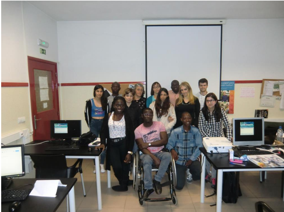
ANEXO 10 – Sessão N° 3 1ª turma