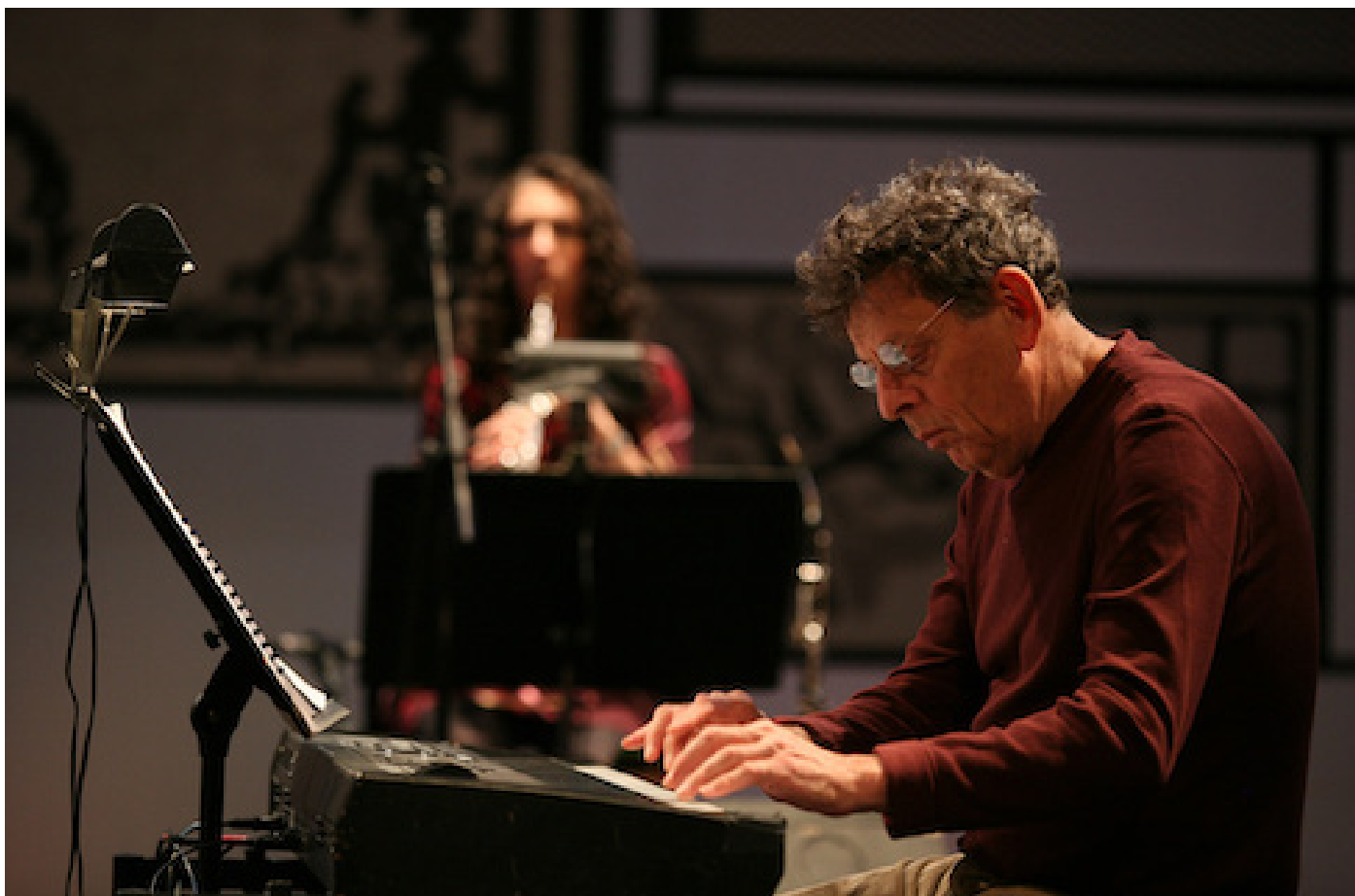
Philip Glass em 2008