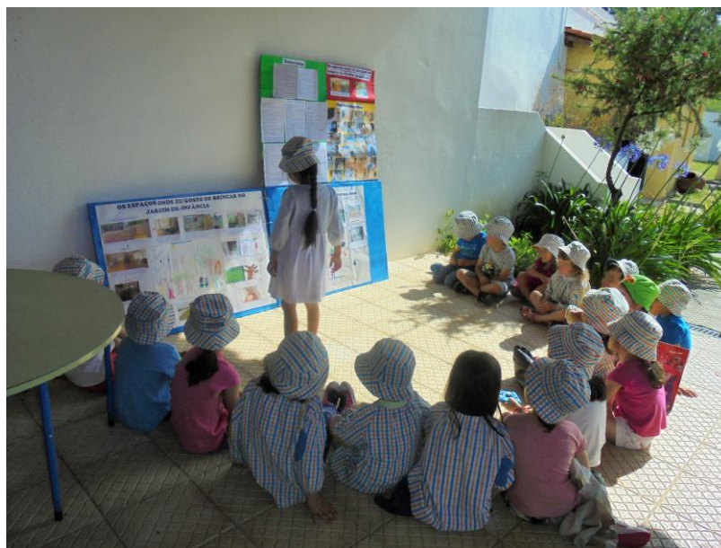
Figura 20 - Discussão em grande grupo