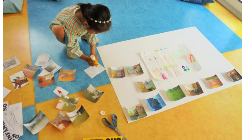
Figura 11 - Realização do mapa conceitual (AR)