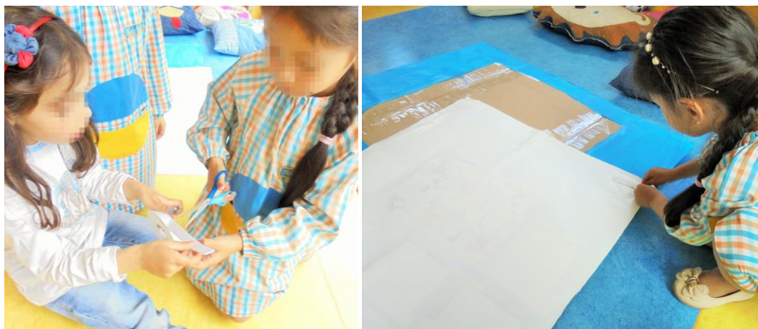
Figura 18 - Colagem dos mapas conceituais na manta mágica