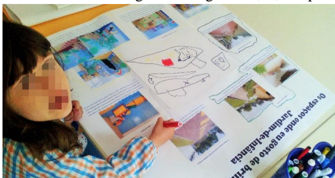
Figura 3 - Realização do mapa conceitual (BF)

Seguidamente, as crianças realizaram mapas conceituais (Registo fotográfico no apêndice IV) que consistiram em apresentar a duas dimensões as representações desenvolvidas pelas mesmas, pretendendo-se juntar, individualmente, o material recolhido durante os circuitos, nomeadamente os registos fotográficos, os desenhos realizados e pequenos comentários escritos (Clark & Statham 2005; Clark, 2010). Assim, as crianças, individualmente, selecionaram as fotografias que pretendiam colocar no mapa, fotografias e/ou os desenhos, tendo-se em consideração a importância que lhes atribuíam. Após a seleção dos recursos foram impressas as fotografias, estabelecendo-se pequenas conversas sobre as mesmas, em que as crianças indicaram que brincadeiras realizavam. De seguida, as crianças colaram o desenho do circuito realizado no centro do mapa, colocando ao seu redor as fotografias e/ou desenhos destas que, por coincidência ou não, faziam correspondência com o percurso realizado. Na parte superior de cada fotografia ou espaço foi colocado o respetivo nome e um número que identifica a ordem pela qual a criança realizou o percurso, fazendo-se correspondência entre o circuito e os registos fotográficos, e, na parte inferior dos registos fotográficos, um pequeno comentário escrito do que as crianças foram dizendo sobre as suas brincadeiras durante os circuitos e durante a seleção dos registos fotográficos.