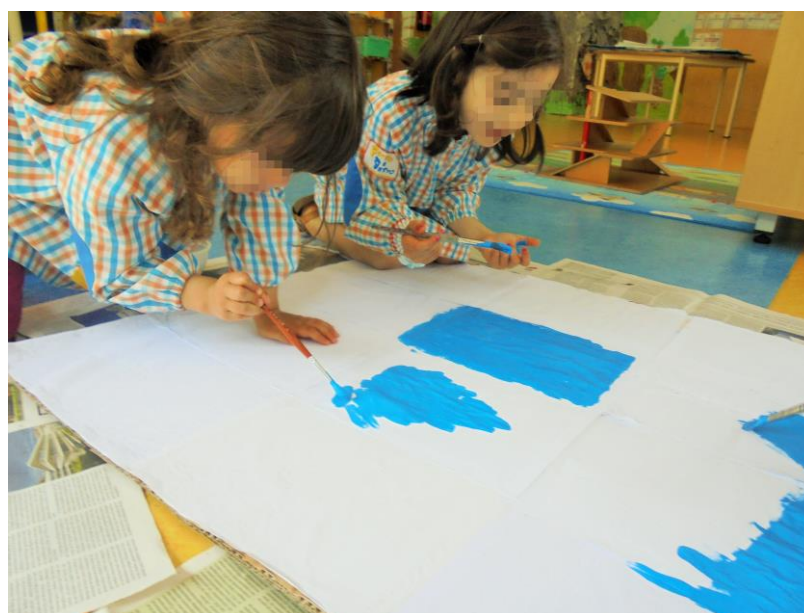
Figura 17 - Realização da manta mágica (decoreção)