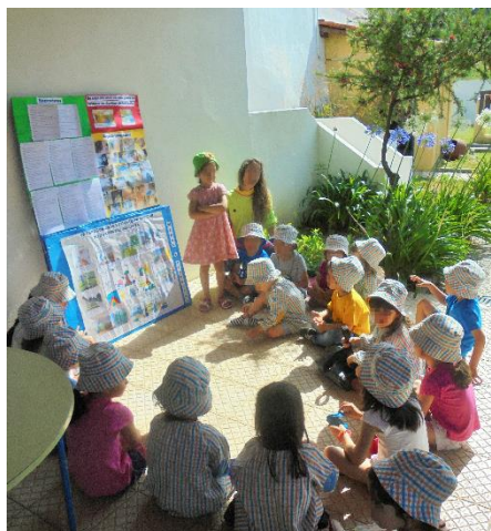
Figura 4 - Projeção da manta mágica

A configuração adotada na manta mágica permitiu ao grupo de crianças a visualização geral de todo o processo desenvolvido pelos participantes no estudo (Clark, 2005, 2010; Clark & Statham 2005; Moss, 2006).