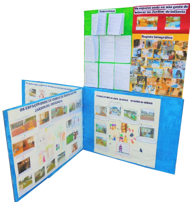
Figura 23 - Manta mágica