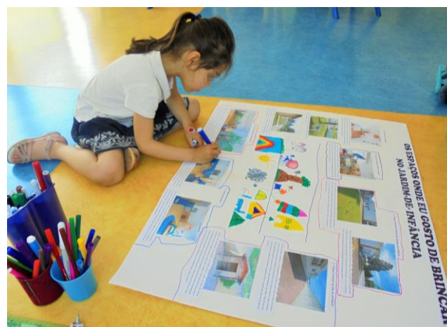
Figura 13 - Conclusão do mapa conceitual (AR)