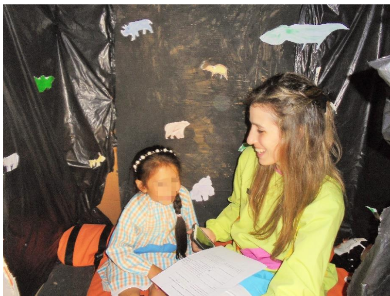
Figura 14 - Realização da entrevista à AK