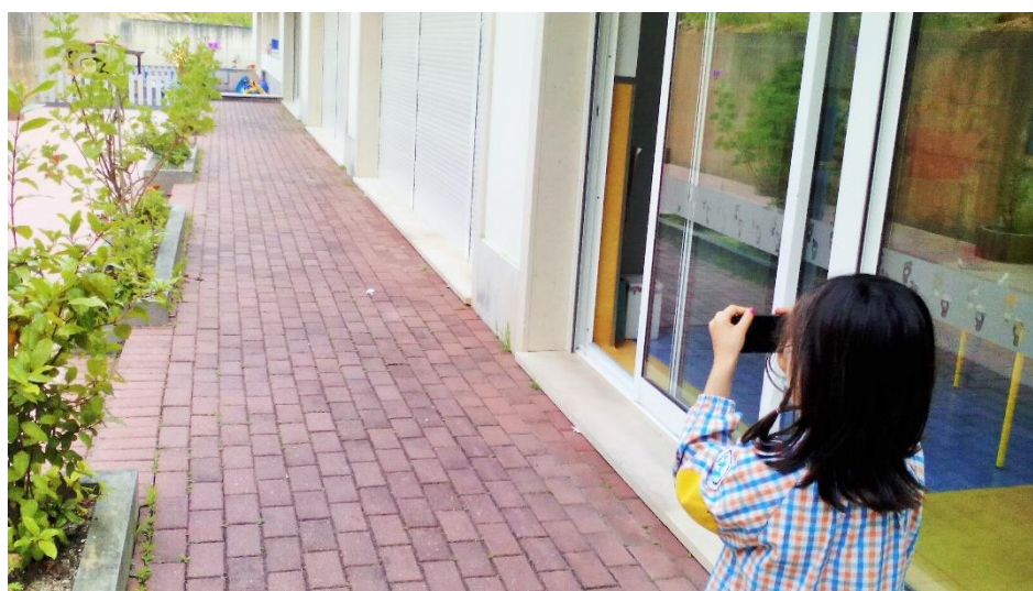
Figura 8 - Registo fotográfico do espaço de brincadeira (BD)