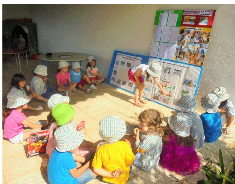
Figura 21 - Diálogo em grande grupo sobre o processo do estudo