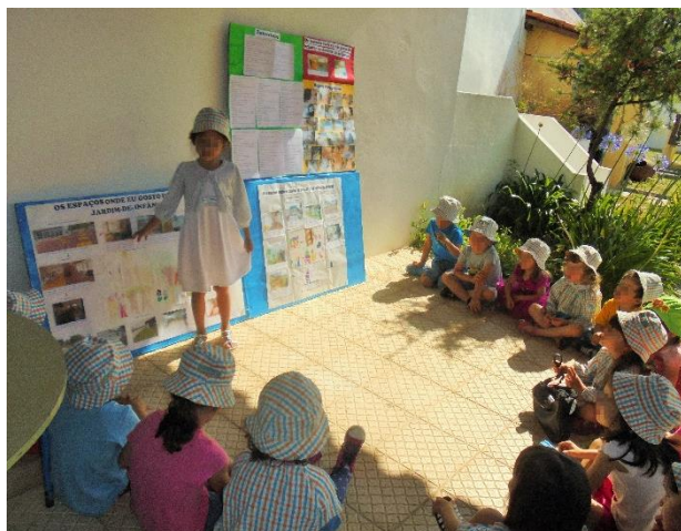
Figura 5 - Projeção da manta mágica para o grupo