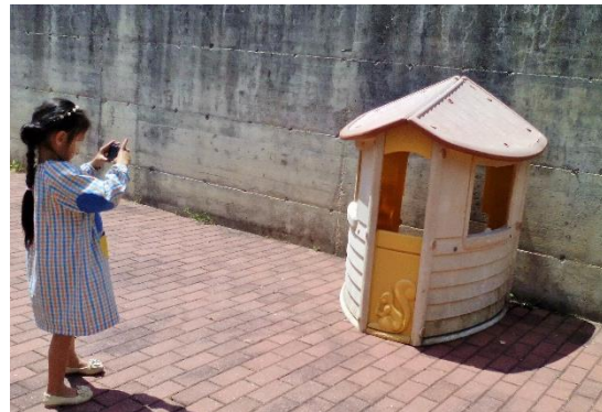
Figura 2 - Registo fotográfico dos espaços de brincadeira