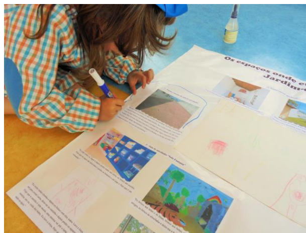
Figura 12 - Realização do mapa conceitual (MA)