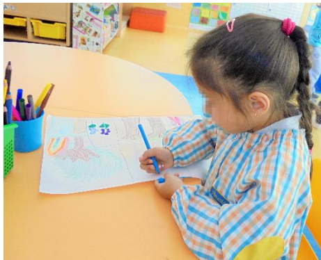
Figura 1 - Realização do mapa do percurso

As crianças realizaram o mapa do percurso, com lápis de cor, algumas no decurso do percurso e outras após a sua concretização (Registo fotográfico no apêndice III). No decurso dos circuitos, as crianças, individualmente, tiraram fotografias ao que consideravam ser mais significativo para elas, guiando-nos pelos diversos espaços da instituição, referindo onde brincavam e que brincadeiras realizavam em determinado local, sendo que algumas crianças também realizaram pequenos desenhos dos espaços nos quais brincam (Registo fotográfico no apêndice III).