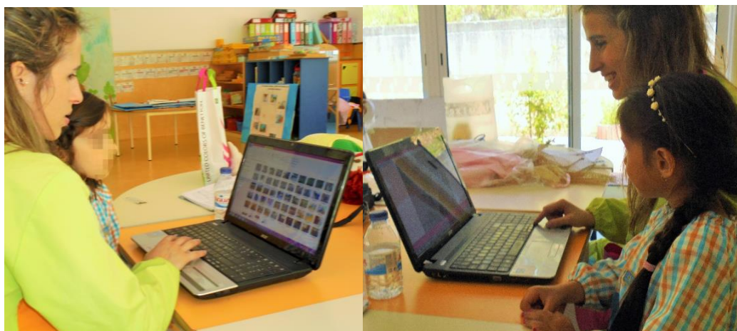
Figura 10 -Seleção dos registos fotográficos