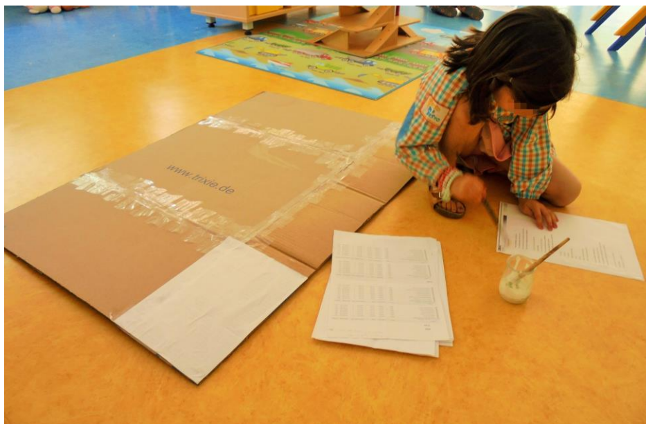
Figura 16 - Processo de realização da manta mágica (colagens)