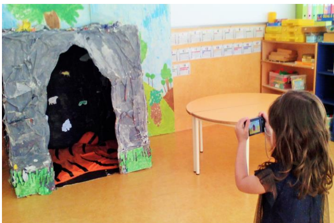
Figura 6 - Registo fotográfico dos espaços de brincadeira (MD)