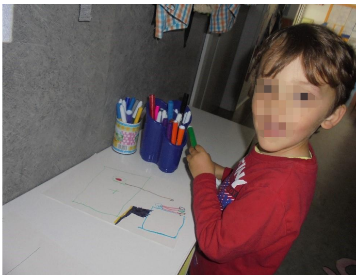
Figura 9 - Realização do circuito (MF)