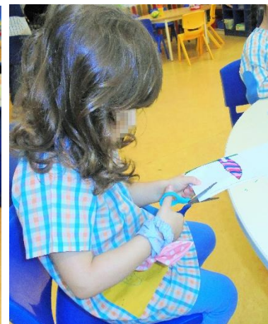
Figura 7 - Registos gráficos dos espaços