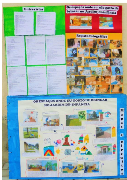
Figura 22 – Exposição da manta mágica