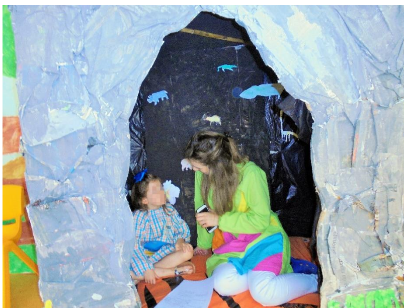
Figura 15 - Realização da entrevista à MA