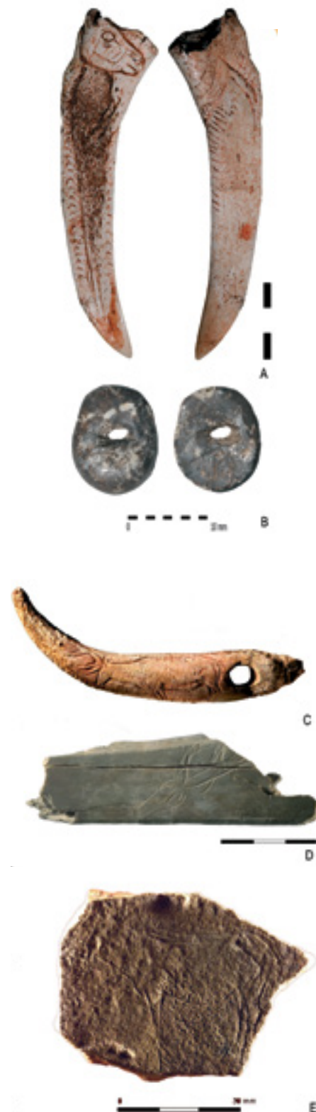
Fig. 4. Tipos de suporte de arte móvel.

A arte móvel pode aparecer em objetos utilitários (zagaias, arpões, etc.) e em objetos cuja funcionalidade nos escapa (e.g. os denominados bastões de comando) ou não se relacionam de todo com as atividades de subsistência mais imediata (pequenas esculturas, placas e plaquetas, discos perfurados, etc.). Este tipo de peças pode ter uma natureza mineral (calcário, xisto, ocre, etc.) ou orgânica (ossos, hastes, marfim), sobrevivendo mais facilmente as primeiras que as segundas aos processos erosivos da generalidade dos solos. Assim, se em zonas calcárias como a Região Cantábrica se podem encontrar diversos exemplos de peças efetuadas sobre suportes orgânicos, na bacia do Douro, de solos mais ácidos, não se conhece qualquer objeto deste tipo. Cite-se apenas o bastão perfurado (entretanto desaparecido) da gruta de Caballón, localizada já na bacia do Ebro, mas muito perto da Submeseta norte. A arte móvel sob pedra (exclusivamente xistos) conta, no entanto com vários exemplos, como é o caso das peças de Villalba, La Dehesa, Martoiros ou dos grandes conjuntos da Peña de Estebanvela, Medal ou Fariseu. Fora da bacia do Douro mas ainda no interior da área por onde se distribuem as fontes de matéria-prima identificadas no Vale do Côa refiram-se os achados da Buraca Grande, Caldeirão, Palha e Vau.