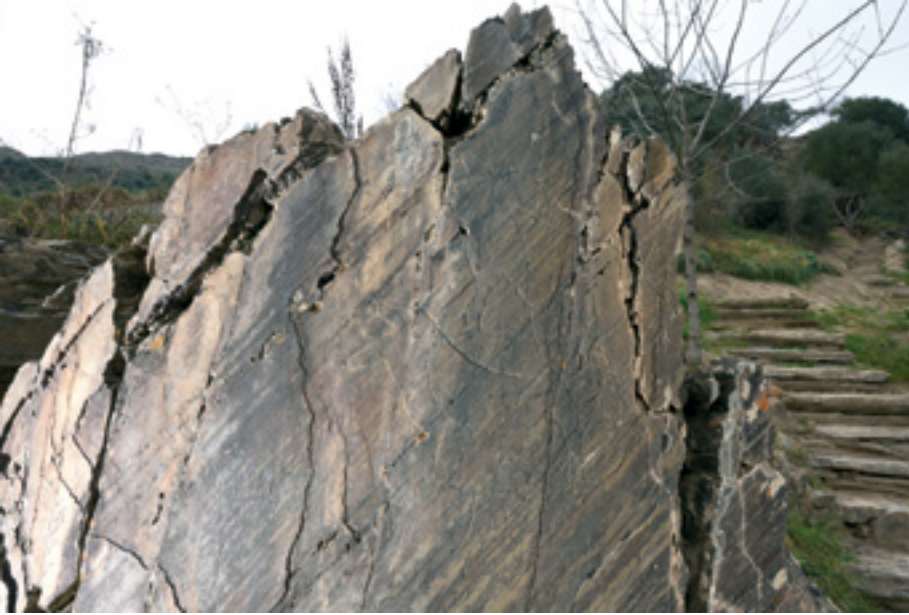
Fig. 5. Composição principal da rocha da Canada do Inferno, o primeiro painel identificado com arte paleolítica no Vale do Côa.

cavalo (ou urso) do Portallón de la Cueva Mayor de Atapuerca, cuja autenticidade se discute desde a sua descoberta. Fora da bacia do Douro, mas na passagem entre esta e a bacia do Ebro, refira-se o conjunto gráfico de Penches e a fase mais antiga de Ojo Guareña.