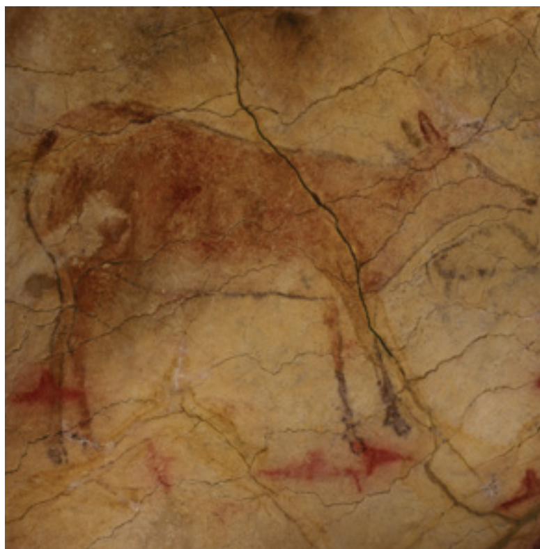
Fig. 6. Cerva da gruta de Altamira (Museu de Altamira)

Para além desta diversidade, existem variações cronológicas na decoração dos espaços subterrâneos. Alguns sítios funcionaram provavelmente como lugares de agregação durante gerações, o que