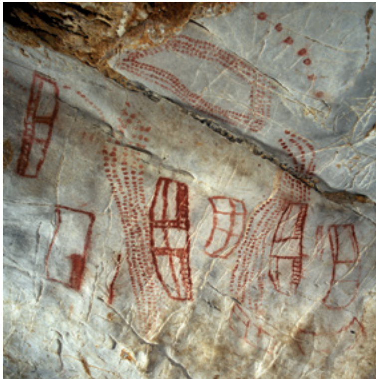
Fig. 3. Gruta de Castillo. Signos retangulares

O meio com que a pintura se aplicou também gera diferenças nas representações. No que toca às técnicas aditivas, as principais técnicas de aplicação na arte paleolítica são o traço pintado digital, que implica a aplicação com o dedo do pigmento diluído, para delinear apenas o contorno da figura ou a sua totalidade, e o traço pintado com pedaços de carvão ou lápis de ocre ou manganês, no qual se usam estes como meio de aplicação do pigmento, usualmente apenas para o contorno. O uso do pincéis ou de pequenos bastões para a aplicação do corante é marginal durante o Paleolítico.