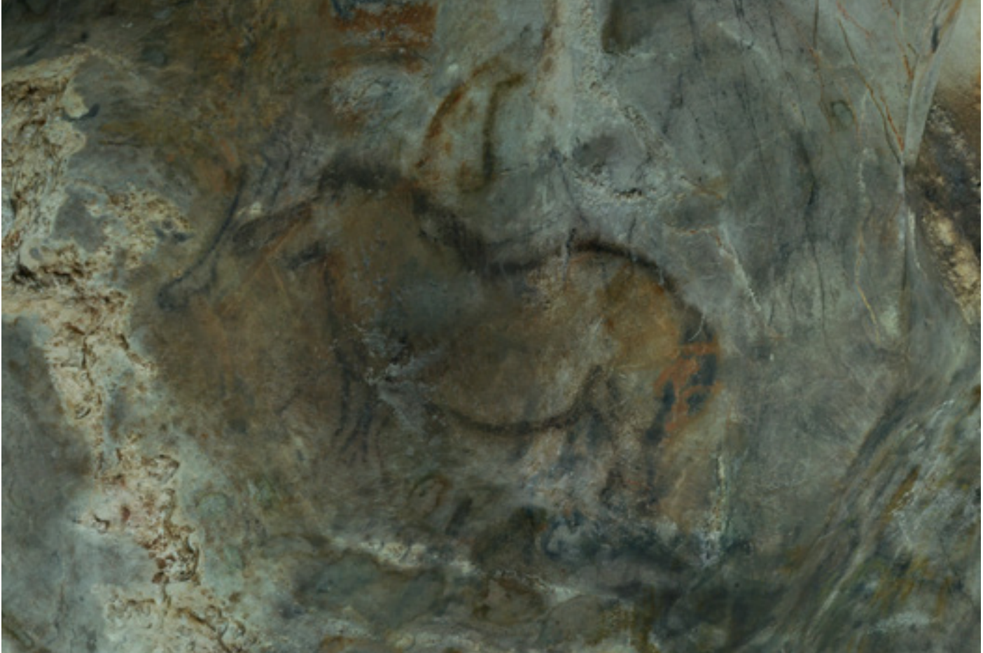
Fig. 2. Cavalo do "Camarim" da gruta da Peña de Candamo (Astúrias)

O tema mais representado da arte paleolítica é o cavalo (aproximadamente 30% do cômputo global). Os cavalos representados na arte paleolítica equiparam-se ao Equus ferus Prezwalski , uma variedade atual de cavalos da estepe, que se caracteriza por serem pequenos e robustos, terem a crineira curta, zebururas – isto é, listas de diferente tonalidade da generalidade da pelagem – nas patas e no garrote e a característica delimitação ventral em forma de M que aparece tantas vezes representada na arte paleolítica. Os cavalos têm a particularidade de ser o animal mais ubíquo da arte paleolítica, encontrando-se representados em todas as regiões e períodos, algo que o diferencia das outras espécies e que faz dele o tema animal por excelência da arte paleolítica.