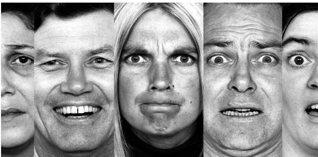
Figura 1- Emoções básica, Fonte: https://fredericoporto.com.br/importancia-das-emocoes .

expressões faciais, replicaram o reconhecimento universal de emoção na face (Matsumoto, 2001). Além disso, uma meta-análise de 168 conjuntos de dados que examinam julgamentos de emoção na face e outros estímulos não-verbais indicaram reconhecimento universal de emoção bem acima dos níveis de chance (Elfenbein & Ambady, 2002). E houve mais de 75 estudos que demonstraram que essas mesmas expressões faciais são produzidas quando as emoções são provocadas espontaneamente (Matsumoto, Keltner, Shiota, Frank e O'Sullivan, 2008). Essas descobertas são impressionantes, uma vez que foram produzidas por diferentes pesquisadores em todo o mundo em diferentes laboratórios, usando diferentes metodologias com participantes de diferentes culturas, mas todos convergindo para o mesmo conjunto de resultados. Assim, há fortes evidências para as expressões faciais universais de sete emoções - ira, desprezo, repulsa, medo, alegria, tristeza e surpresa. Outros corpos de evidência fornecem suporte para as fontes biológicas e genéticas das expressões faciais da emoção. Por exemplo, quando as emoções são espontaneamente despertadas, mesmo indivíduos cegos congenitamente produzem as mesmas expressões faciais que os indivíduos com visão (Cole, Jenkins, & Shott, 1989) 6 .