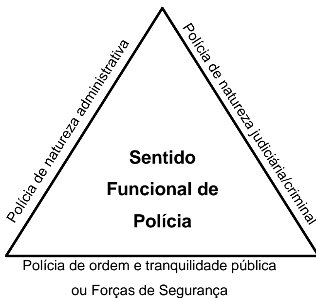
Figura 1: Sentido Funcional de Polícia na perspectiva de MANUEL VALENTE

Nota: Figura adaptada da obra: Valente, M. M. G. (2014). Teoria Geral... , pp. 68-69