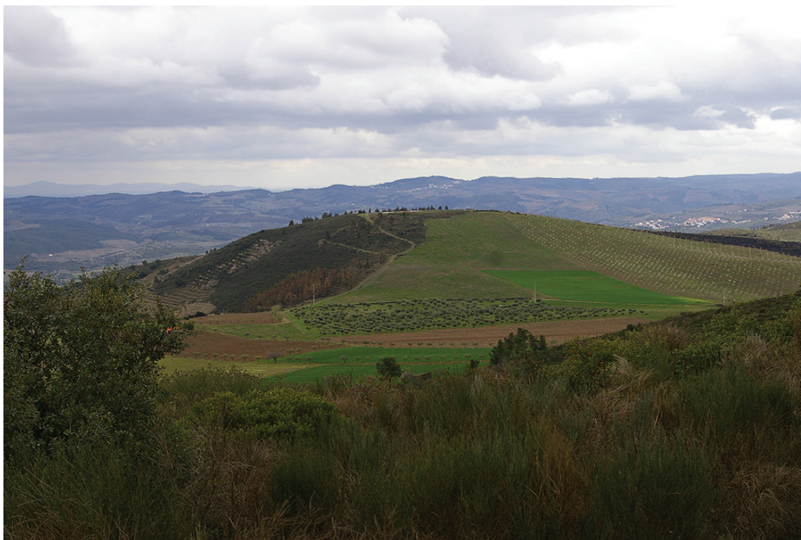
Figura 5 – Castanheiro do Vento visto de Norte.