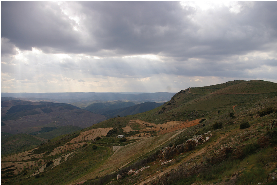
Figura 8 – O sítio arqueológico de São Gabriel. Virado ao vale do Côa (do lado esquerdo da imagem), existe o painel pintado.