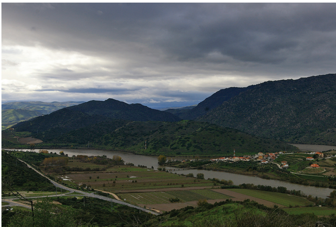
Figura 6 – Ao centro da imagem a Quinta de Alfarela, a uma cota inferior dos montes que estão por trás. É visível a sua implantação em relação à foz do rio Sabor.