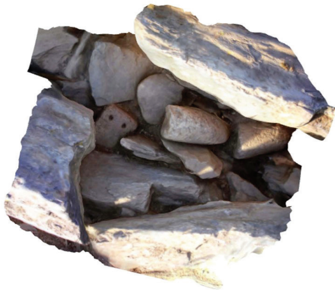
Figura 4 – Exemplo de uma deposição; um fragmento de um peso de tear e de um fragmento de um movente em granito no interior do murete 1.