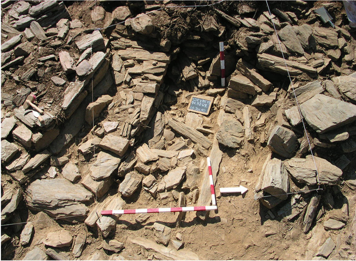
Figura 3 – Exemplo da arquitectura de acrescentos em Castanheiro do Vento, neste caso um estreitamento da passagem 5, localizada no recinto anexo.