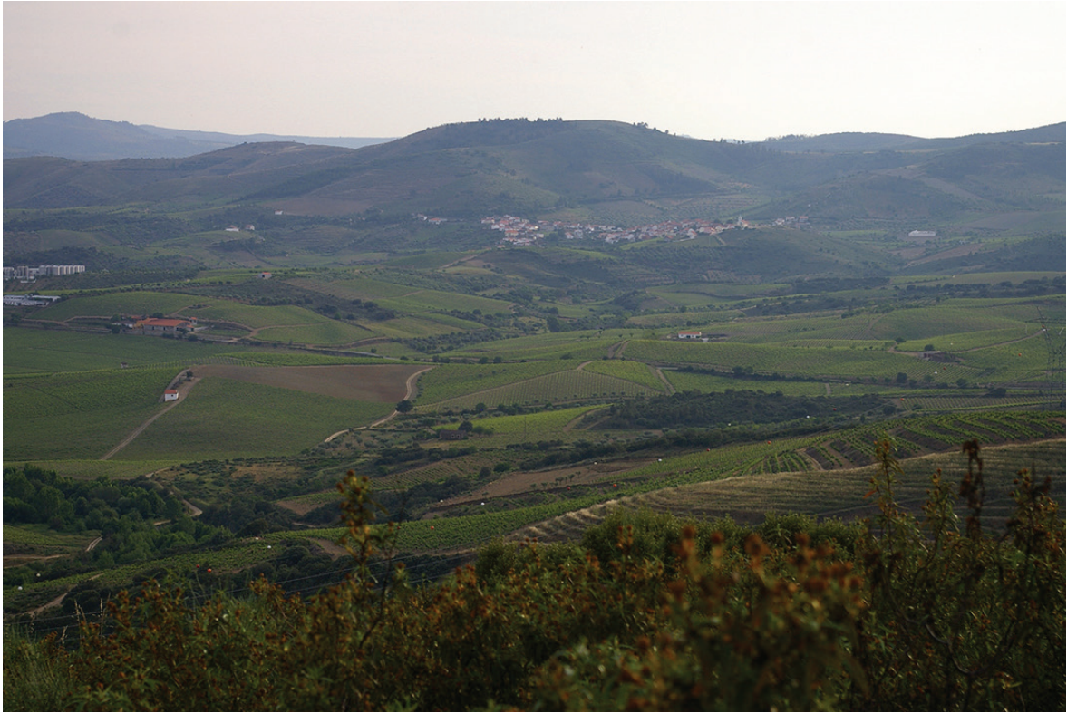
Figura 7 – Castanheiro do Vento visto do sítio da Zaralhã a nordeste.