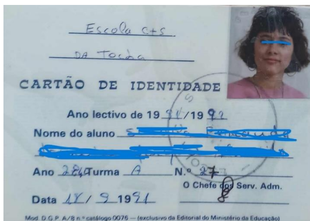
Imagem nº5 Cartão de aluno