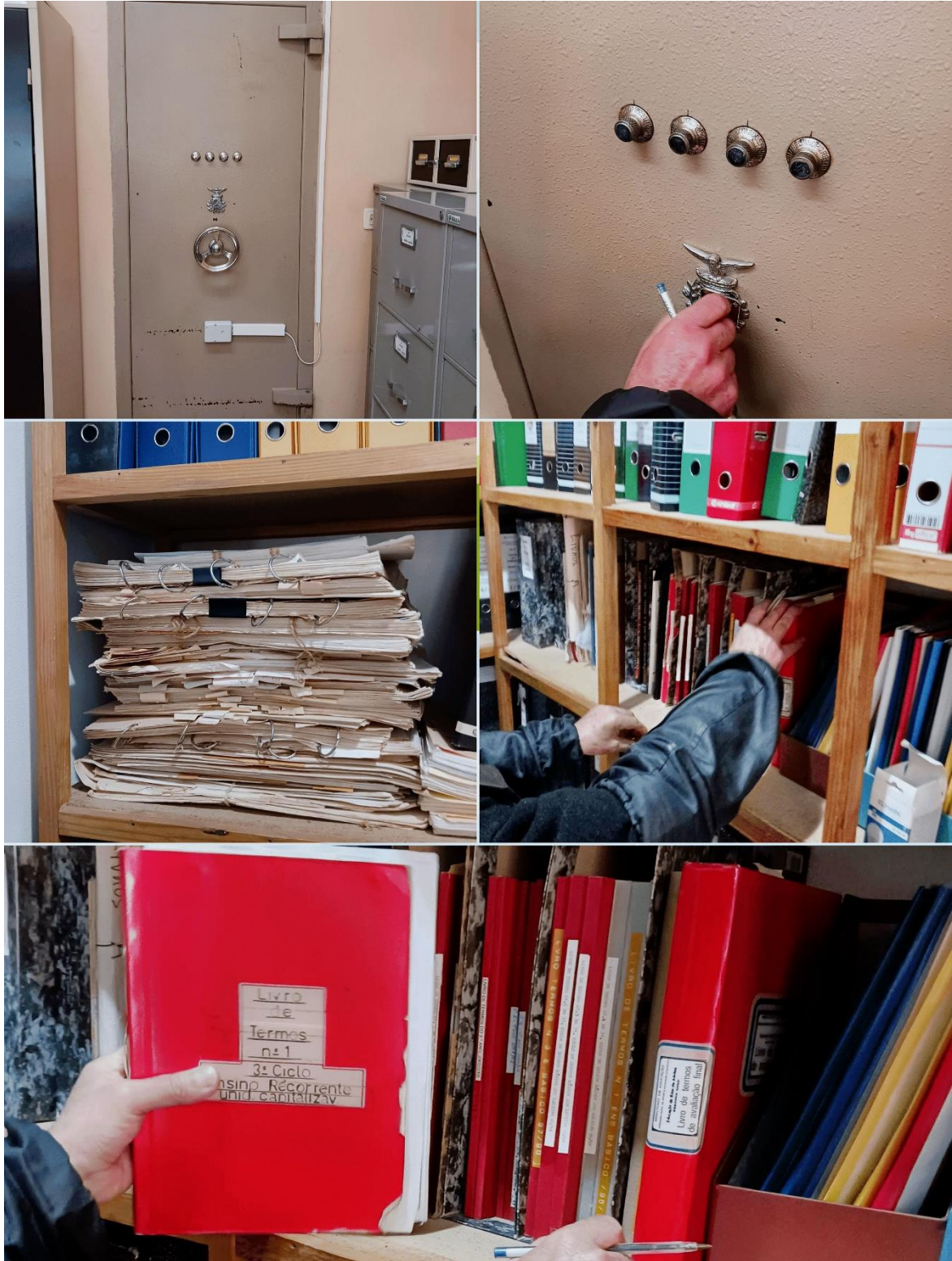
Imagem nº1 - cofre da secretaria; cadernos de pautas de avaliações; livros de registros.