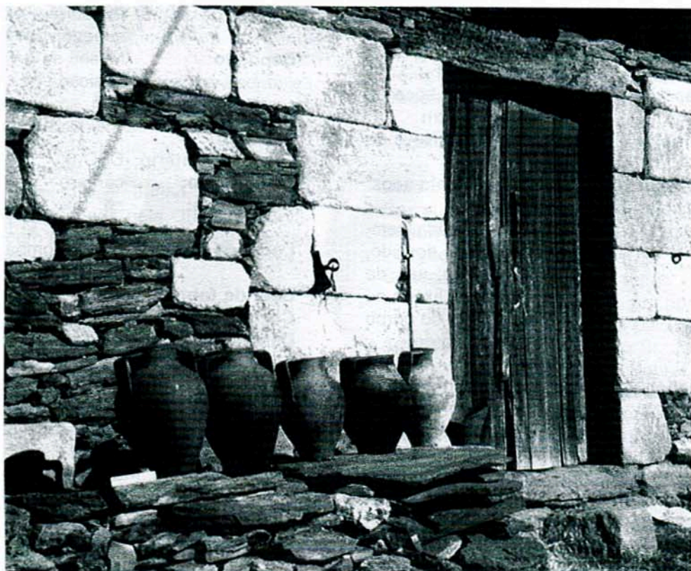
Louça de Santa Comba na Quinta de Ervamoira