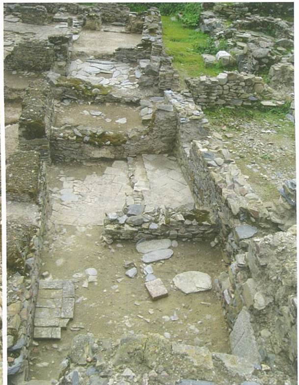
Figs. 3 e 4 - Latrina e cozinha da Casa I do bairro almóada da alcáçova de Mértola