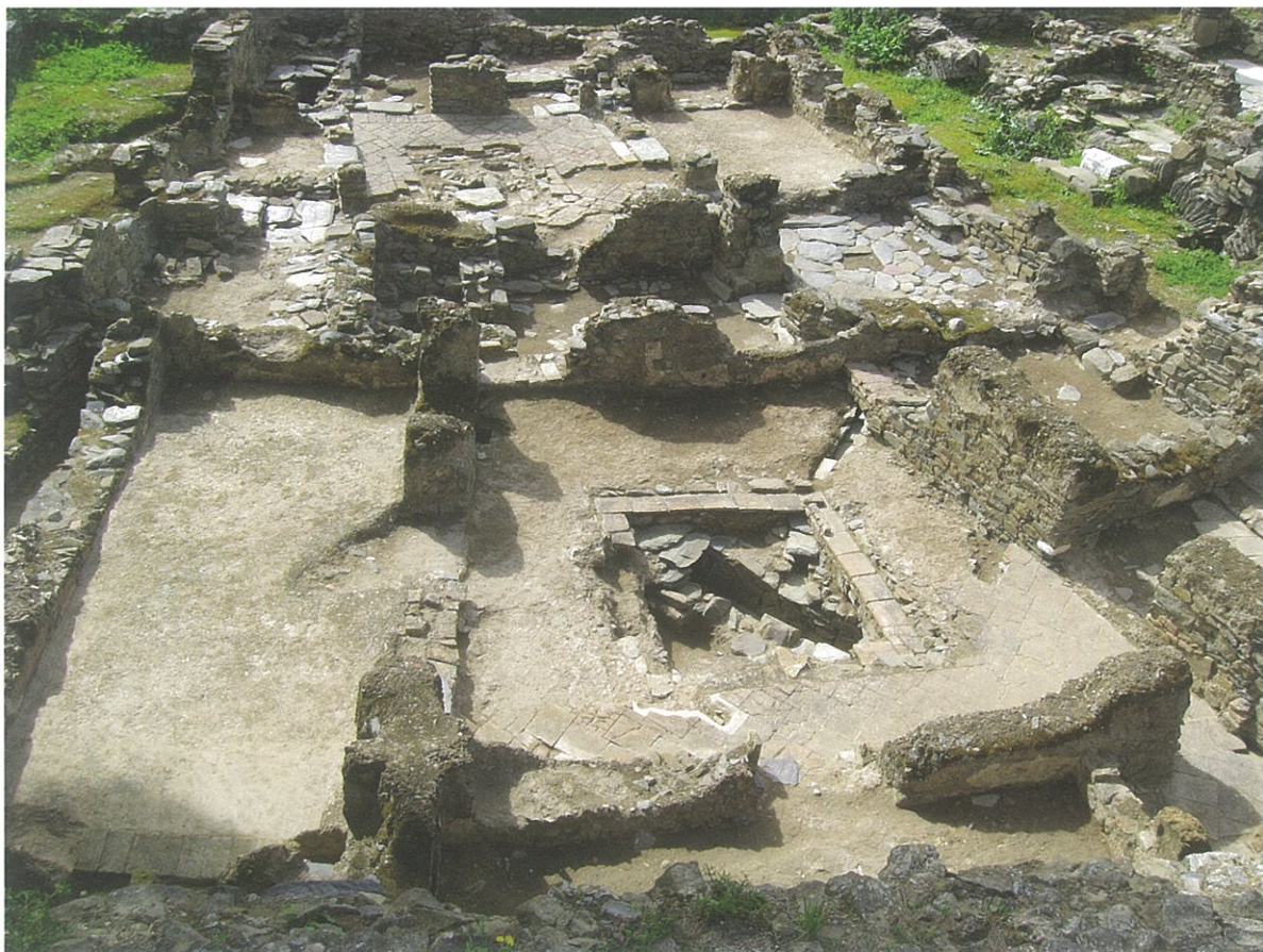
Fig. 2 - Vista geral da Casa I do bairro almóada da alcáçova de Mértola

Mértola, Almeria ou Málaga nota-se o mesmo tipo de embasamento em alvenaria sobre o qual se levantam paredes de taipa sempre com a espessura aproximada de meio metro. Os tabiques interiores em adobes, as técnicas de rebocadura e a própria decoração policroma assemelham-se nas três cidades. São habitações construídas e habitadas por uma camada social aparentemente homogénea, com interesses comuns e com frequentes contactos entre si. É um modelo de casa veiculado por todo o Mediterrâneo e que, com pequenas variações modulares, se impôs não só pelas suas qualidades intrínsecas, como também pela sua elasticidade funcional.