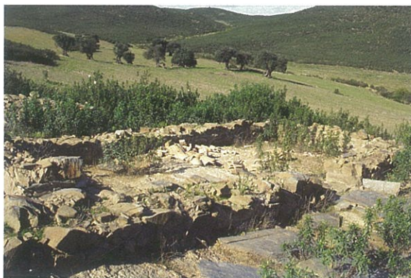
Figs. 5 e 6 - Compartimento de uma habitação no povoado islâmico de Alcaria Longa (Mértola)

Nestes dois tipos de casa camponesa – a periurbana e a serrana – o seu mobiliário, quase exclusivo, é constituído por dezenas de potes e talhas de todos os tamanhos encostados às paredes ou então, os mais pequenos, certamente