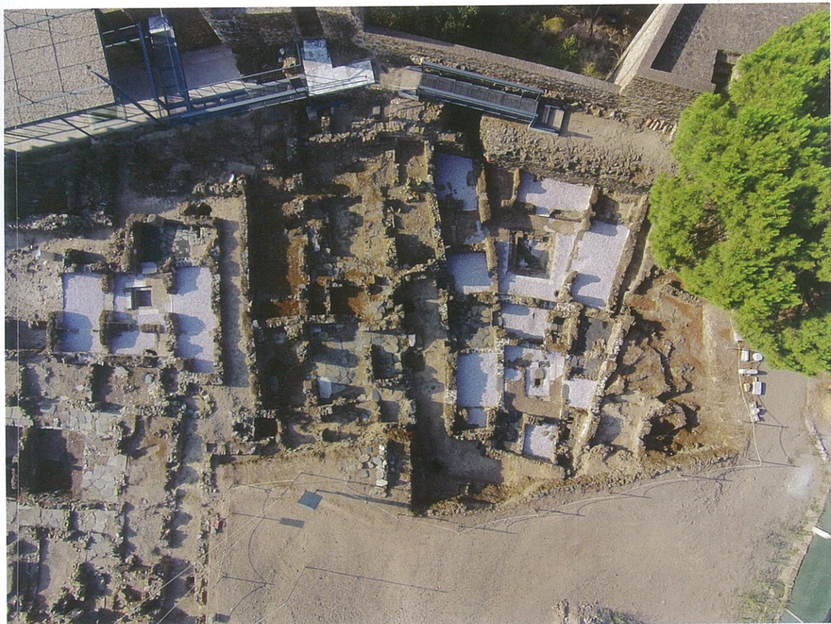
Fig. 1 - Vista aérea do bairro almóada da alcáçova de Mértola

Apesar de notórias diferenças sociais, nas duas porções deste bairro já conhecidas todos os compartimentos de cada moradia se organizam em volta de um pátio mais ou menos quadrangular. É o tipo de habitação tipicamente urbana e mediterrânica que, na sua geometria espacial e técnicas construtivas, encontramos em todas as cidades do al-Andalus. Em