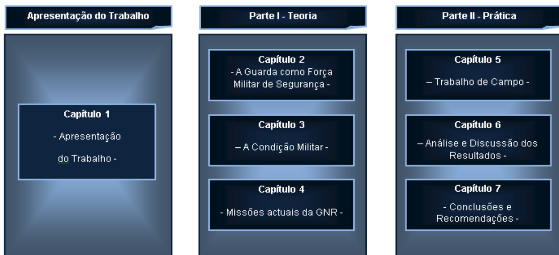
Figura 1.2: Estrutura do trabalho.

A Parte Prática inicia-se com o quinto capítulo, onde é esmiuçado o trabalho de campo desenvolvido. Segue-se o sexto capítulo, onde é apresentada a análise e discussão dos resultados obtidos. Termina com o sétimo capítulo, onde se apresentam as conclusões e recomendações. A Figura 1.2 apresenta esquematicamente a estrutura do trabalho.