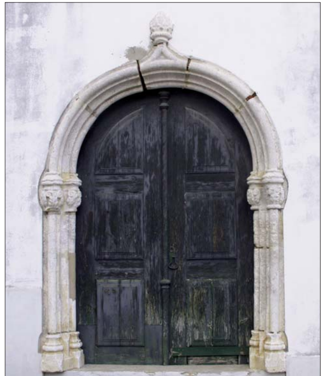
FIG. 3 – Porta lateral da igreja, em estilo Manuelino.

Item. Has paredes da dicta capella e jrmjda d'alvanaria bem guarnecidas.