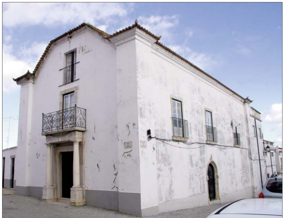
FIG. 4 – Aspeto atual da igreja, hoje casa de habitação.

Item. O corpo desta jgreja tem as paredes de pedra e cal bem guarnecidas de dentro e de fora em preto, da banda do sul duas vidraças da banda de fora com sua rede d’arame de guarda; tem de comprimento honze varas e de vão seys, o solo mal ladrilhado; da banda do sul tem hum portal de pedrarya redondo, tem duas varas d’altura, vara e mea de vão, nelle humas portas de bordo com dous postigos bem fechados, o teyto forrado de bordo de novo com duas linhas de ferro em preto; no cabo do corpo desta jgreja pera a banda do ponente estaa huma parede com huma janela com grades de ferro; antre esta parede e outra que vay além dela, estaa hum vão