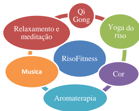
Figura 2. Áreas do conhecimento envolvidas na criação do RisoFitness

respiração (Qi Gong), permitir aos participantes experienciarem o riso através de exercícios, sensibilizar para os benefícios do riso na saúde, sensibilizar para a importância de gerar pensamentos positivos, promover estados mentais potenciadores de pensamentos positivos, praticar exercícios de meditação e de respiração