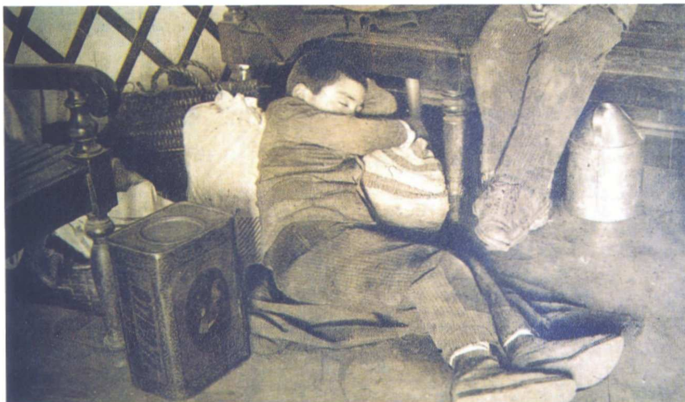
O DESCANSO do menino trabalhador, na estação ferroviária do Rossio, em Lisboa.

Em sùmula, ao analisarmos as políticas de combate ao desemprego nestes anos de ouro do Estado Novo, não nos é difícil concluir que as mesmas tiveram um cariz oportunista, precário, com fortes matizes de um paternalismo invasor e infantilizante. /A.A.C.