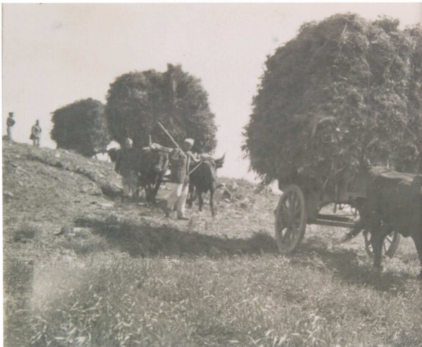
A QUINTA do Pisão, na encosta da serra de Sintra, cultivada por presos e «alienados». Foto de 1949.

prego» que financiará a sua acção. Este fundo era constituído pela cotização dos patrões do comércio e indústria, que contribuíam com um por cento da importância paga em salários, vencimentos e gratificações, percentagens, subsídios, prémios, diuturnidades ou quaisquer outras remunerações fixas ou eventuais. Os trabalhadores, por sua vez, descontavam dois por cento das rubricas referidas. A responsabilidade pela liquidação destas cobranças estava a cargo das enti-